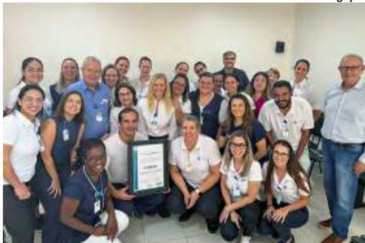
Equipe HFC Saúde

“Essa norma internacional, específica para a movimentação segura de pacientes, atesta a excelência dos processos e a preocupação do hospital com o bem-estar e a segurança de seus colaboradores e pacientes”