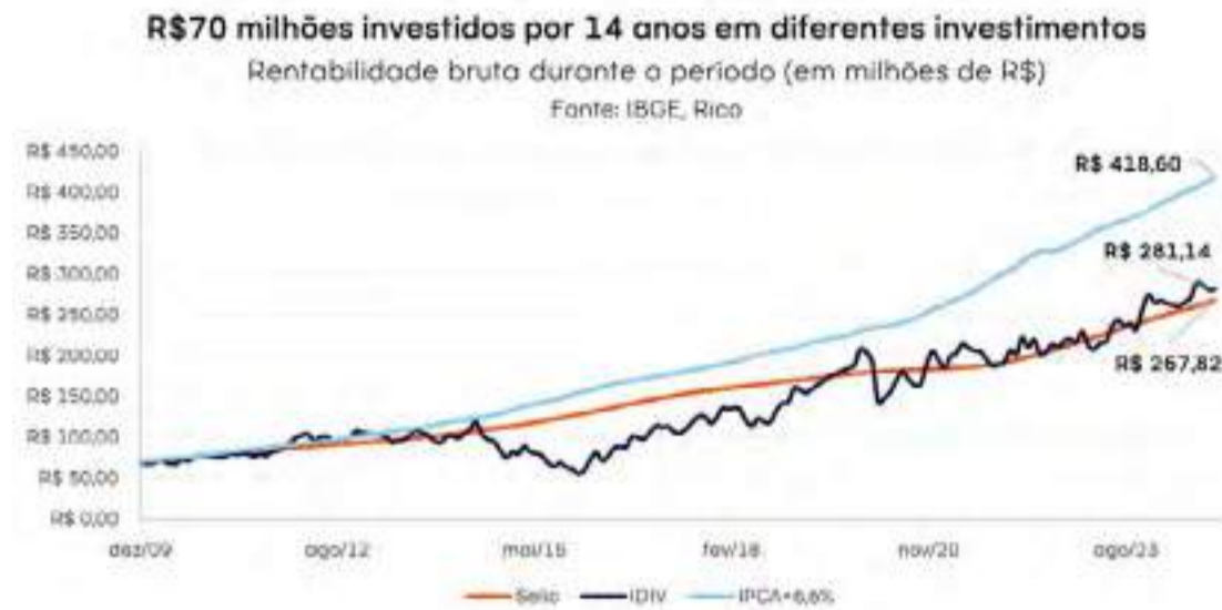
Gráfico Resultado sortudo 1

Agora, imagina você ganhando esse prêmio: escolheria investi-lo ou gastar com vários “mimos”? Daria prioridade para multiplicar