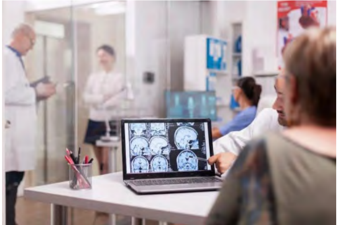
A abordagem terapêutica é capaz de reorganizar projeções neurais remanescentes na medula espinhal, promovendo melhorias funcionais duradouras em humanos

melhorias funcionais duradouras em humanos. Os participantes do estudo relataram progresso imediato na marcha, com aumento na resistência e redução do esforço percebido. Um dos participantes pode subir os degraus de uma escada. Resultados promissores de um ensaio piloto mostraram que, além das melhorias clínicas, a neuroestimulação pode mediar reorganizações neurais que persistem mesmo após o desligamento do dispositivo, destacando seu potencial como um novo paradigma terapêutico.