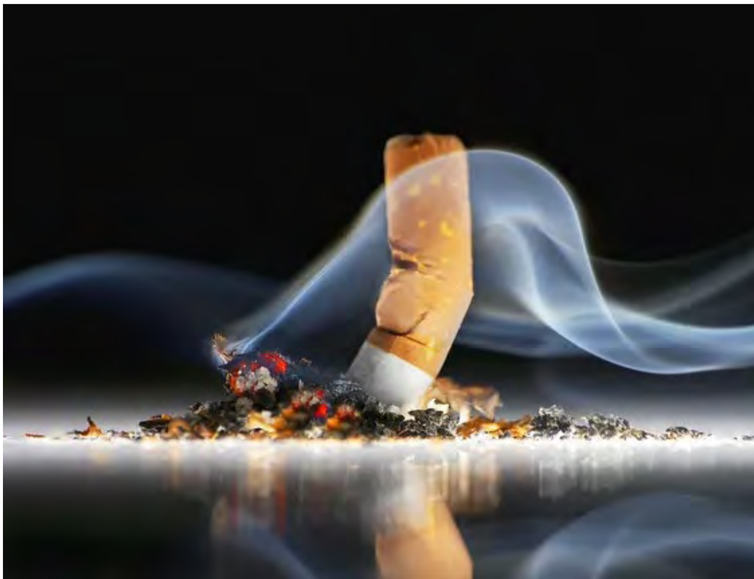
Fumar afeta diretamente a estrutura cerebral e intensifica o estresse oxidativo e a inflamação crônica

No entanto, a boa notícia trazida por esta pesquisa é que, mesmo após décadas de exposição aos efeitos nocivos do cigarro, o risco de demência pode ser mitigado pela interrupção do tabagismo, independentemente da