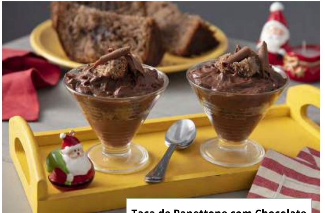
Taça de Panettone com Chocolate

O panettone é um clássico natalino inconfundível. Mas o que fazer com tanto panettone que sobrou do Natal? Confira a seguir quatro sugestões de receitas da Nestlé que farão sucesso na sua celebração