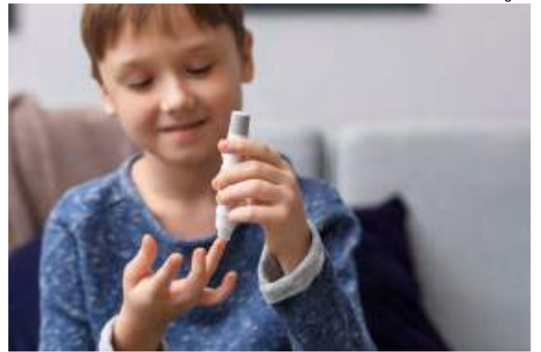
As sequelas ao longo da vida podem ser graves e o diagnóstico precoce e início de cuidados podem evitar complicações