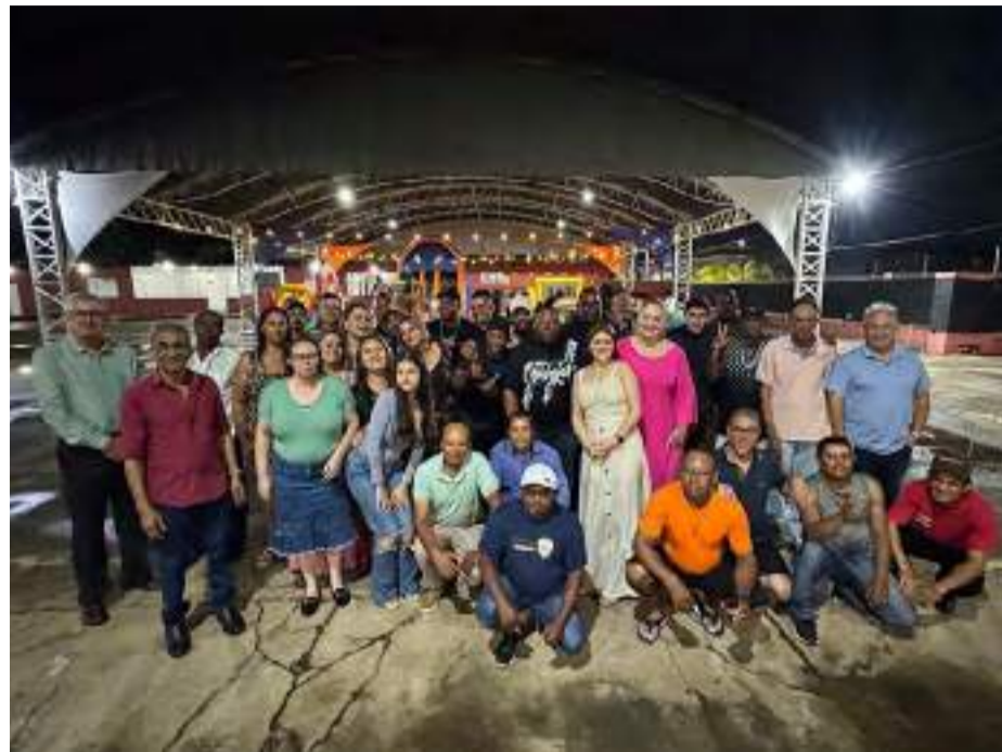
A equipe que trabalha incansavelmente para proporcionar um ambiente acolhedor e respeitoso é parte fundamental dessa missão

Gostaríamos de aproveitar este momento para agradecer a todos que fazem parte da nossa jornada no Parque da Ressurreição. Sua presença, apoio e dedicação tornaram este ano extraordinário. A equipe que trabalha incansavelmente para proporcionar um ambiente acolhedor e respeitoso é parte