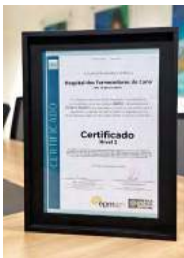
Certificado da Escola OCRA Brasileira