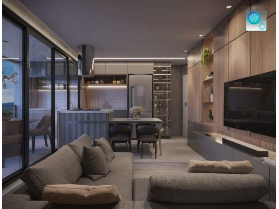
Um apartamento para alugar em Piracicaba pode ser a pedida ideal para quem ainda não se decidiu sobre região ou metragem

O mercado imobiliário de Piracicaba oferece diversos apartamentos que atendem aos mais diferentes perfis. Alugar um apartamento em Piracicaba une de maneira ímpar economia e minimalismo, luxo e alto padrão, além de apresentar conforto em todas as opções. Para escolher a melhor opção, conte com a consultoria especializada de um corretor associado