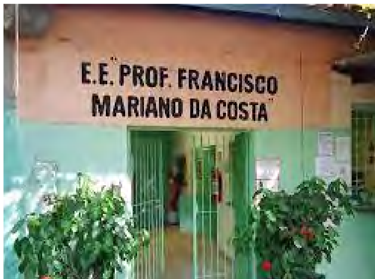
A EE Professor Francisco Mariano da Costa, localizada no bairro Novo Horizonte, utilizará o recurso para realização de diversas melhorias no prédio escolar

Pedro de Mello foram destinados R$ 100 mil, enquanto que para a EE Dr. Jorge Coury R$ 200 mil e R$ 150 mil para a ETEC "Ary Pedroso", ambas na Paulista, e R$ 100 mil para a Escola Municipal Roberta Eleutério Amaral. Todos esses recursos são para a realização de melhorias nos prédios escolares.