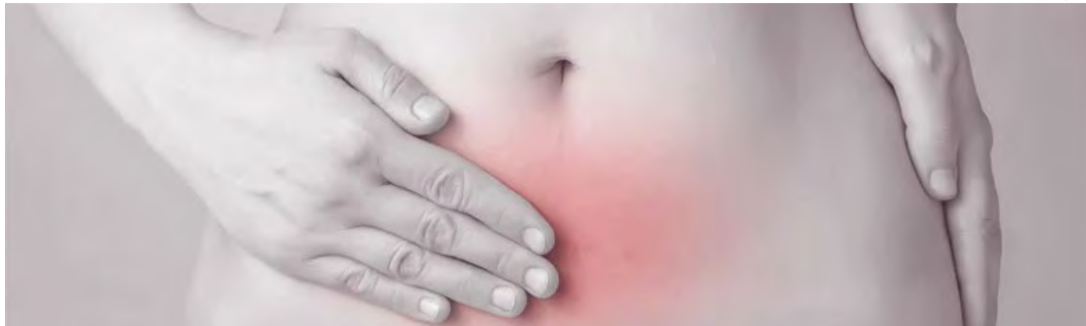
O problema acomete 80% das mulheres em idade fértil, entretanto, não são todas que desenvolvem complicações

“O problema acomete 80% das mulheres em idade fértil, entretanto, não são todas que desenvolvem complicações como, por exemplo, dores importantes, sangramento uterino anormal ou infertilidade”