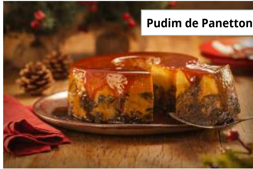
Pudim de Panettone Talento Avelã

Decore-os com o Creme de Leite reservado, cerejas em calda e sirva a seguir.