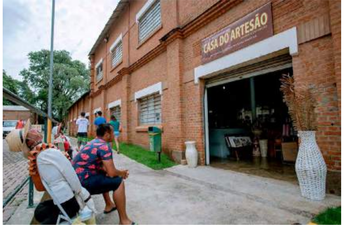
Casa do Artesão do Engenho Central estará aberta no primeiro dia de 2025