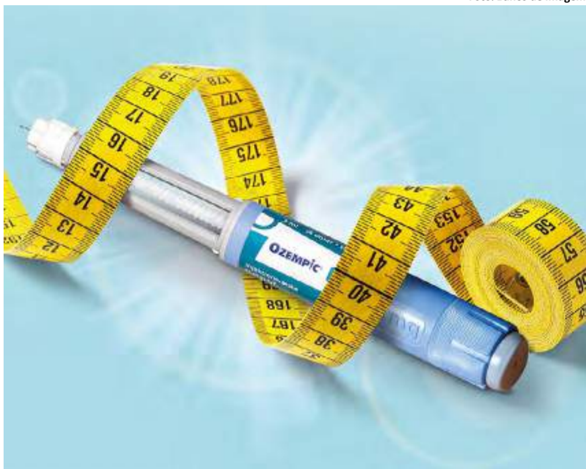
Aprovado pela Anvisa em 2023, o medicamento ainda não é comercializado no Brasil devido a decisões estratégicas da fabricante

● Alto custo: O processo de importação e a tecnologia envolvida tornam o medicamento mais caro.