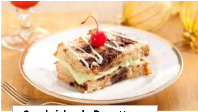
Sanduíche de Panettone Alpino Recheio Cremoso