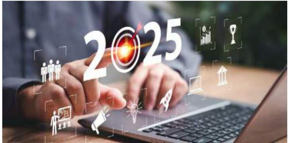
No caso das exportações, o cenário para o Brasil é bastante otimista

Para o próximo ano, a previsão do Produto Interno Bruto (PIB), se configura entre 1,7% e 2,5% de crescimento, levando em consideração as altas taxas de juros e seu reflexo no pagamento dos juros da dívida pública.