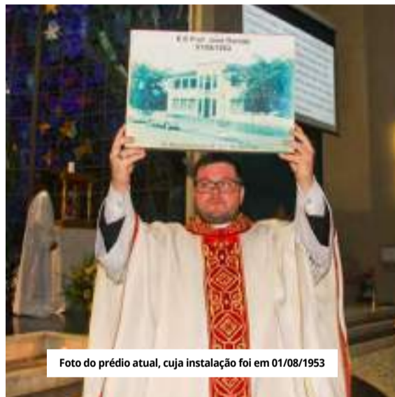
Foto do prédio atual, cuja instalação foi em 01/08/1953