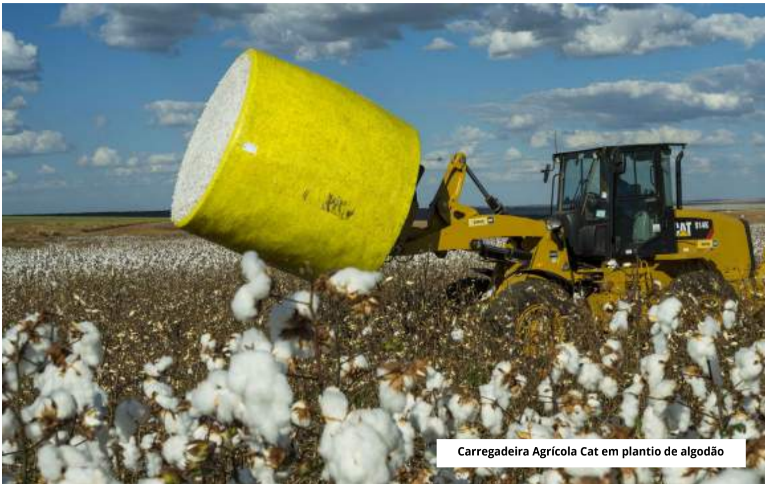
Carregadeira Agrícola Cat em plantio de algodão

É importante destacar a visão de sustentabilidade da Caterpillar, pois ela não está limitada a processos fabris de redução de consumo e resíduos. Sustentabilidade para a empresa vem de criar produtos e serviços que tornarão as operações dos seus clientes mais sustentáveis. Como, por exemplo, os ganhos em produtividade com novas tecnologias, economia de combustível, segurança na operação etc. Ou seja, ao utilizarem as soluções Caterpillar, os clientes estão tornando suas opera-