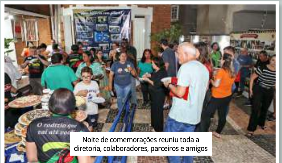
Noite de comemorações reuniu toda a diretoria, colaboradores, parceiros e amigos