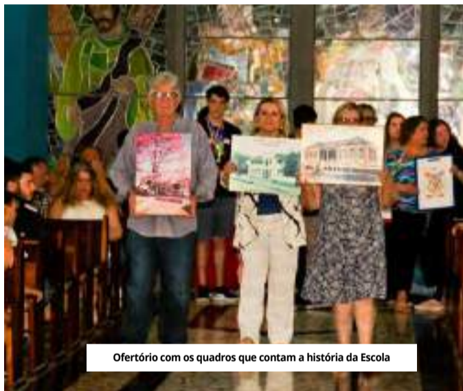
Ofertório com os quadros que contam a história da Escola