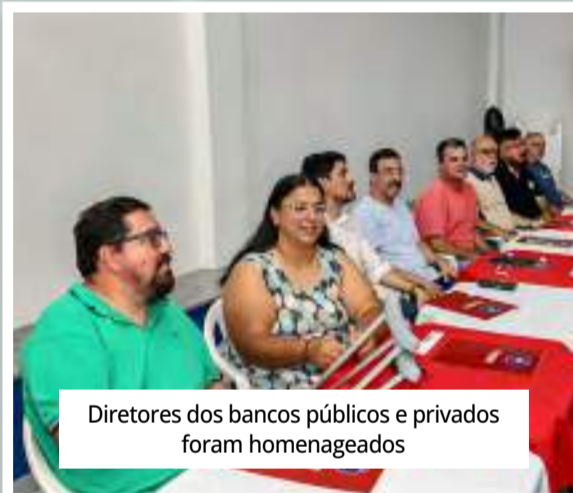
Diretores dos bancos públicos e privados foram homenageados