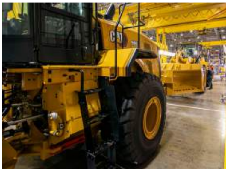
Nova Linha de Carregadeiras Inaugurada em Maio 2024