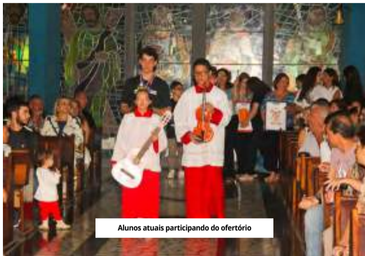
Alunos atuais participando do ofertório