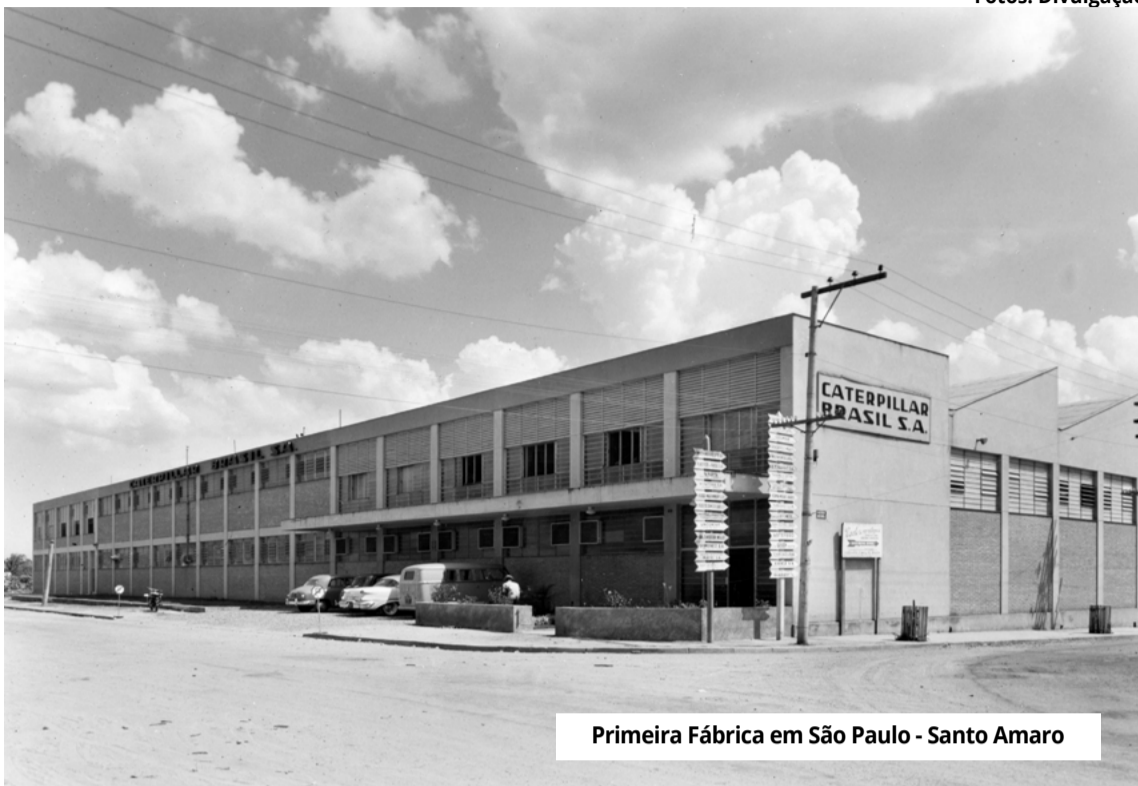
Primeira Fábrica em São Paulo - Santo Amaro

Em 1960, foi inaugurada a primeira fábrica da Caterpillar no Brasil, no bairro de Santo Amaro em São Paulo, e a primeira máquina produzida foi uma motoniveladora 12E, tornando a Caterpillar a empresa pioneira na produção de máquinas pesadas no país.