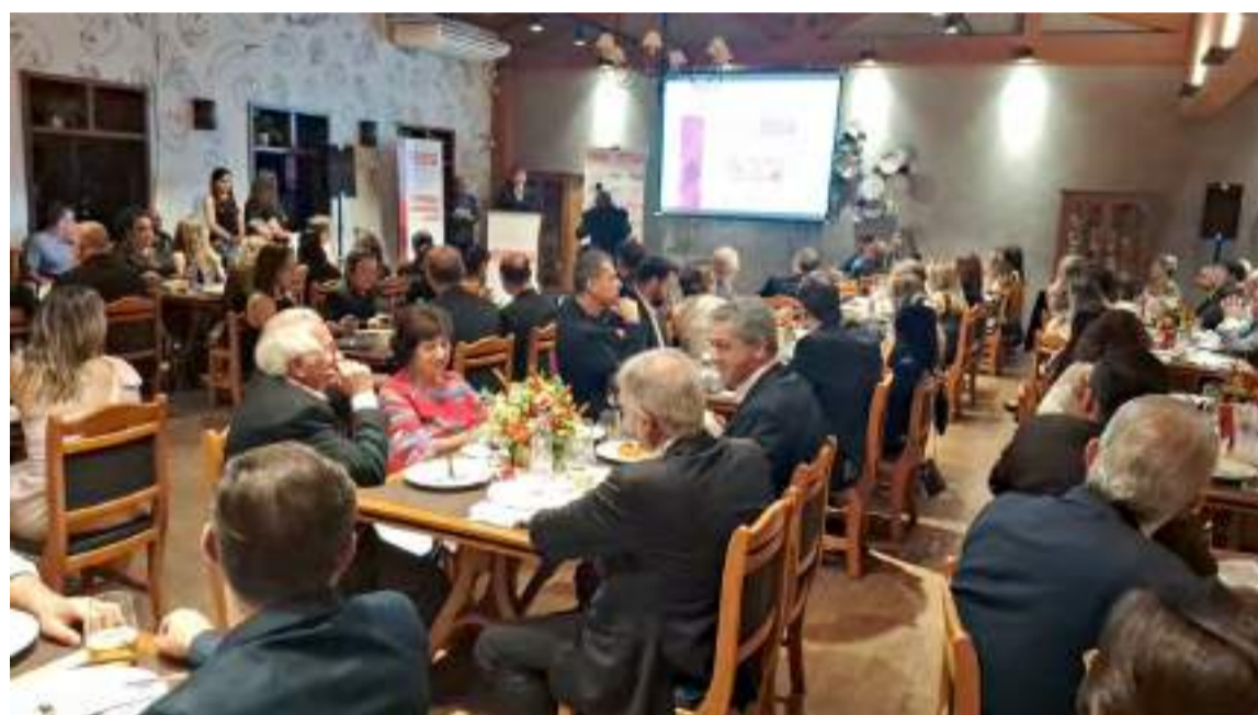
O evento contou com 21 empresas apoiadoras

tular do CIESP-Piracicaba, “o evento é essencial para valorizar, incentivar e reconhecer essas empresas, tanto na indústria local e regional quanto na sociedade em geral, fortalecendo o compromisso com o desenvolvimento sustentável do setor”.