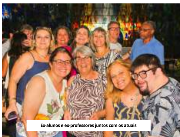
Ex-alunos e ex-professores juntos com os atuais