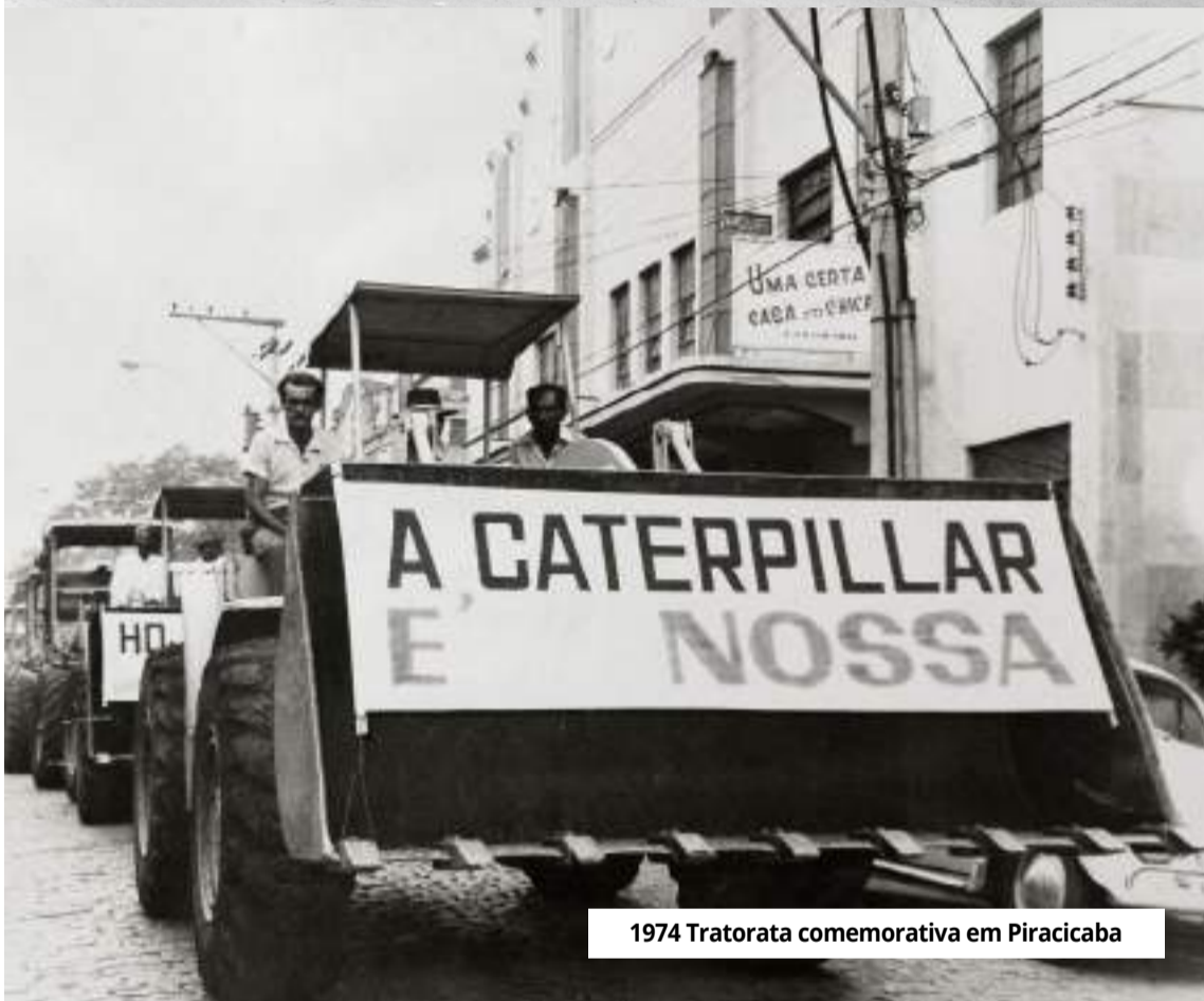
1974 Tratorata comemorativa em Piracicaba