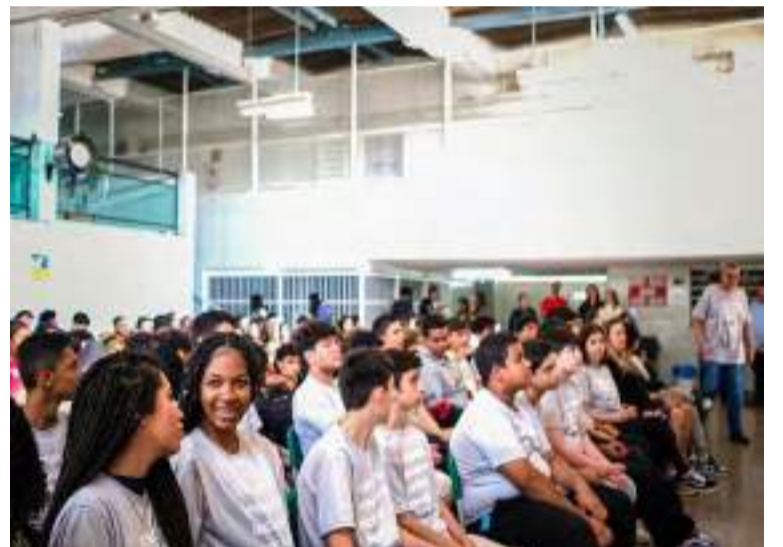
Alunos das Escolas Municipais Benedicta Penezzi e João Oriani participam de oficinas