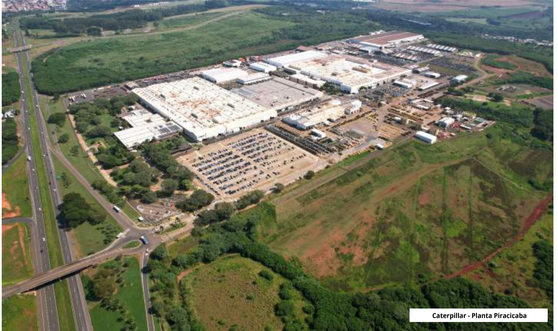
Caterpillar - Planta Piracicaba

Para poder acompanhar as crescentes demandas do mercado brasileiro na década de 1970, a Caterpillar tinha planejado a expansão de seu parque industrial para Piracicaba, para onde transferiu a sua unidade fabril em 1976.