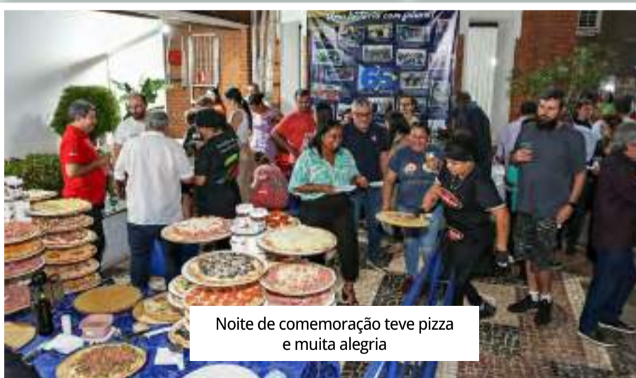
Noite de comemoração teve pizza e muita alegria