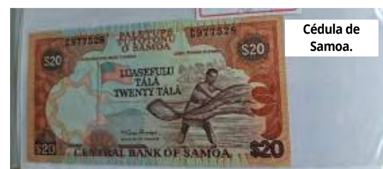
Cédula de Samoa.