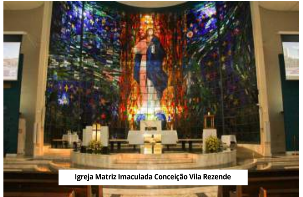
Igreja Matriz Imaculada Conceição Vila Rezende