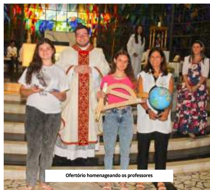
Ofertório homenageando os professores