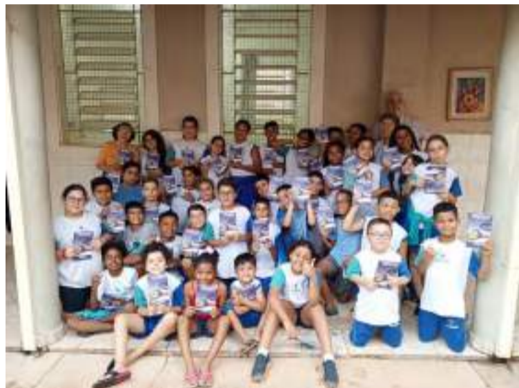
Alunos participantes do Projeto Mentis Criativas