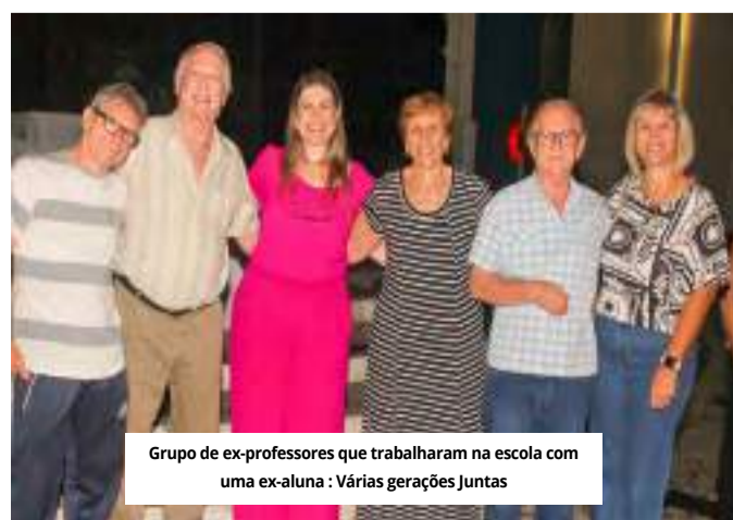
Grupo de ex-professores que trabalharam na escola com uma ex-aluna : Várias gerações Juntas