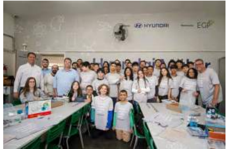
O projeto Conectados do Bem reforça o uso da tecnologia para o impulsionamento do desenvolvimento social e econômico

O projeto Conectados do Bem reforça o uso da tecnologia para o impulsionamento do desenvolvimento social e econômico. Durante as oficinas, os jovens são estimulados a abraçarem seu potencial como criadores, inovadores e solucionadores de problemas, capacitando essa nova geração com as ferramentas necessárias para enfrentar os desafios do futuro e os preparando para os avanços tecnológicos e as demandas da economia atual.