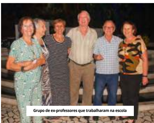
Grupo de ex-professores que trabalharam na escola