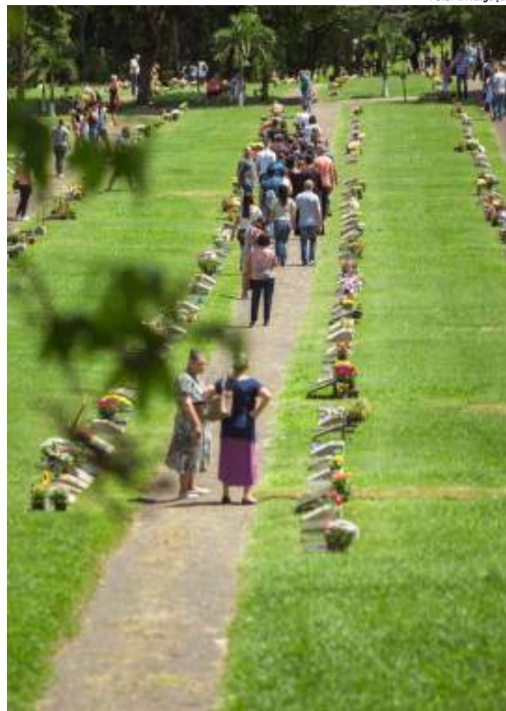
No Cemitério Parque da Ressurreição a natureza, com suas árvores e flores, reforça a sensação de continuidade e renovação