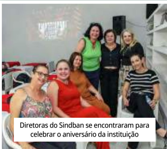
Diretoras do Sindban se encontraram para celebrar o aniversário da instituição