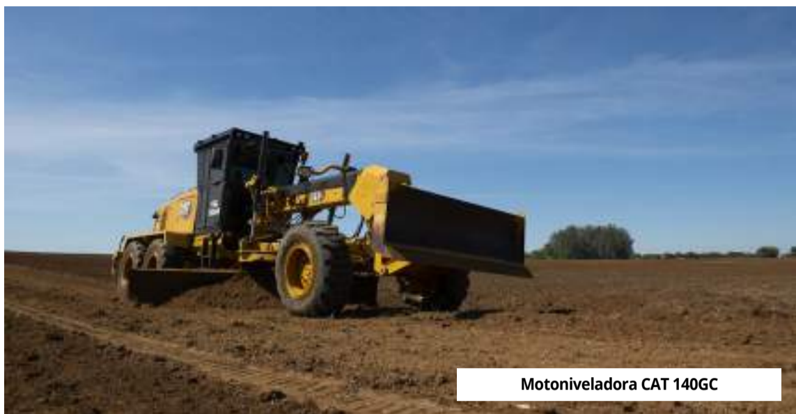
Motoniveladora CAT 140GC

Na unidade de mangueiras hidráulicas, a Caterpillar produz mais de 4.000 peças diferentes e é uma das diversas operações de montagem de mangueiras da Caterpillar em todo o mundo. Conjuntos de mangueiras produzidos localmente permitem que a peça certa esteja disponível no momento certo para dar suporte às diversas linhas de produtos da Caterpillar no Brasil.