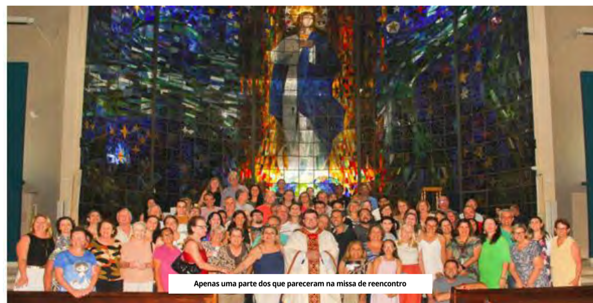
Apenas uma parte dos que pareceram na missa de reencontro