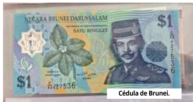
Cédula de Brunei.