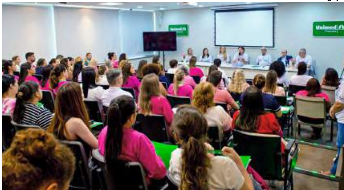
Outubro Rosa - Unimed

com a presença de colaboradoras e beneficiárias da Unimed Piracicaba que tiveram o diagnóstico confirmado do câncer de mama e conseguiram dar a volta por cima, graças à assistência médica da Cooperativa e a rede de apoio de familiares e amigos, além de relatos da experiência do trabalho voluntário prestado a pacientes com câncer.