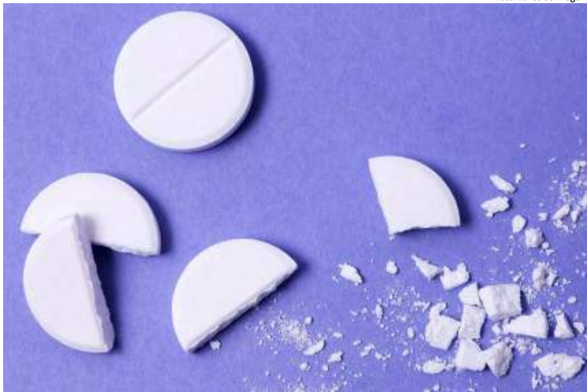
Comprimidos que não possuem sulco, em hipótese alguma, devem ser partidos

“Abrir cápsulas ou fracionar comprimidos pode resultar em dosagens subterapêuticas ou até em sobredosagens, comprometendo o tratamento e potencialmente levando à progressão da doença”