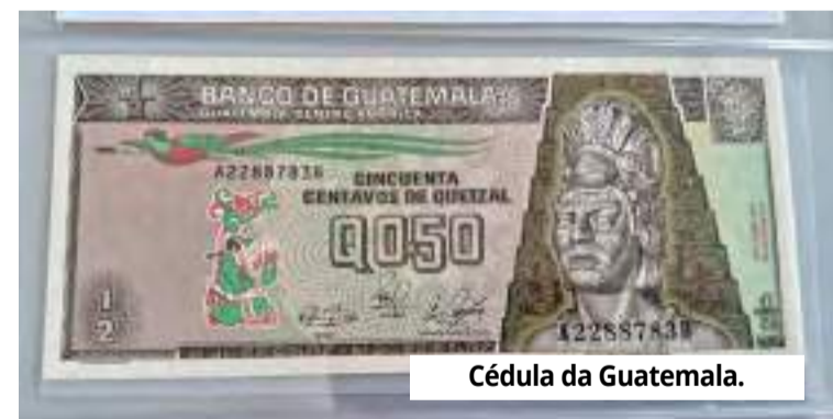
Cédula da Guatemala.