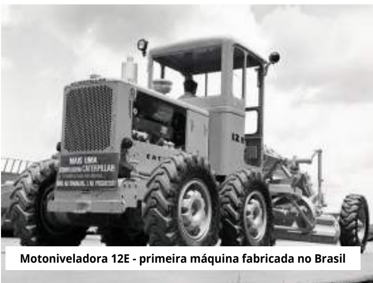
Motoniveladora 12E - primeira máquina fabricada no Brasil