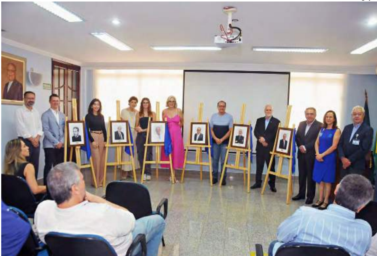
Implantação da Galeria de Honra do Departamento de Cirurgia e Traumatologia Bucomaxilofacial da Santa Casa de Piracicaba

“Vimos o desempenho desses profissionais ao longo dos últimos 84 anos no nosso Hospital e estamos orgulhosos por esta trajetória de sucesso e crescimento que tanto tem elevado a presença e a importância da nossa Instituição no cenário da saúde regional, e certamente nacional”