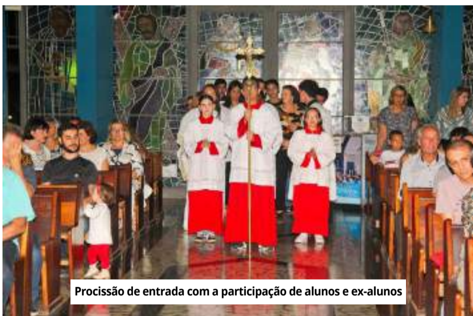
Procissão de entrada com a participação de alunos e ex-alunos