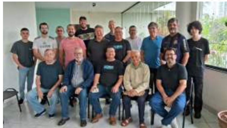
Participantes da reunião do Clube Filatélico de Piracicaba, no último domingo no NEA/Mirante.