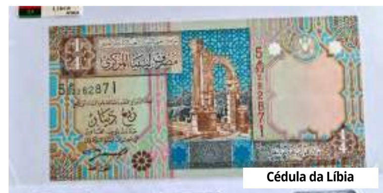
Cédula da Líbia