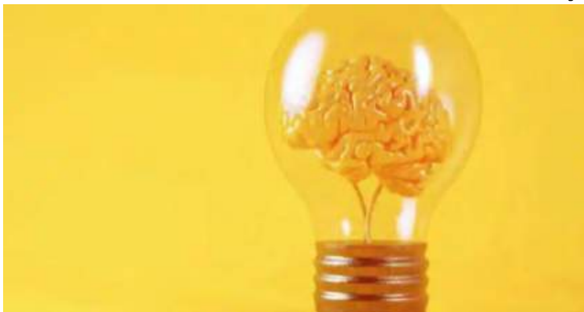
Outras práticas importantes para paralisar o envelhecimento incluem a meditação e a gratidão

“Para obter resultados eficazes, é fundamental evitar ambientes e pessoas tóxicas. A exposição contínua a pessoas negativas pode baixar a frequência vibracional e, assim, acelerar o envelhecimento...”