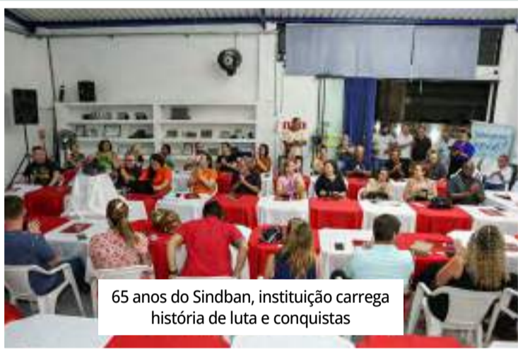
65 anos do Sindban, instituição carrega história de luta e conquistas