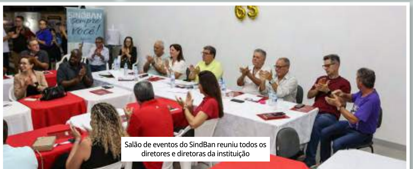
Salão de eventos do SindBan reuniu todos os diretores e diretoras da instituição