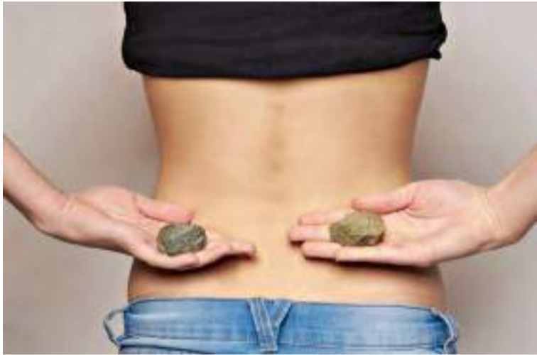
Os cálculos renais se formam a partir de cristais nos rins ou nas vias urinárias.

“Infecções urinárias recorrentes são comuns em pacientes com cálculos renais e podem ser um fator de risco para o desenvolvimento de DRC”