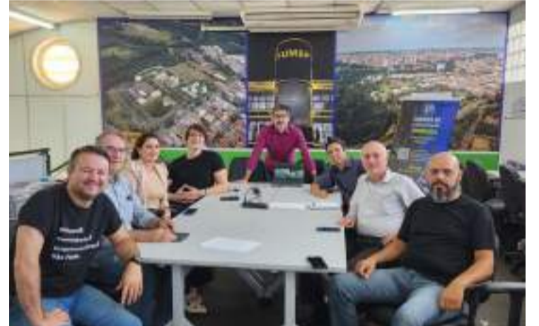
Diretores da Atepi, gestão 2023-2025

Cadeia Produtiva Local (CPL) de Tecnologia da Informação e Comunicação (TINSPIRA), que abrange a Região Metropolitana de Piracicaba, acaba de alcançar um marco importante: o reconhecimento como Cadeia Produtiva Local Consolidada pelo Programa Estadual SP Produz.