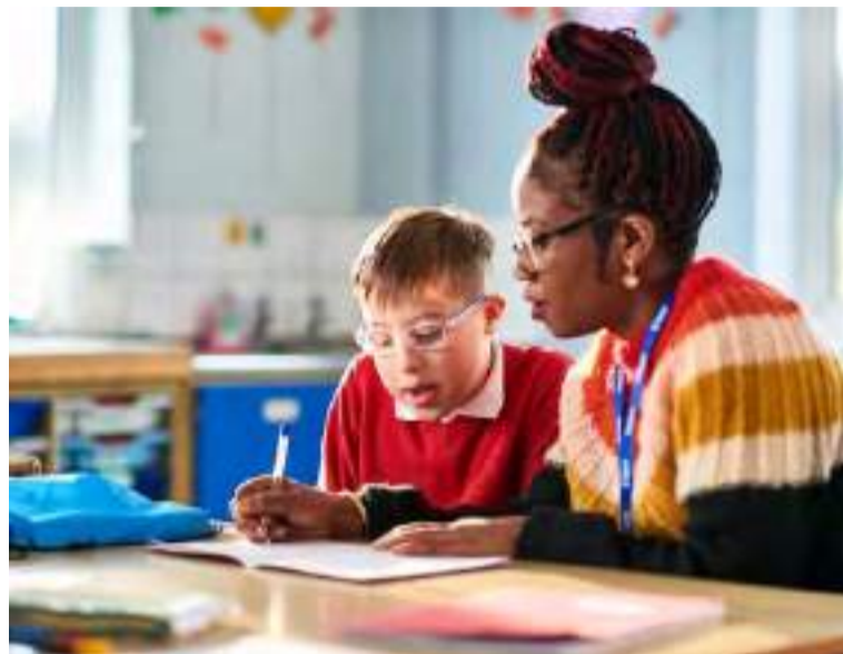
A aplicação dessa nova lei traz desafios práticos para as escolas

Os pais e responsáveis têm um papel central na fiscalização da aplicação da lei, mas a advogada ressalta que a responsabilidade