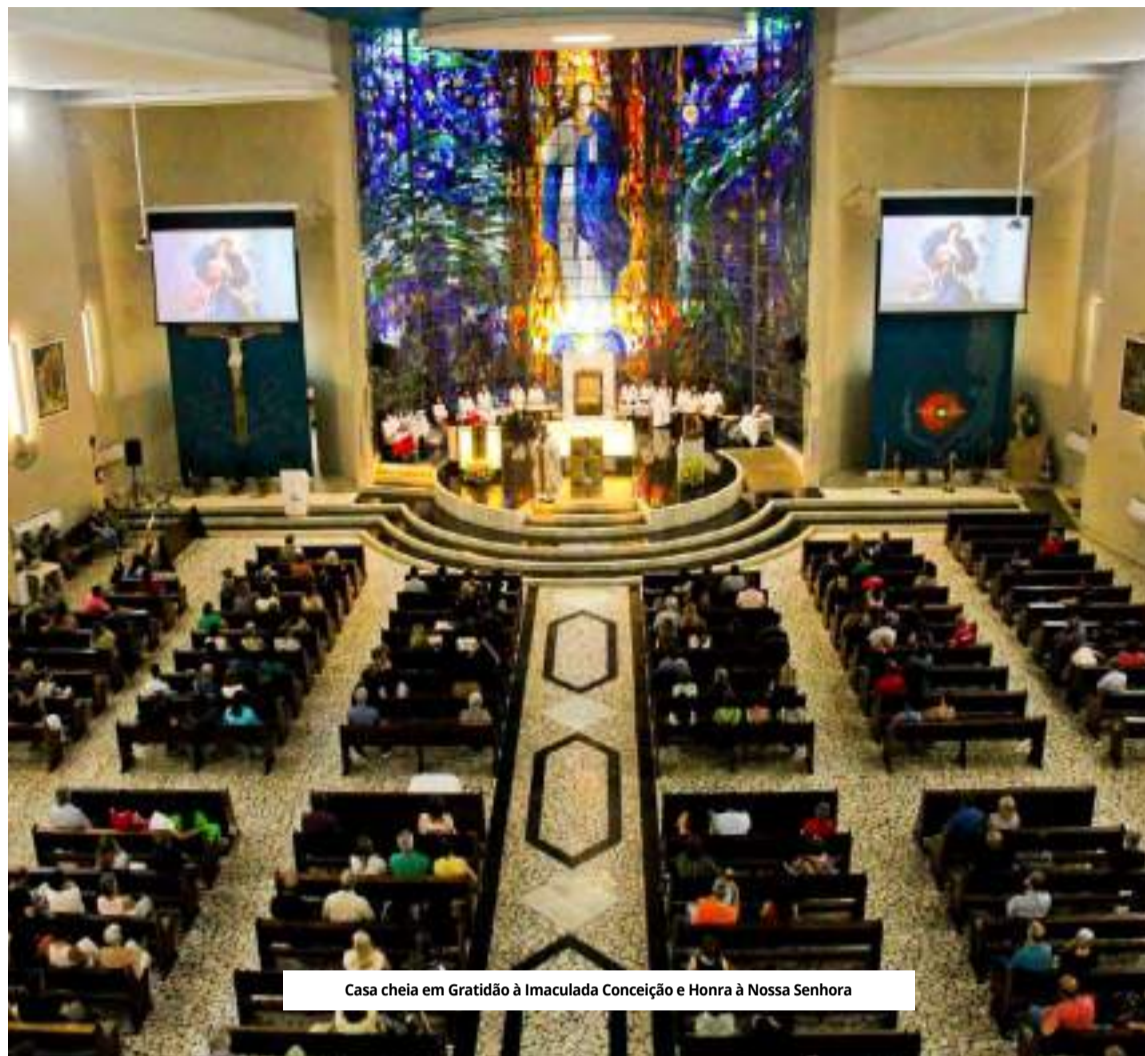
Casa cheia em Gratidão à Imaculada Conceição e Honra à Nossa Senhora