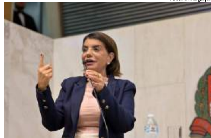
Bebel diz que educação e escolas públicas não são mercadorias para serem leiloadas ou vendidas