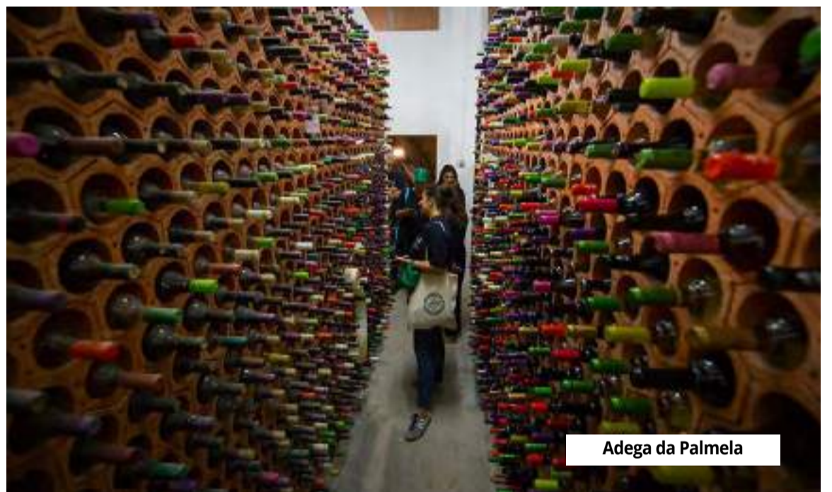
Adega da Palmela