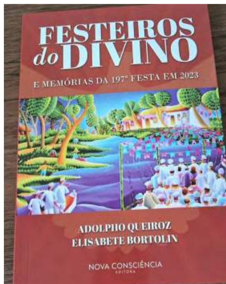
Festeiros do divino, que escrevi com Bete Bortolin