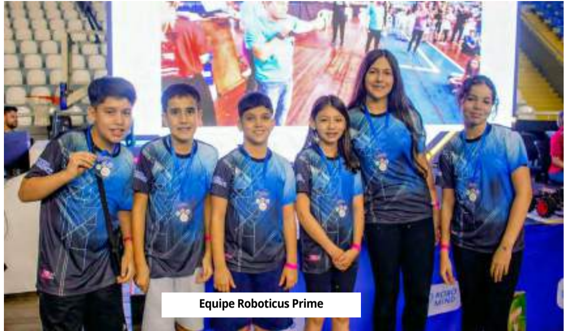
Equipe Roboticus Prime

Com as recentes conquistas, os alunos do Colégio Piracicabano seguem motivados para novos desafios, reforçando o compromisso da instituição com a inovação, a educação de qualidade e o desenvolvimento de talentos na área de tecnologia e robótica.