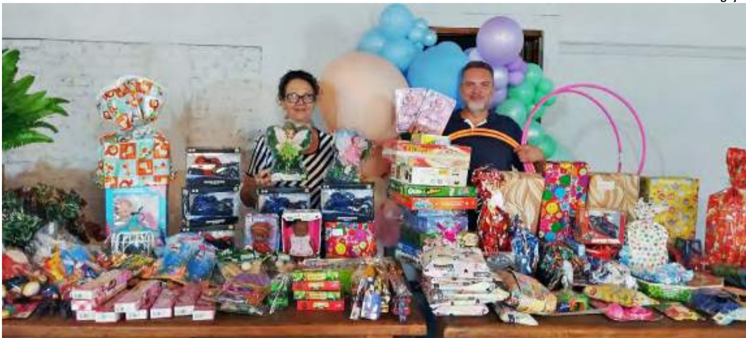
Padrinhos da Alegria

Com o objetivo de arrecadar brinquedos para crianças no Dia das Crianças, a ação contou com a participação de diversos influenciadores e empresários da cidade que se uniram como padrinhos desta causa nobre. A campanha, que se estendeu até o dia 09/10, culminou em um