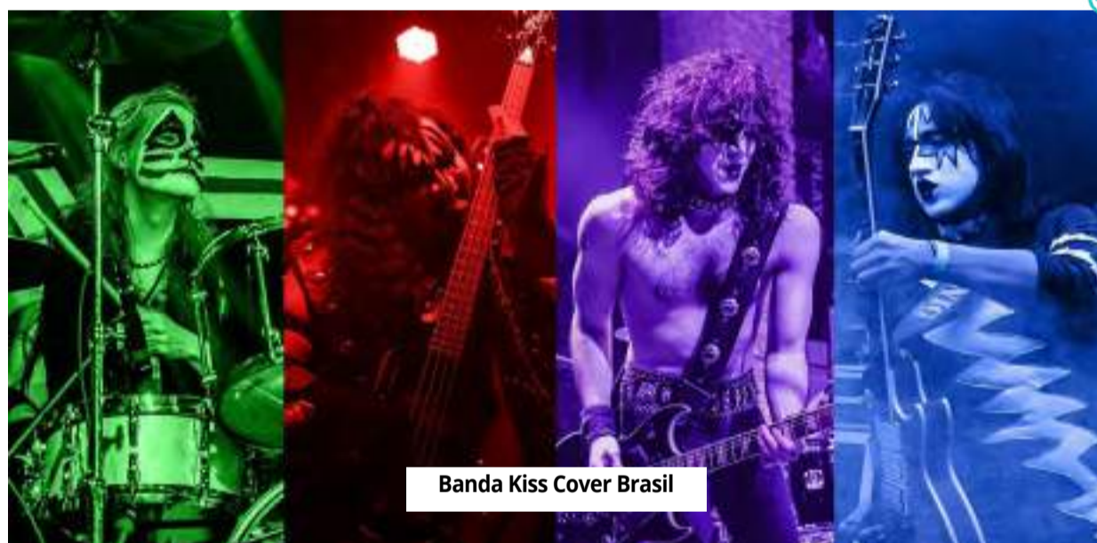
Banda Kiss Cover Brasil