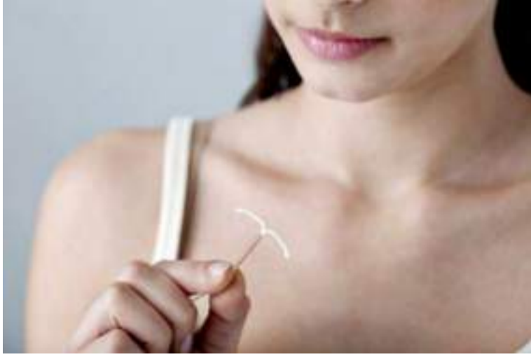
O uso do DIU é uma alternativa viável, mas com algumas ressalvas

“O DIU de progesterona, como o Mirena, é uma excelente opção para muitas mulheres com endometriose...”