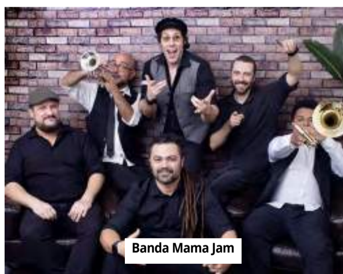
Banda Mama Jam