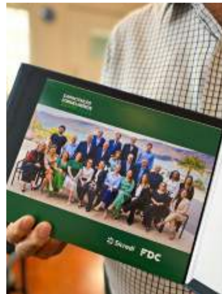
Programa de Capacitação de Conselheiros