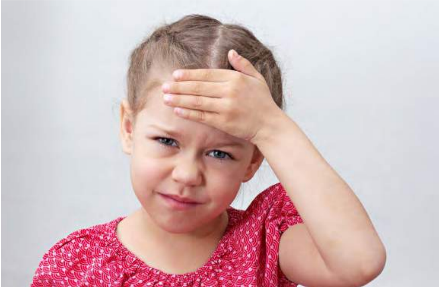
Nem todos os pacientes expostos à meningite bacteriana, como necessariamente desenvolvem a doença

“devido à gravidade do quadro clínico, os casos suspeitos de meningite bacteriana em bebês, crianças e adolescentes sempre são internados nos hospitais...”