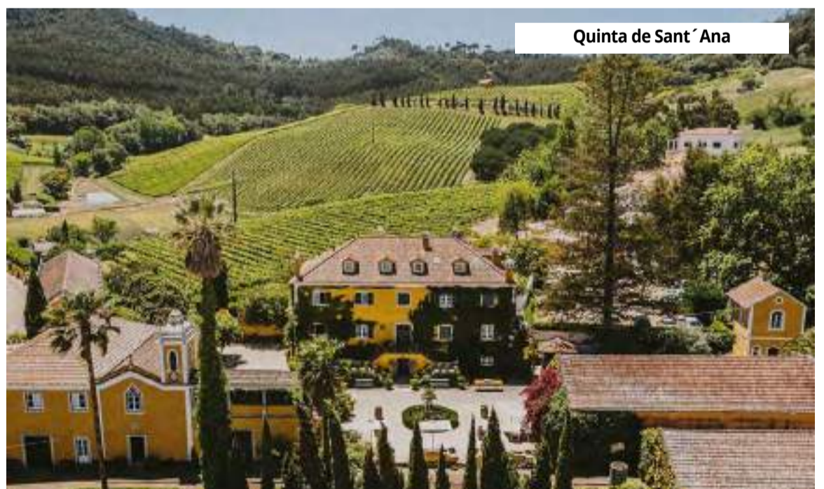
Quinta de Sant'Ana

pecial, a Quinta da Bacalhôa remete ao início do século XIV, tendo sido embelezada, ao longo dos tempos, com azulejos portugueses evocando desenhos mouriscos. Lá, é possível ver peças únicas da coleção de arte privada do Comendador Berardo, passando pelos jardins e vinhas, onde destaca-se o primeiro azulejo datado em Portugal. O museu dispõe, também, de uma sala de pro-