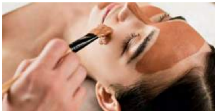
A argila vermelha é um mineral repleto de benefícios que vai muito além do que os olhos podem ver

De acordo com a esteticista, muitos produtos farmacêuticos