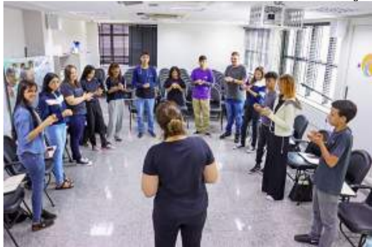
Programa Gratuito - As inscrições estão abertas para jovens de 16 a 19 anos, oferecendo uma oportunidade única de capacitação socioprofissionalizante