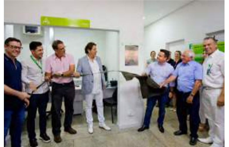
A diretoria da Unimed Piracicaba durante a inauguração do Posto Unimed Unileste