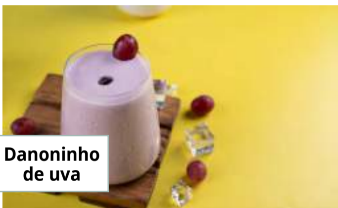
Danoninho de uva

Em uma panela, aqueça o azeite em fogo médio e doure o alho. Adicione uma cumbuca de tomates e refogue por cerca de 15 minutos ou até secar. Coloque o sal, misture, retire do fogo e deixe esfriar. Junte o requeijão light e mexa delicadamente até ficar homogêneo. Cubra com filme plástico e leve à geladeira por cerca de 30 minutos. Enquanto a pasta de tomate esfria na geladeira, higienize a alface e os tomates da segunda cumbuca. Corte as folhas de alfaces em pedacinhos do tamanho dos biscoitos de arroz. Corte também os tomates ao meio e as azeitonas pretas em pedacinhos pequenos. Em cima de cada biscoito coloque na seguinte ordem: um pouco da pasta de tomate que já esfriou, um pedaço de folha de alface, duas metades de tomate, um pedacinho da azeitona preta, e com a ponta de uma faca pincele gotinhas de requeijão em cima dos tomates e da azeitona (fazendo os olhinhos da joaninha). Deixe a criança participar do processo de montagem e comam juntos!