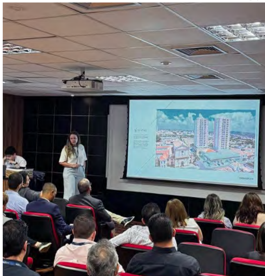
O San Vitale oferece luxo, conforto e exclusividade

Para conhecer mais sobre o San Vitale ou conversar com um especialista, clique aqui.