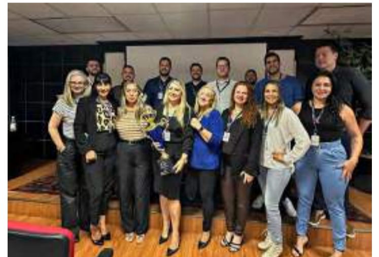
Equipe Frias Netodo Sicredi Dexis