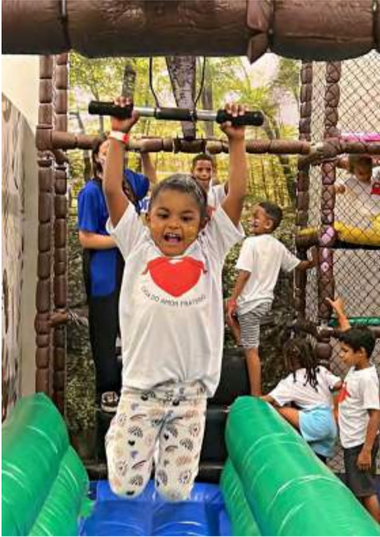
O objetivo foi proporcionar um dia de pura diversão e amor, o ambiente foi cuidadosamente preparado para elas

Ação social organizada em prol do Dia das Crianças oferece um momento especial para 30 crianças de entidades assistenciais da cidade.