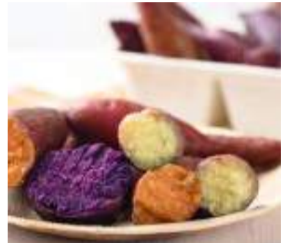
A batata-doce oferece vários benefícios à saúde

A batata-doce é um vegetal nutritivo, delicioso e muito versátil, podendo ser preparada como purê, assada, cozida, em pães e até em tortas. Rica em vitaminas A, B5, riboflavina, niacina, tiamina e carotenoides, ela é encontrada em diversos tamanhos e cores, incluindo laranja, branca e roxa. Essas joias coloridas oferecem vários benefícios à saúde.