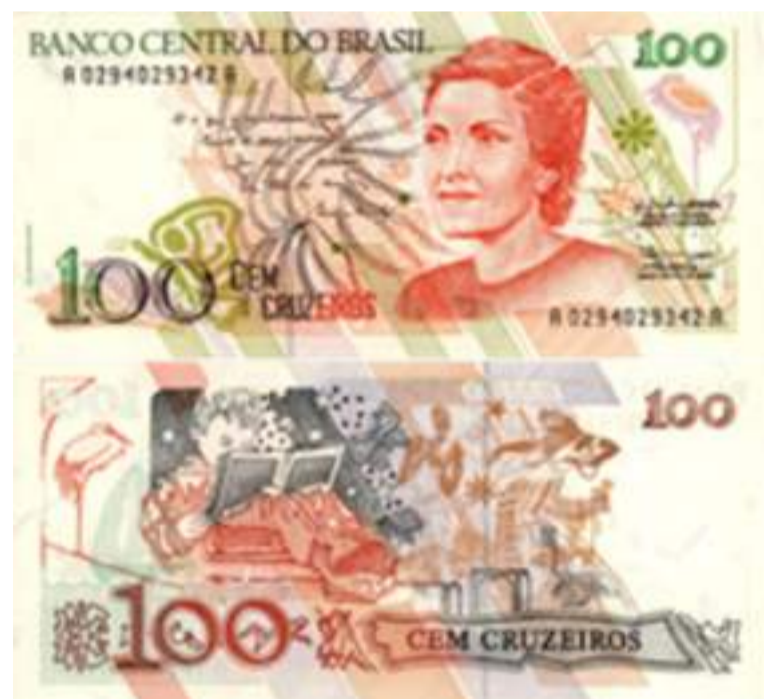
A escritora homenageada, Cecília Meireles, já foi estampada em nota de dinheiro no Brasil.