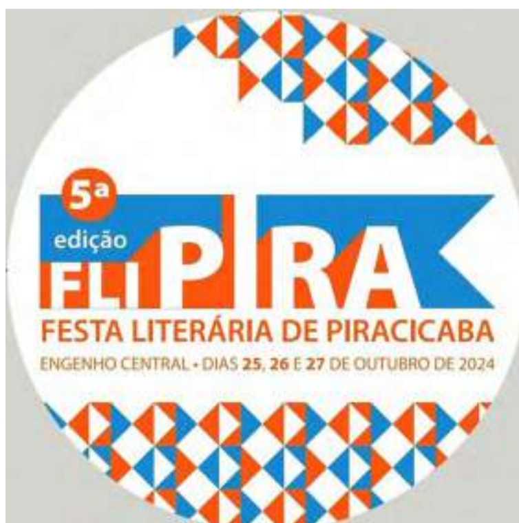
Logotipo da Festa