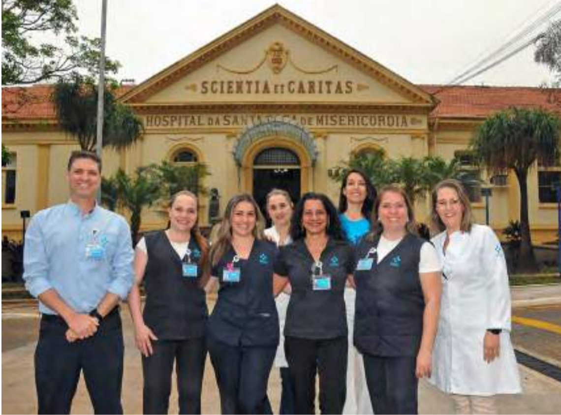
Membros da CART - Comissão de Atração e Retenção de Talentos da Santa Casa de Piracicaba

“Uma confraternização importante por trazer a família para dentro do Hospital, promovendo a integração entre funcionários e estreitando vínculos entre pais e filhos...”