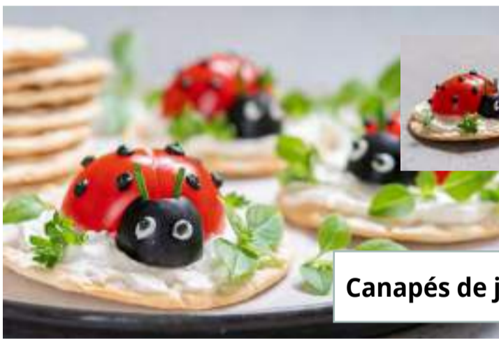
Canapés de joaninha

A nutricionista ensina 4 receitas nutritivas e fáceis de fazer para serem preparadas em família e que vão agradar às crianças.