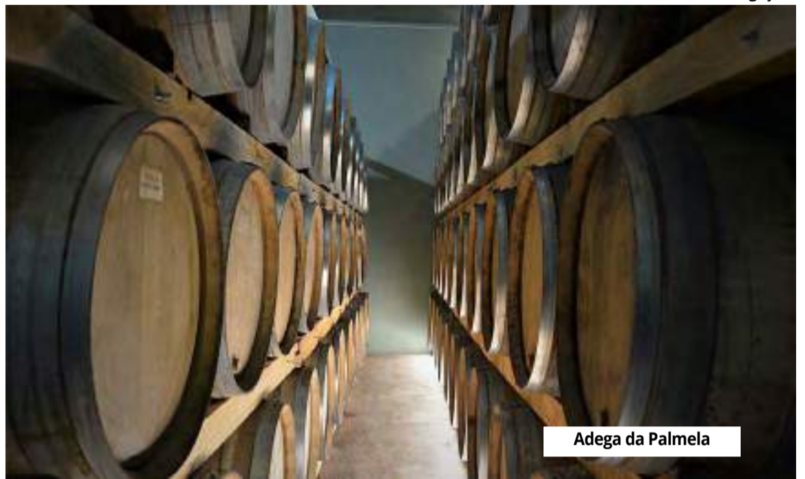
Adega da Palmela