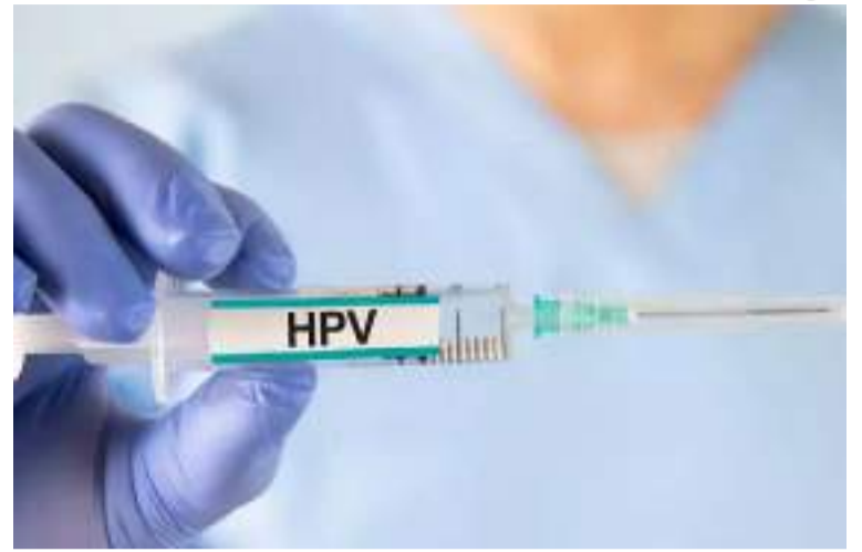
A vacina HPV é recomendada também para pessoa que já foram infectadas pelo HPV