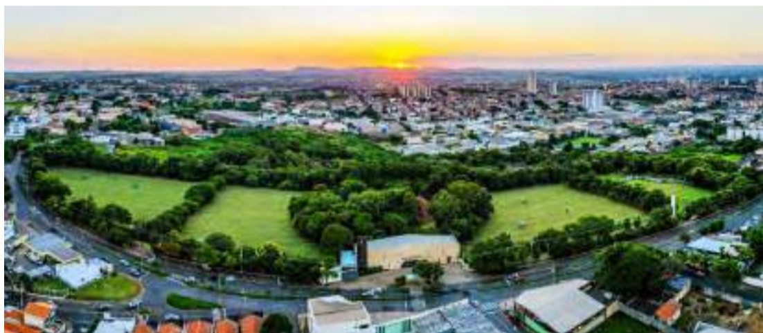
As áreas verdes e os espaços cuidadosamente planejados proporcionam um ambiente de tranquilidade

Que o Setembro Amarelo seja um convite para refletirmos sobre a vida e a importância de prestar atenção ao próximo. Todos nós, em algum momento, precisamos de apoio. Não hesite em buscar ou oferecer ajuda — você não está sozinho.