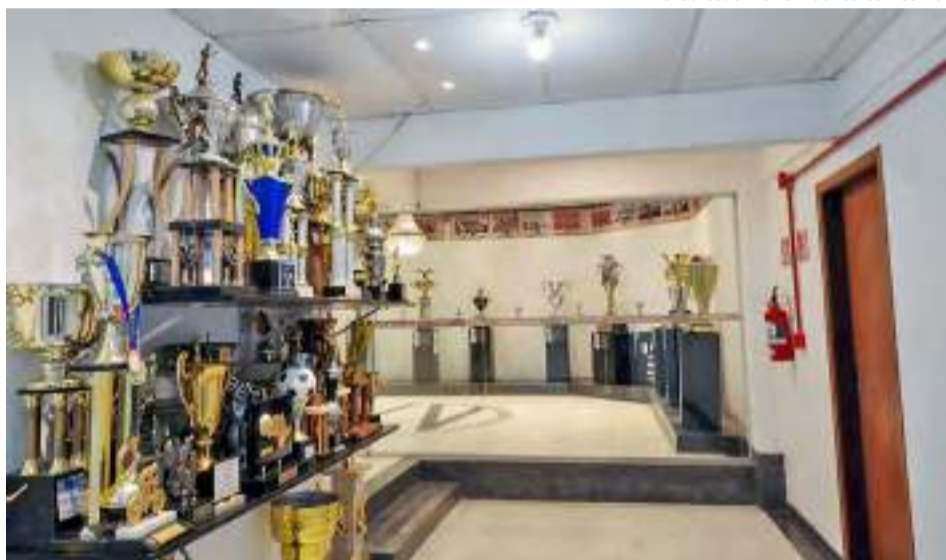
Realizado pela PEU, com incentivo do Pecege, a sala e antessala de Troféus do Estádio Barão de Serra Negra, recebeu iluminação para destacar as conquistas do Time Alvinegro

empresários da cidade a restaurar ambientes do Barão de Serra Negra e deixar sua marca neste símbolo da cidade”