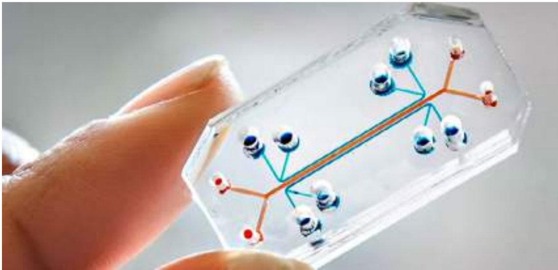
A principal medida de controle é a prevenção

“Assim, esses dispositivos oferecem uma plataforma mais ética e, muitas vezes, mais relevante para o estudo de doenças humanas e a avaliação de novos tratamentos.”