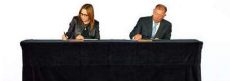
Mary Barra, presidente e CEO da GM; e Euisun Chung, Executive Chair do Hyundai Motor Group

A General Motors (NYSE: GM) e a Hyundai Motor Company (KRX: 005380 KS) assinaram acordo para explorar futuras colaborações em áreas estratégicas essenciais.