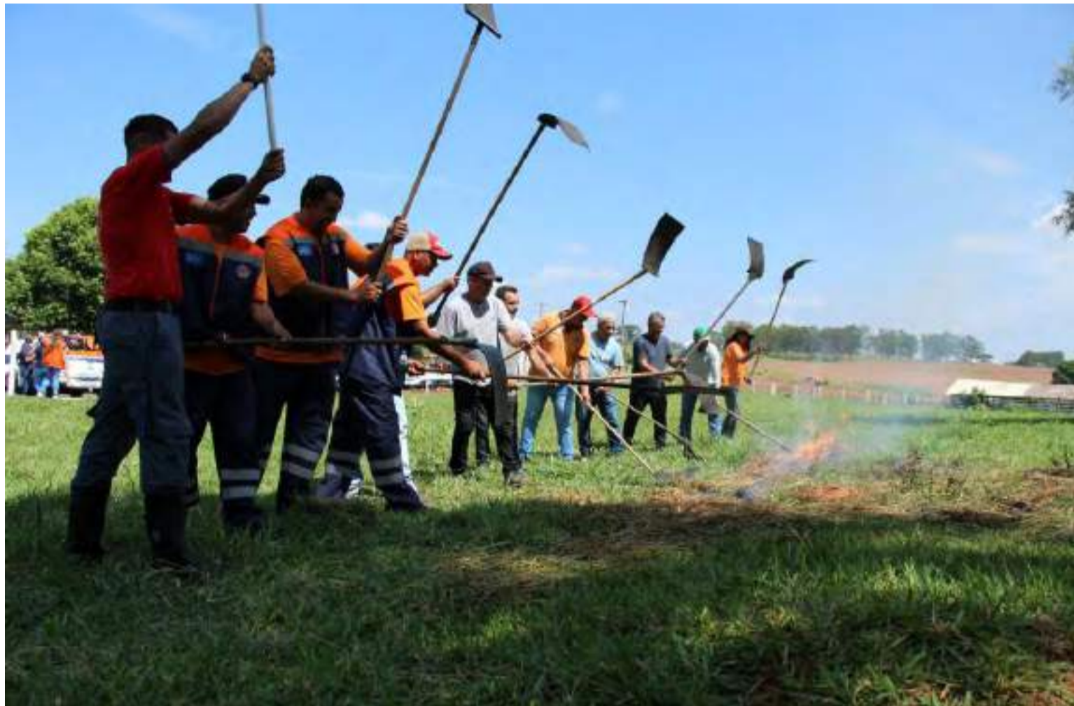
Produtores rurais foram convidados a participar dos treinamentos de combate a incêndios.

Em parceria com a Companhia de Desenvolvimento Habitacional e Urbano do Estado de São Paulo (CDHU), a Secretaria de Agricultura e Abasteci-