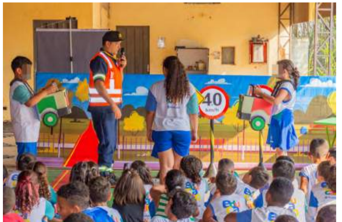
As crianças atuaram na simulação de uma cidade em funcionamento

multinacional líder em seu segmento. De origem sul-coreana, a GLOVIS BRASIL LOGÍSTICA é especializada em soluções logísticas como transporte nacional e internacional, por via rodoviária, marítima e aérea, e de serviços voltados a fábricas e concessionárias. Conta também com serviços de logística interna ao site do cliente, cobrindo a distribuição de peças à retirada na saída da linha e mesmo ao pré-embarque, incluindo soluções completas que envolvem terminais e gestão de contêineres, controle de inventário e armazenagem em geral, exportação e importação para qualquer segmento de negócios. Através de serviços diferenciados e com valor agregado, persegue o crescimento sustentável maximizando a eficiência na cadeia de valor dos clientes. Em todo o