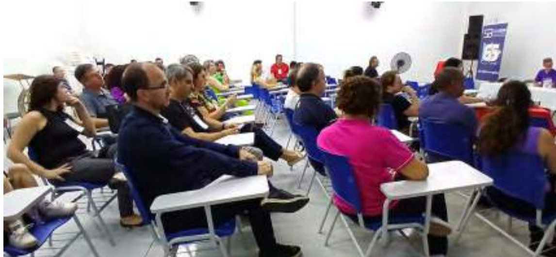
Assembleia no SindBan com funcionários do BB para aprovar acordo coletivo de trabalho