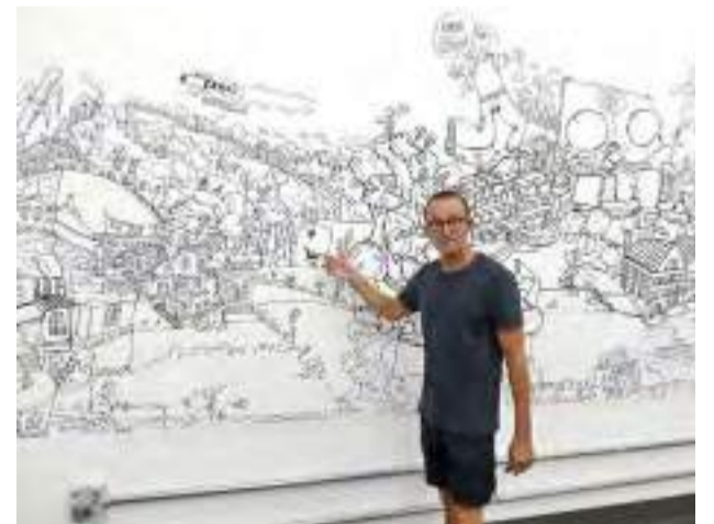
Auditório do Estádio Barão de Serra, revitalizado com apoio do Pecege - Designer Erasmo Spadotto

“O apoio para a reformulação do espaço do XV de Piracicaba é mais uma prova da intenção do Pecege em fazer parte da comunidade alvinegra. É uma pequena homenagem que fizemos, ficou muito bonita a obra de arte. Eu fiquei imortalizado no painel do XV como o Pata Negra”