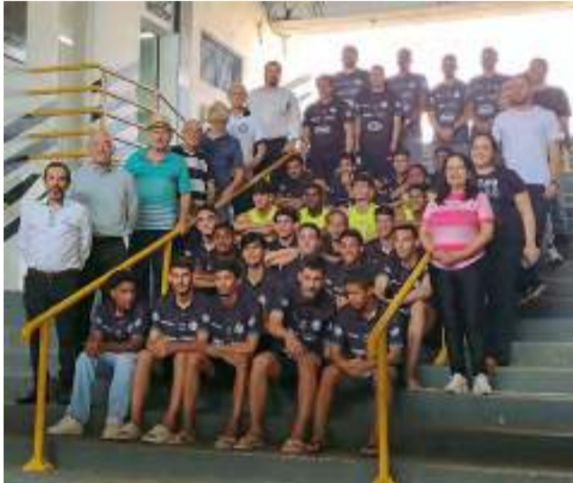
Atletas da categoria de base são meninos que sonham em ser jogadores de futebol