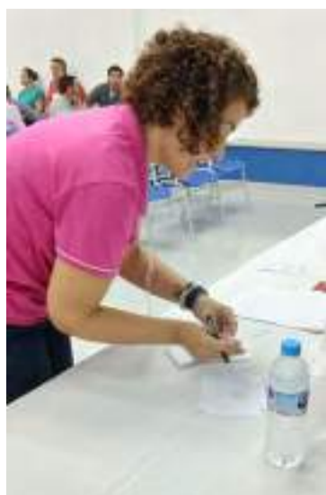
Funcionária do BB validou cédulas de votação