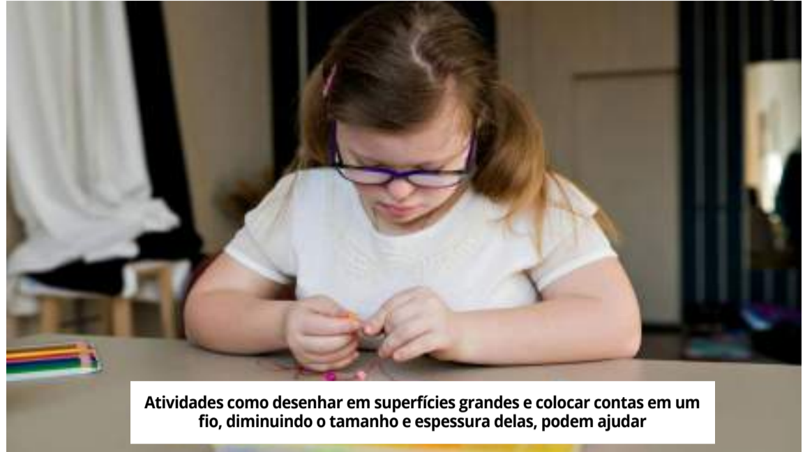
Atividades como desenhar em superfícies grandes e colocar contas em um fio, diminuindo o tamanho e espessura delas, podem ajudar

O estudo aponta que as crianças em idade escolar costumam apresentar comportamentos disruptivos, impulsivos, hiperativos,