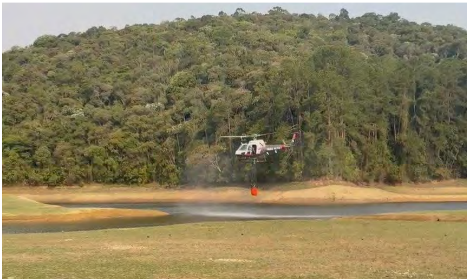
Helicóptero da PM também auxilia no combate ao fogo.

mento passará a enquadrar as propriedades rurais atingidas pelos incêndios nos programas habitacionais paulistas, com o objetivo de recuperar as moradias atingidas pela tragédia.