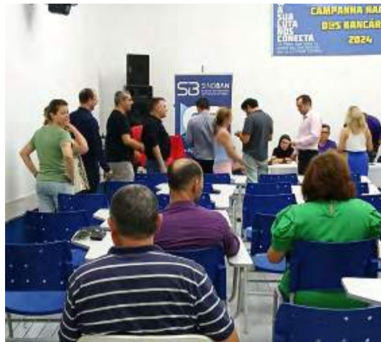
Funcionários do BB aprovaram o acordo coletivo de trabalho e rejeitaram greve em Piracicaba

Na última segunda-feira (9), o Sindicato dos Bancários de Piracicaba e Região (SindBan), realizou assembleia para deliberar sobre a aprovação ou rejeição da proposta da Convenção Coletiva de Trabalho (CCT) e do Acordo Coletivo Aditivo (ACT) do Banco do Brasil, os acordos foram aprovados por 55,8% dos bancários presentes. A decisão aconteceu por meio de voto secreto, os bancários votaram sobre uma possível greve, rejeitada por 58,1% dos bancários presentes.