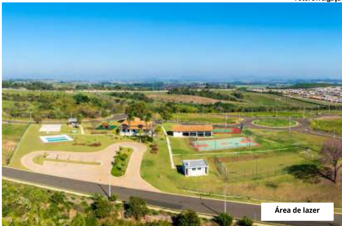
Área de lazer