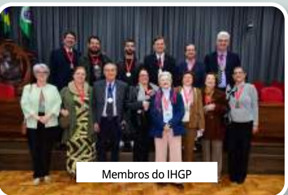
Membros do IHGP