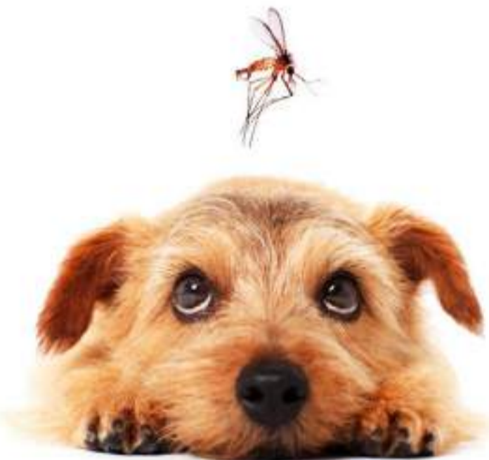
A doença afeta cães, gatos, roedores e até os seres humanos.

Devido ao alto custo do tratamento, muitos animais com positivo para leishmaniose são eutanasiados ou simplesmente abandonados por suas famílias. Dados da OMS revelam que, até