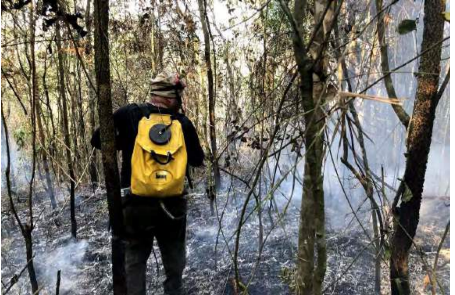
Brigadista auxilia no combate ao fogo.

Além de investir em veículos e equipamentos, o Estado ainda liberou R$ 5,9 milhões para a contratação de serviços de