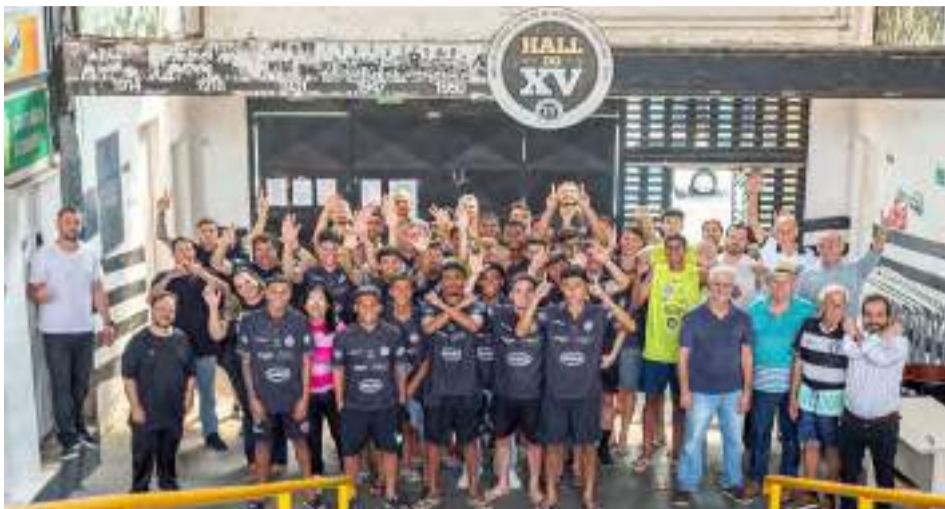
AAXV continua contribuindo para impulsionar vitórias do Alvinegro Piracicabano