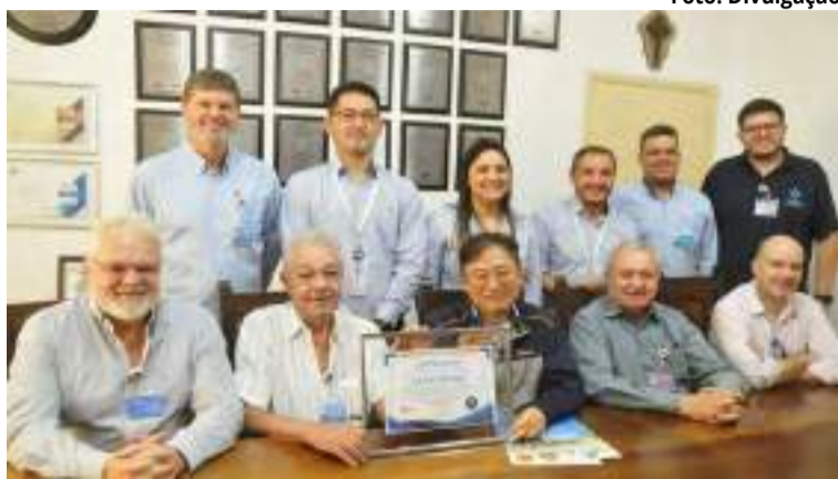
Representantes da empresa sul-coreana, CJ do Brasil, em visita à Instituição

“Precisamos deste aporte financeiro para que a assistência direcionada ao SUS seja de fato, cada vez mais resolutiva e de maior qualidade”