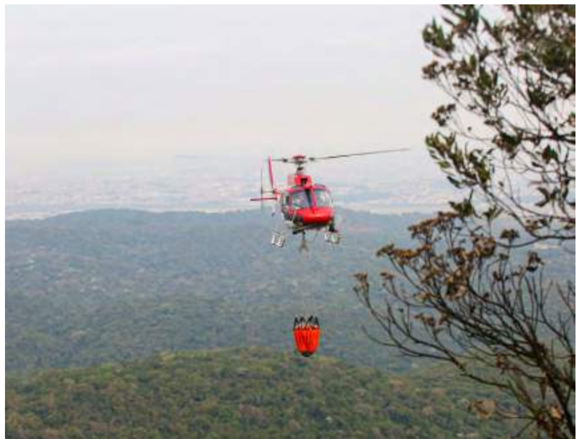
Helicópteros auxiliam no combate ao fogo.

Além disso, a Secretaria de Meio Ambiente, Infraestrutura e Logística (Semil) ampliou o efetivo de brigadistas para atuar nas unidades, com 15 novas equipes que se somam às 19 que já existiam. Com isso, o número de agentes nos parques subiu de 57 para 102 pessoas, um aumento de quase 80%.