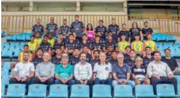
Associação Amigos do XV - unindo forças para o desenvolvimento dos atletas da base