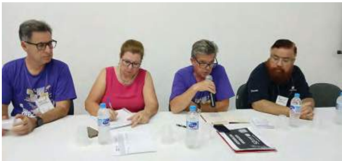
Diretores do Sindban conduziram a assembleia na segunda-feira, dia 09