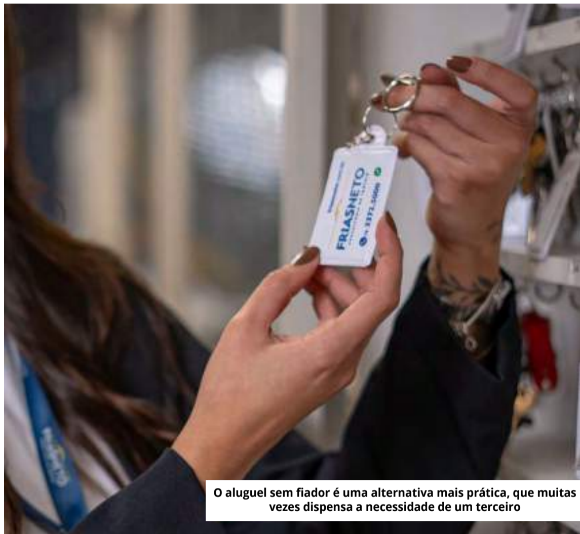
O aluguel sem fiador é uma alternativa mais prática, que muitas vezes dispensa a necessidade de um terceiro

práticas e ágeis com exclusividade, a Frias Neto também disponibilizou um e-book de garantias locatícias, que pode ser baixado gratuitamente, clicando aqui.