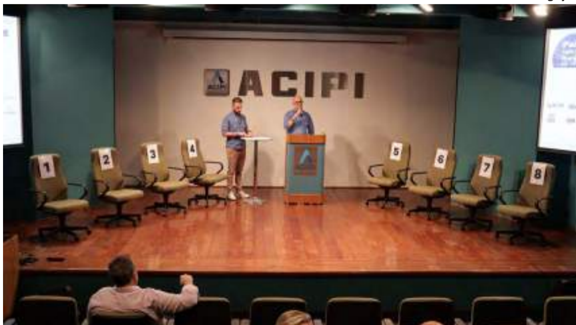
O painel terá transmissão ao vivo pelo canal da Acipi no YouTube e pela rádio Jovem Pan News FM, 99,5 Mhz

O acesso ao auditório será exclusivo para representantes das entidades parceiras e equipes dos candidatos. As regras e a mecânica dos blocos foram detalhadas em reunião no último dia 11, quando todos os candidatos assinaram o termo de aceite e confir-