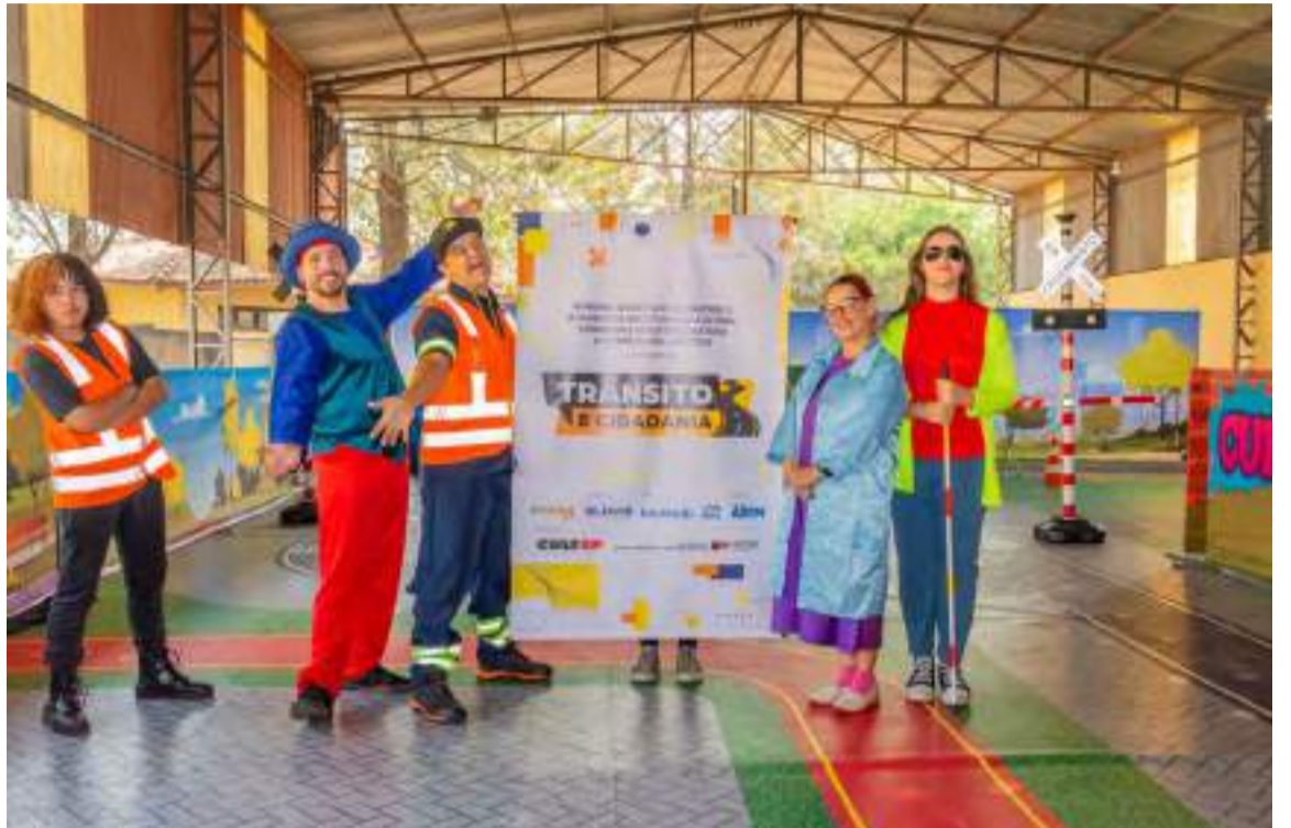
O projeto “Trânsito e Cidadania” contemplou apresentações teatrais, com intervenções cênicas

Sobre a Glovis Brasil Logística: A GLOVIS é um operador logístico