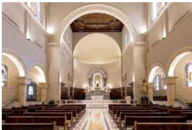
Parte interna da Catedral após reforma em 2023 Foto: Leo Rait @leorait / LARGO Arquitetura @largo.arquitetura