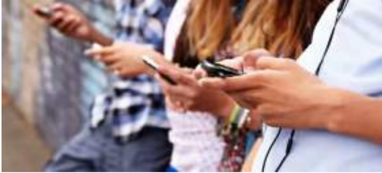
A faixa etária que mais usa as mídias sociais online e plataformas de entretenimento são jovens com idade variando entre 16 e 24 anos

“Não podemos nos esquivar do mundo digital porque ele influencia diretamente o que acontece no offline. A revolução digital veio para ficar e, por isso, é preciso aprender como lidar com ela...”