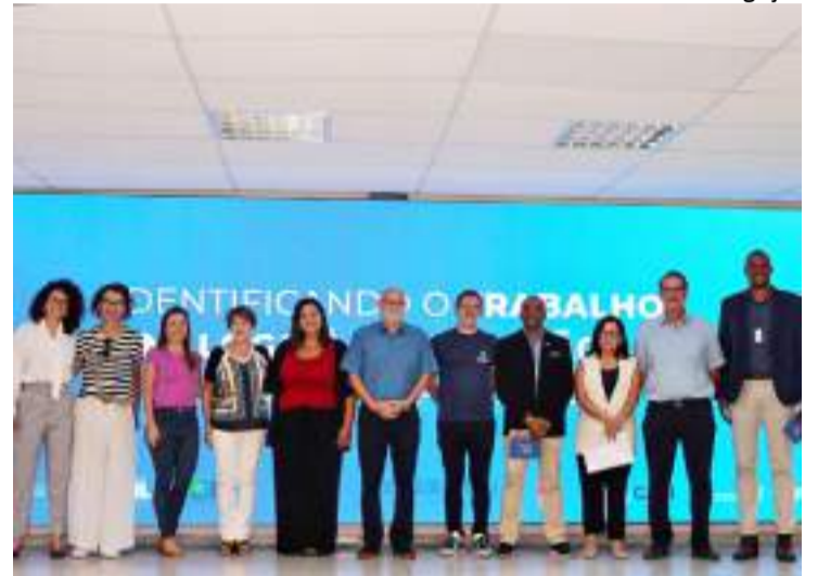
Comitê Municipal de Atenção e Promoção aos Direitos Humanos de Imigrantes, Refugiados e Apátridas

O Comitê Municipal de Atenção e Promoção aos Direitos Humanos de Imigrantes, Refugiados e Apátridas (Migra-Pira), iniciou neste mês, as suas atividades e uma das primeiras articulações refere-se a um espaço para imigrantes na 4ª Feira de Empregabilidade, com intérprete e atendimento direcionado para o recebimento de currículos, cadastro e orientações da Polícia Federal, Receita Federal e Conare (Comitê Nacional para os Refugiados).