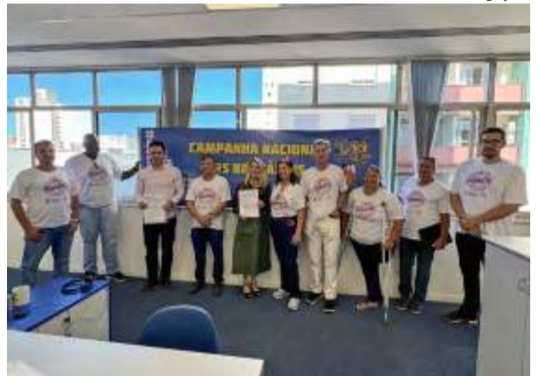
SindBan fez entrega de exemplar da minuta de negociação salarial dos bancos

DEMOCRACIA - Durante os encontros os bancários foram capazes de construir uma proposta unificada muito abrangente, pautada