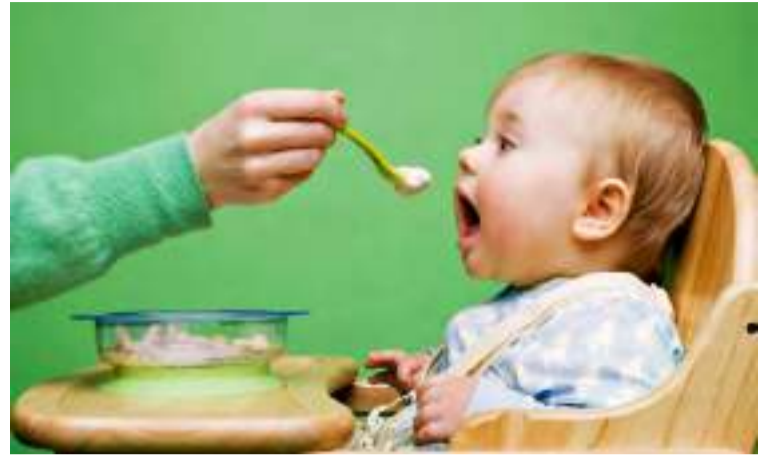
As crianças, especialmente os bebês, estão entre os grupos mais vulneráveis a sofrer com o problema

Alguns indivíduos podem levar a dificuldade de ingerir comprimidos ao longo da vida. Por isso, durante a consulta médica o paciente pode pedir orientações ao médico de como superar essa dificuldade, em alguns