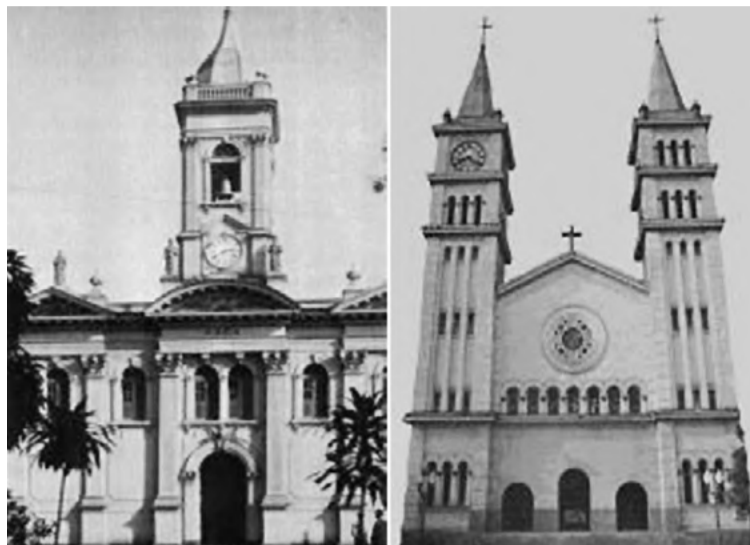
Antiga Paróquia e a Catedral quando recém-construída

Por iniciativa do primeiro bispo diocesano, Dom Ernesto de Paula, o templo atual foi construído para