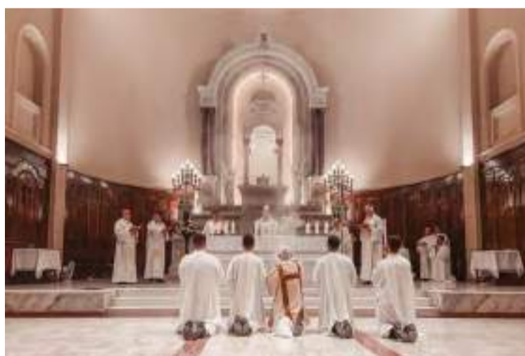
Missa pelo 62º aniversário de Dedicção da Catedral, na última segunda-feira, dia 17