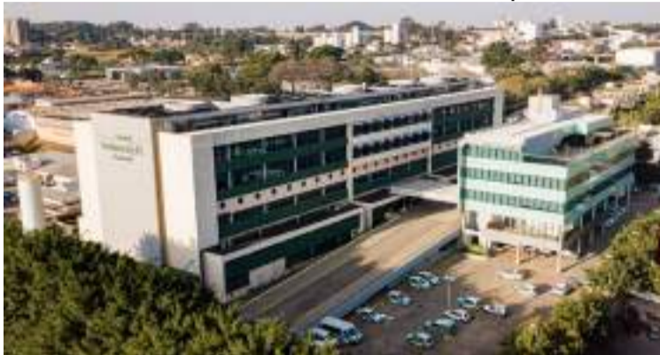
Hospital Unimed Piracicaba e Centro Administrativo da Cooperativa

“O HU é uma unidade hospitalar de grande porte, pujante, um organismo vivo, que cresce dia a dia graças ao empenho e dedicação de médicos e colaboradores...”