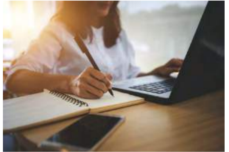
A experiência também contará com um sistema de liberação de conteúdo à medida em que os profissionais vão resolvendo casos clínicos