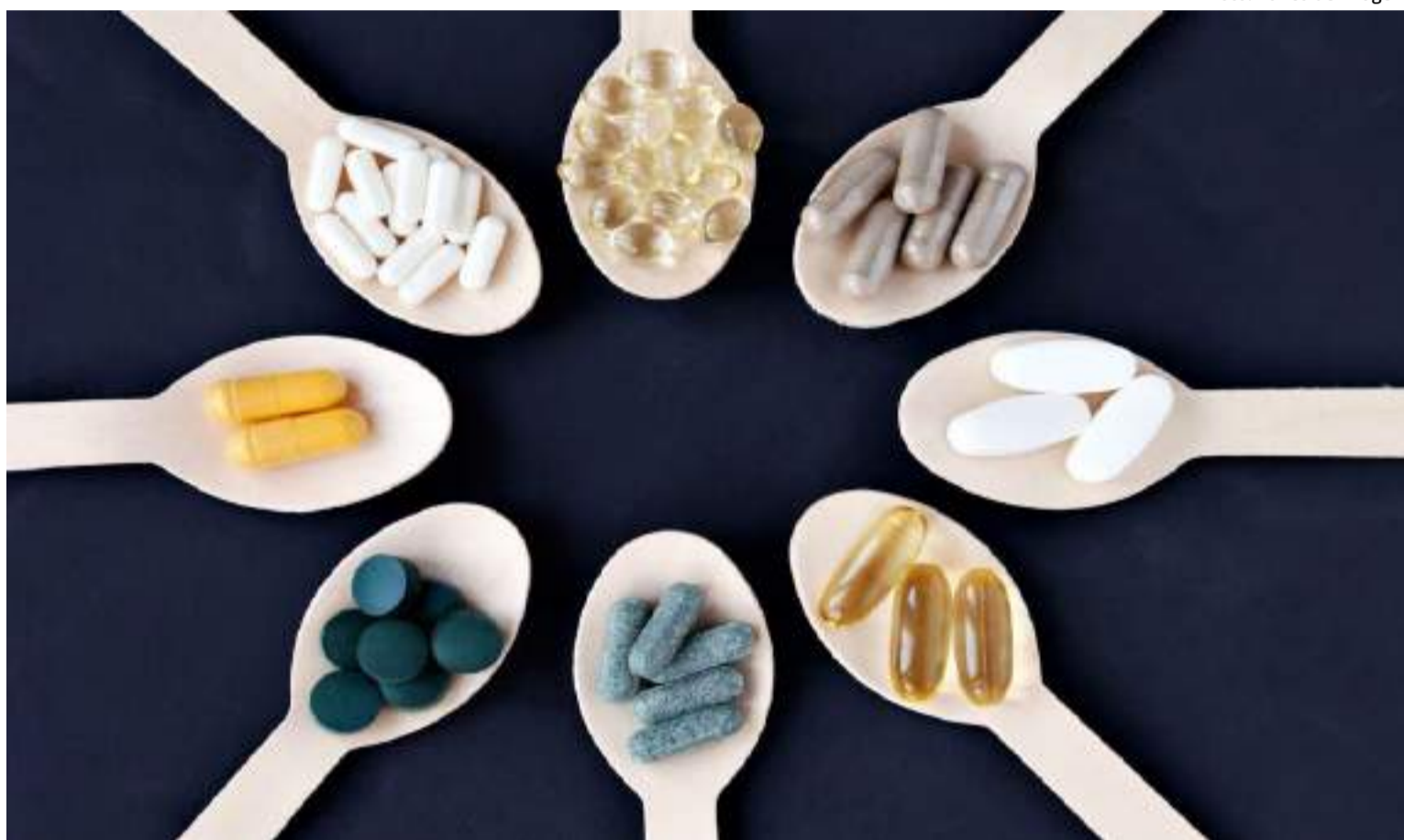
Alguns suplementos podem ser aliados poderosos na melhoria da saúde e do bem-estar

“Esses suplementos oferecem benefícios variados que vão desde a melhoria da saúde cardiovascular e cognitiva até o aumento da performance física e o equilíbrio da flora intestinal”