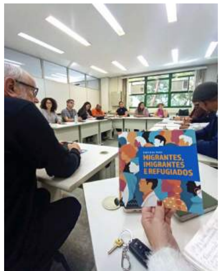
Comitê Migra-Pira Realiza primeira reunião

Para participar, os interessados devem levar seus currículos nos galpões 09 e 10 do Engenho Central, localizado na avenida Doutor Maurice Allain, 454, Vila Rezende, nos dias e horários do evento.