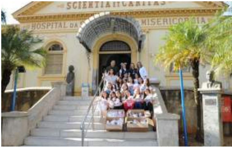
Os gorros e cachecóis foram destinados a pacientes das unidades SUS (Sistema Único de Saúde) da Santa Casa de Piracicaba

“É muito bom saber que cada aluno deste projeto se torna um multiplicador para uma sociedade mais humanizada”