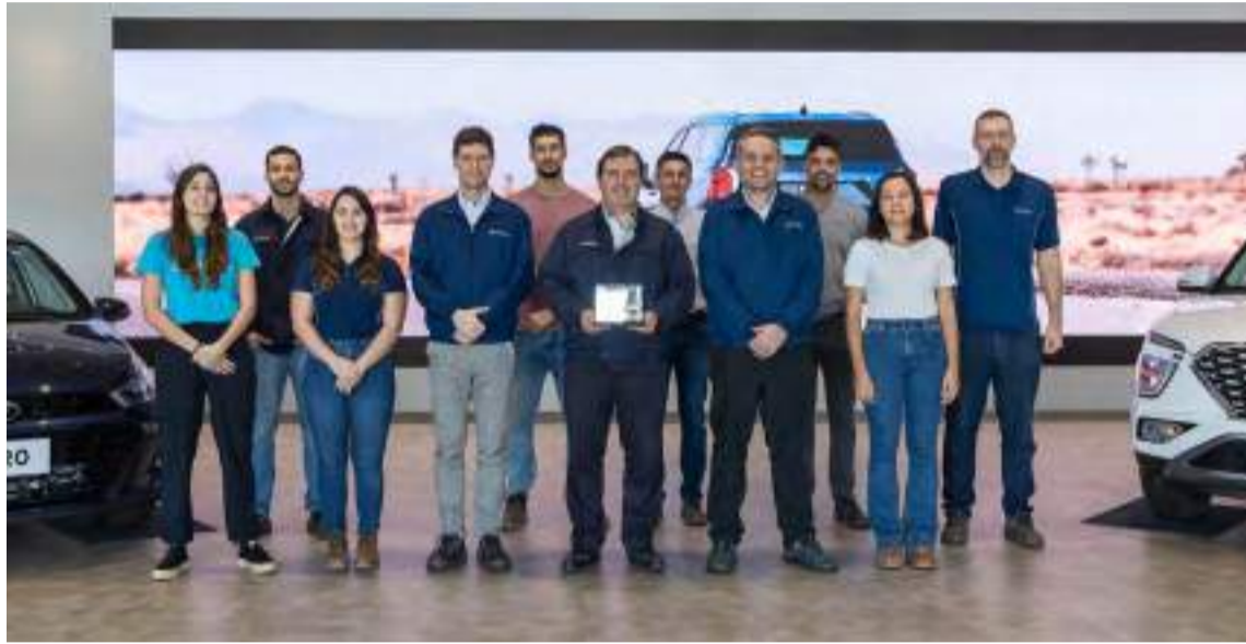
Hyundai conquista o Prêmio Immensità de Consciência Ambiental

“A Hyundai tem entre suas missões promover a mudança na relação da indústria com o meio ambiente, em linha com a visão global da marca de ‘Progresso para a Humanidade’”