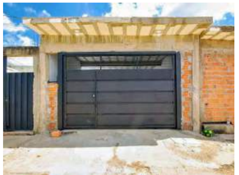
5ª casa doada, em 2024

além de um jardim vertical, além da reutilização da água da chuva para irrigação dos espaços verdes bem como descargas na imobiliária. Já na parte social, além da Mucapp, a imobiliária também já apoiou os times de basquete e futebol do XV de Piracicaba, equipe Green Piracicaba de Ciclismo, o Festival Internacional de Música Erudita de Piracicaba (Feimep), Salão Internacional de Humor de Piracicaba e o Grupo Falando da Vida.