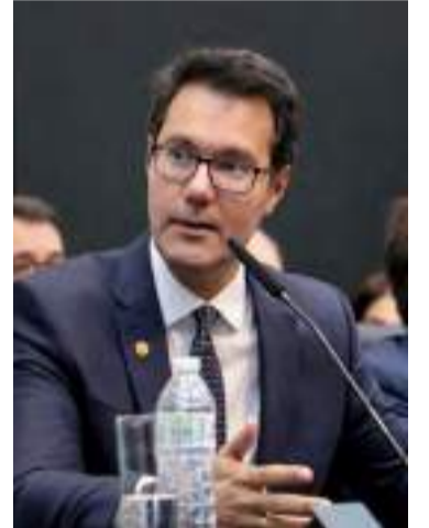
Deputado Alex Madureira

“O PL 109/2021 tem o objetivo de dar suporte a essas corporações para que possam investir na ampliação e melhoria de sua produção”