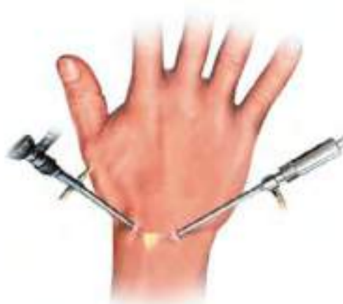
Cirurgia artroscópica de Cisto Sinovial

Nos casos em que o cisto é grande ou incomoda devido ao local, pode ser indicado o tratamento cirúrgico para remoção do cisto.