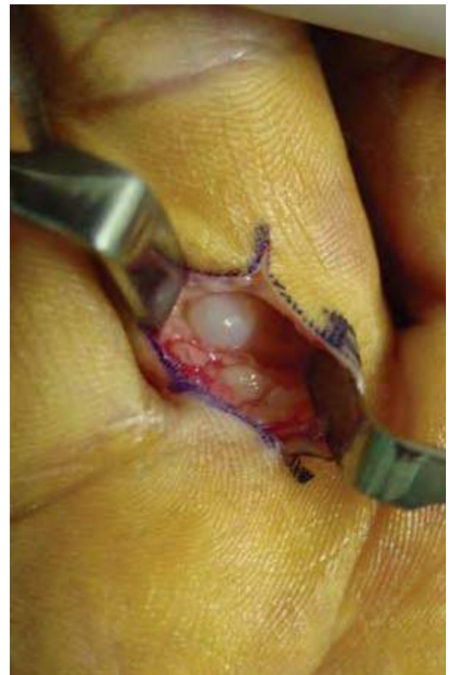
Cirurgia de Cisto Sinovial