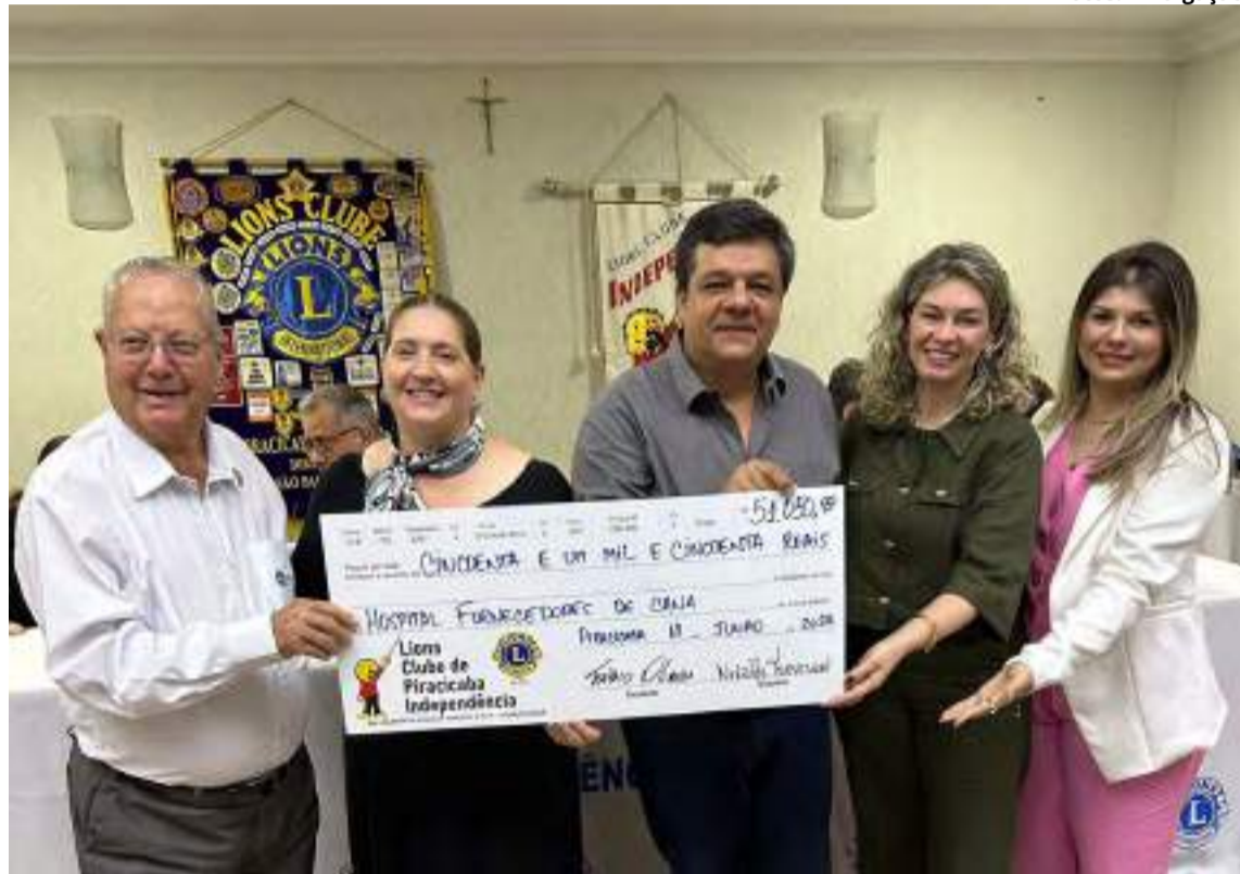
A entrega simbólica cheque do Lions Clube de Piracicaba a equipe do HFC

“O valor arrecadado com os convites da Barraca Alemã na Festa das Nações será investido na melhoria contínua do hospital, garantindo um atendimento de excelência para a população. O HFC Saúde precisa constantemente de recursos para aprimorar sua infraestrutura física e tecnológica, bem como para capacitar sua equipe de profissionais”