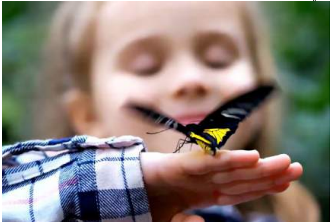
Em 2023, o projeto acolheu 140 pessoas de 23 estados brasileiros, incluindo o DF

“Todo o mês, cada acolhido recebe uma caixa com medicamentos, curativos e suplementos que são de uso essencial para cada um e assim garantir menos dor e mais conforto diante da doença. A equipe do