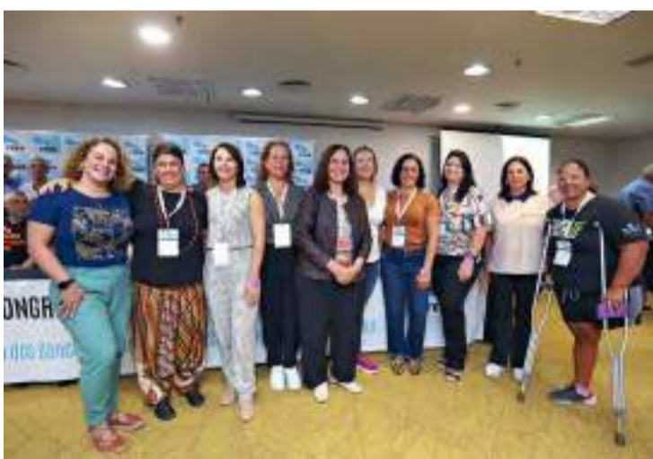
Mulheres eleitas na chapa da federação dos bancários de São Paulo e Mato Grosso do Sul