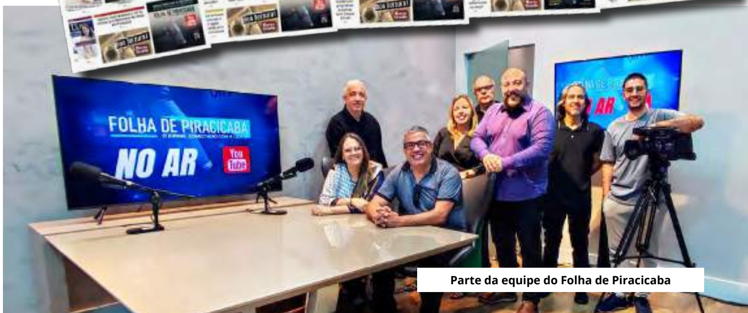
Parte da equipe do Folha de Piracicaba

“Em um mercado tão competitivo, o prêmio consagra os 6 anos de um trabalho realizado com muita dedicação, respeito aos leitores, aos princípios éticos e a uma linha editorial totalmente diferenciada junto ao jornal Folha de Piracicaba, colocando o leitor sempre a par das pautas mais importantes. Sinto um imenso orgulho e muito honrado por esse reconhecimento”