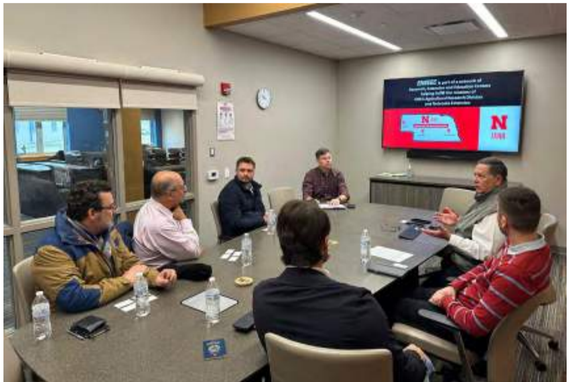
Durante a visita técnica, foi discutido o atual cenário da agricultura irrigada de precisão e os desafios dos recursos hídricos no Estado.

“Estamos alinhando os detalhes para uma parceria técnica com foco nas mais novas tecnologias de irrigação. A assinatura de um protocolo de intenções deve ocorrer na Agrishow, no próximo mês”