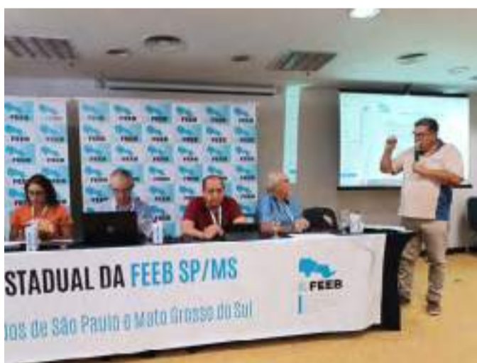
Paiva faz uma síntese sobre o Perfil Bancário 2024 em Congresso em São Paulo