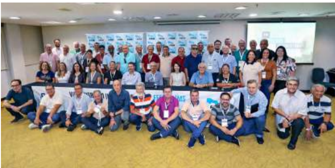
Bancários encerram congresso com participação de 23 sindicatos em São Paulo