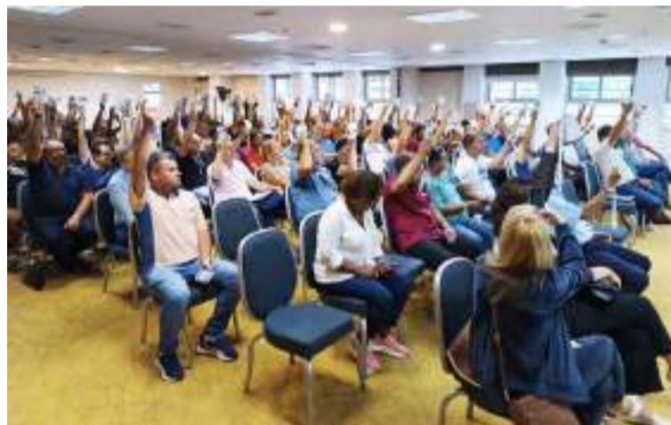
Pela primeira vez na história em 65 anos do SindBan, instituição elege 5 diretores para compor a diretoria da Federação

“extremamente produtivo, conseguimos eleger cinco diretores, duas mulheres e a nossa representatividade aumenta a cada ano, é bom saber que estamos equacionando demandas e atingindo os objetivos que nos cabem”