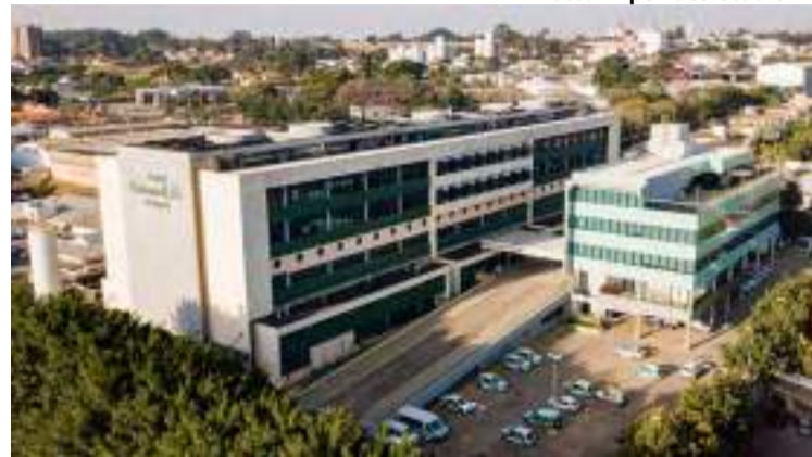
Hospital Unimed Piracicaba e Centro Administrativo da Cooperativa