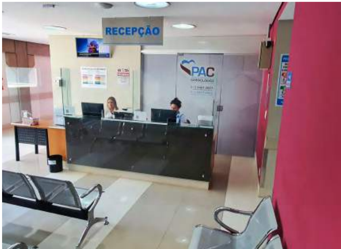
PAC, que funciona em prédio anexo à Santa Casa

O PAC - Pronto Atendimento Cardiológico da Santa Casa de Piracicaba comemorou, no último dia 15 de março, dois anos de operação. Desta forma, a assistência cardiológica que o Santa Casa Saúde Piracicaba direciona há 27 anos a seus beneficiários ganhou ainda mais excelência no serviço desde a remodelação das consultas cardiológicas de forma eletiva a seus conveniados no PAC, que funciona em prédio anexo à Santa Casa, com entrada pela rua Silva Jardim, 1786.