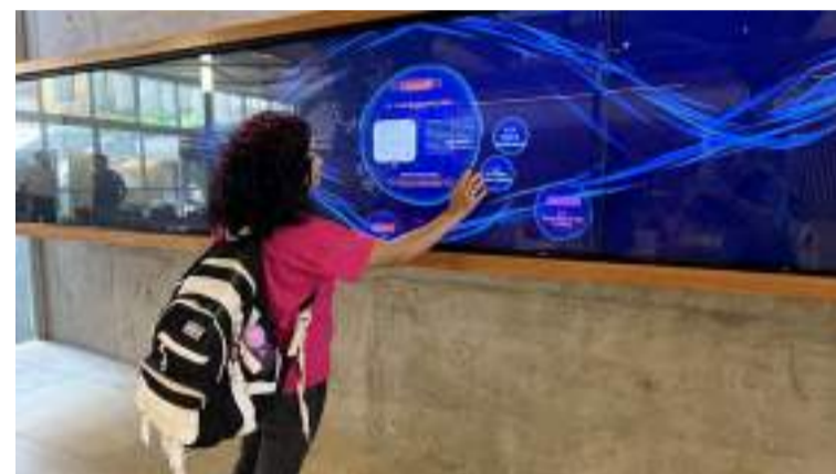
A experiência digital representa uma evolução do Memorial do Empreendedorismo já existente

com o desenvolvimento e a preservação da memória empresarial de Piracicaba. Ao ocupar um espaço físico de destaque em nosso novo prédio, representa um portal para a descoberta de uma história muito rica dos empreendedores que nos permitiram estar aqui hoje. Tudo isso apresentado de forma moderna e interativa. É uma homenagem aos antepassados e uma inspiração às gerações futuras”, disse o presidente.