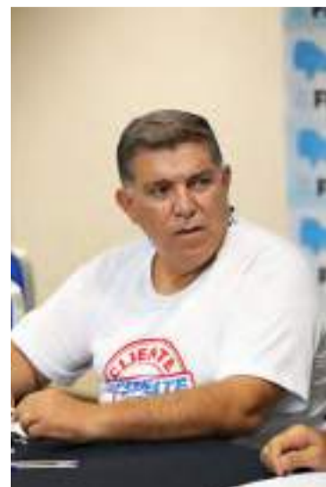
Paiva, do SindBan