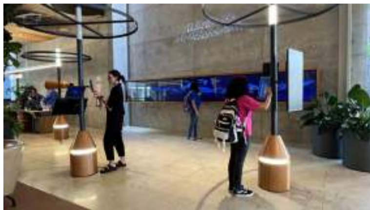
Em modernos painéis de LED é possível acompanhar, de forma interativa e acessível, os principais eventos do crescimento econômico de Piracicaba