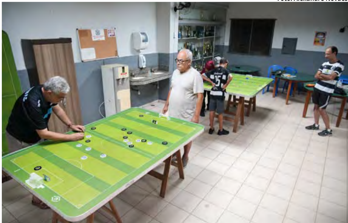
O Futebol de Mesa é para todas as idades e gêneros

A prática do Futebol de Mesa ou Futebol de Botão começou a ser oferecida também no Clube Recreativo dos Metalúrgicos.