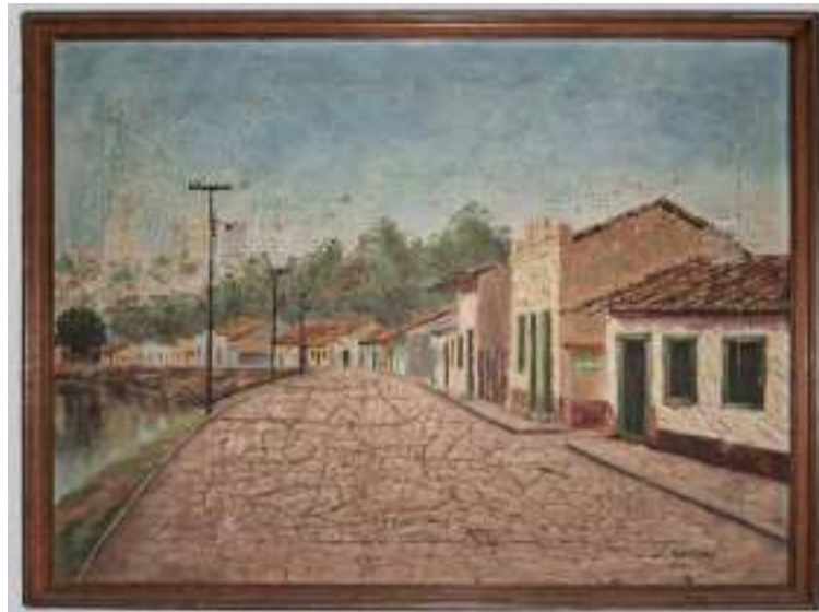
Rua do Porto antiga, quadro de Aarão dos Santos

mente os tradicionais peixes da terra aos nossos visitantes. Peixes que não são pescados mais no rio famoso, mas que vem do Amazonas, do Mato Grosso, do Chile, através dos revendedores de Piracicaba e de Limeira, sempre especializados na comercialização de