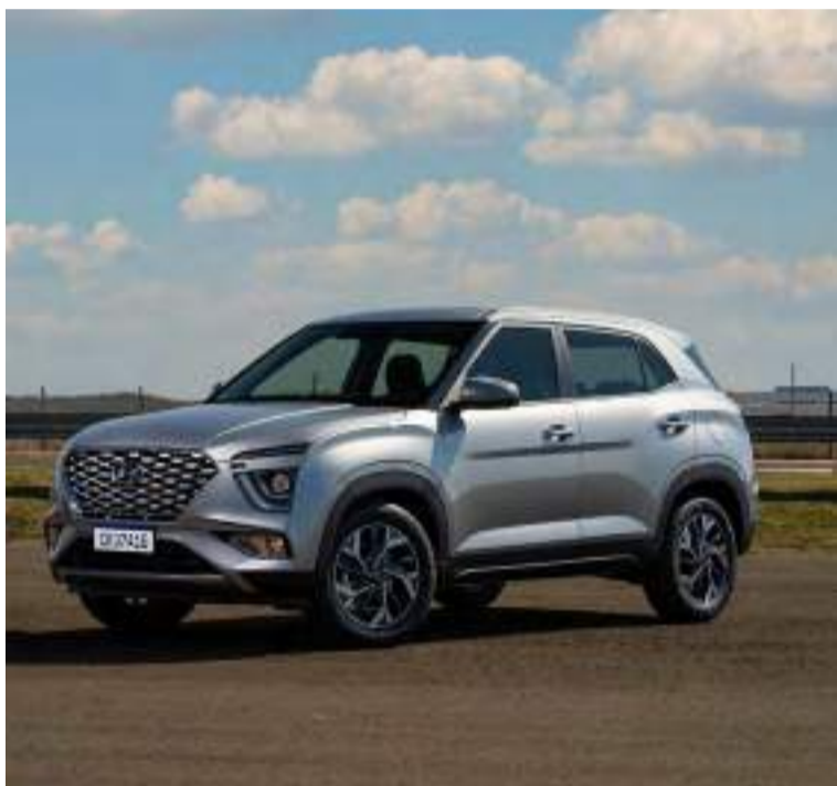
Hyundai oferece R$ 10 mil de desconto

A Hyundai Motor Brasil anuncia condições especiais para os modelos HB20 e CRETA durante todo o mês de março. Com destaque para o desconto de R$ 10 mil no CRETA Limited Safety, a promoção também prevê R$ 9 mil reais de valorização no usado oferecido pelos clientes interessados nas versões Comfort Plus, Platinum Safety e N Line do SUV produzido em Piracicaba. Versões do hatch Hyundai HB20 e do sedã Hyundai HB20S também contarão com oportunidades exclusivas.