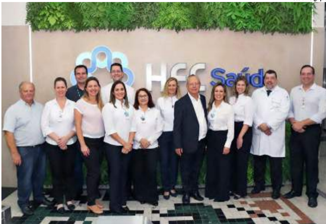
Equipe do HFC

Não tem como falar do HFC Saúde sem falar dos parceiros que tanto fazem pelo hospital. Parceiros, empresas, institui-