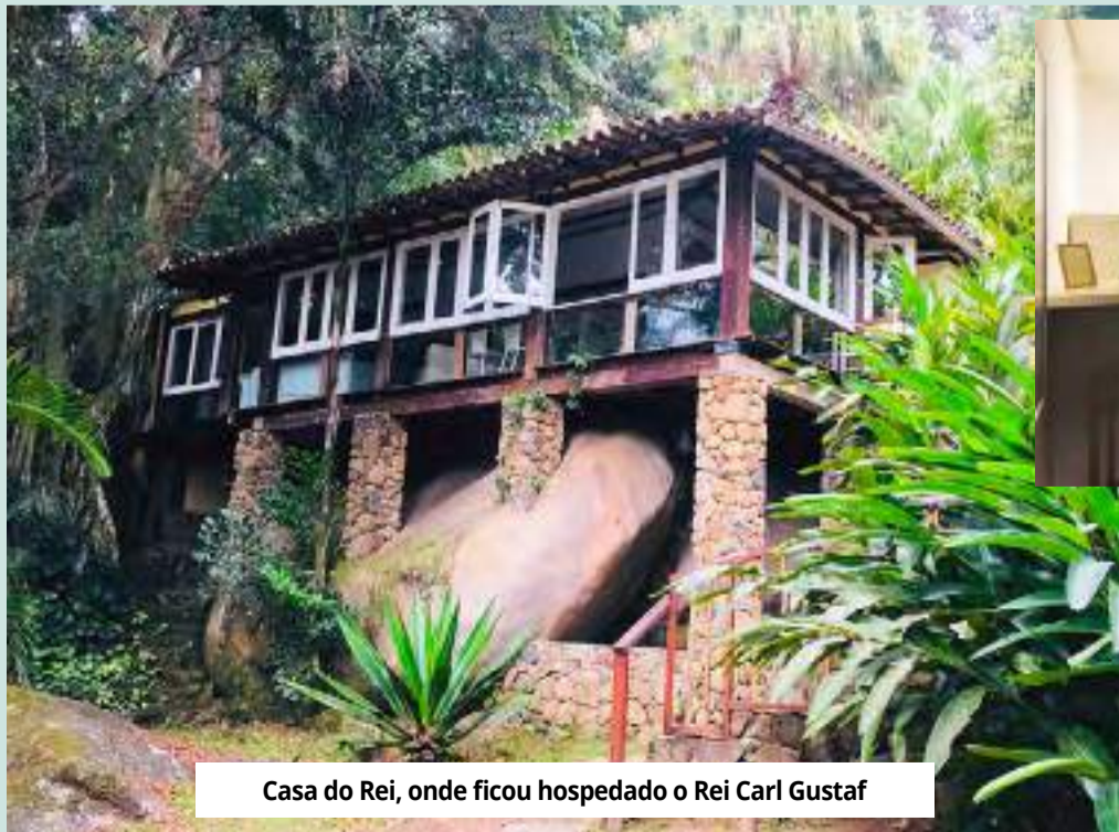
Casa do Rei, onde ficou hospedado o Rei Carl Gustaf

O chão, o teto e os batentes das janelas, todos feitos em madeira, conferem uma certa rusticidade ao ambiente, aliados ao leve toque de luxo, presente na decoração e na qualidade dos objetos. As janelas dos quartos, inclusive, têm trameças, que provocam em muitos hóspedes uma sensação de volta aos tempos em que visitavam as casas de seus avós.