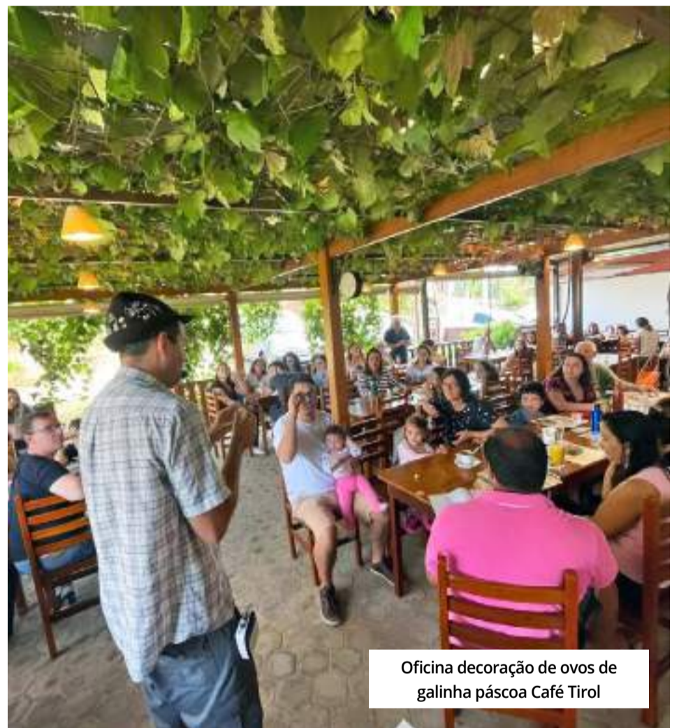
Oficina decoração de ovos de galinha páscoa Café Tirol