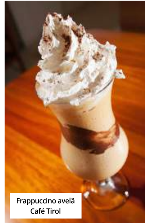
Frappuccino avelã Café Tirol

A cultura, a tradição e o afeto estão em cada canto do espaço. Outro diferencial do Café Tirol são as ações especiais realizadas em datas comemorativas. Neste ano, mais uma vez haverá oficinas de pintura de ovos de galinha na Páscoa.