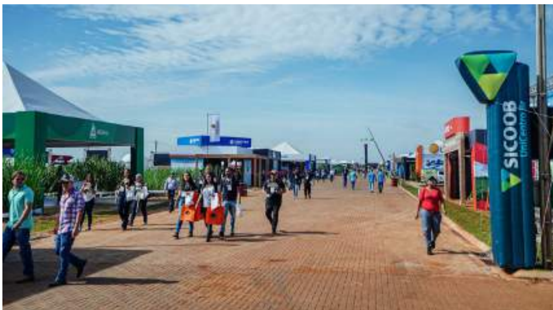
Evento este ano vai reunir mais de 130 expositores