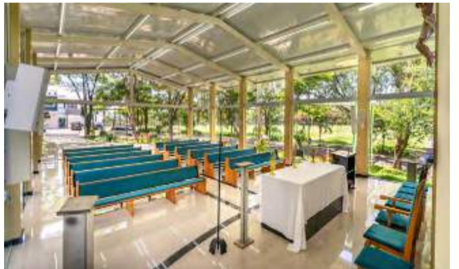
As missas diárias, realizadas às 7h, oferecem uma oportunidade única para encontrar conforto e renovar a conexão interior