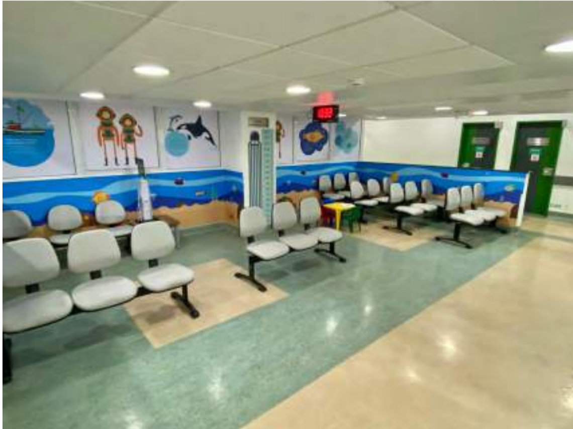
Pronto Atendimento da Criança (PAC), no Hospital Unimed, 24h