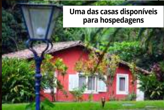
Uma das casas disponíveis para hospedagens

gar sagrado também é um convite para contemplar a arquitetura, mobiliários e imagens sacras carrega-