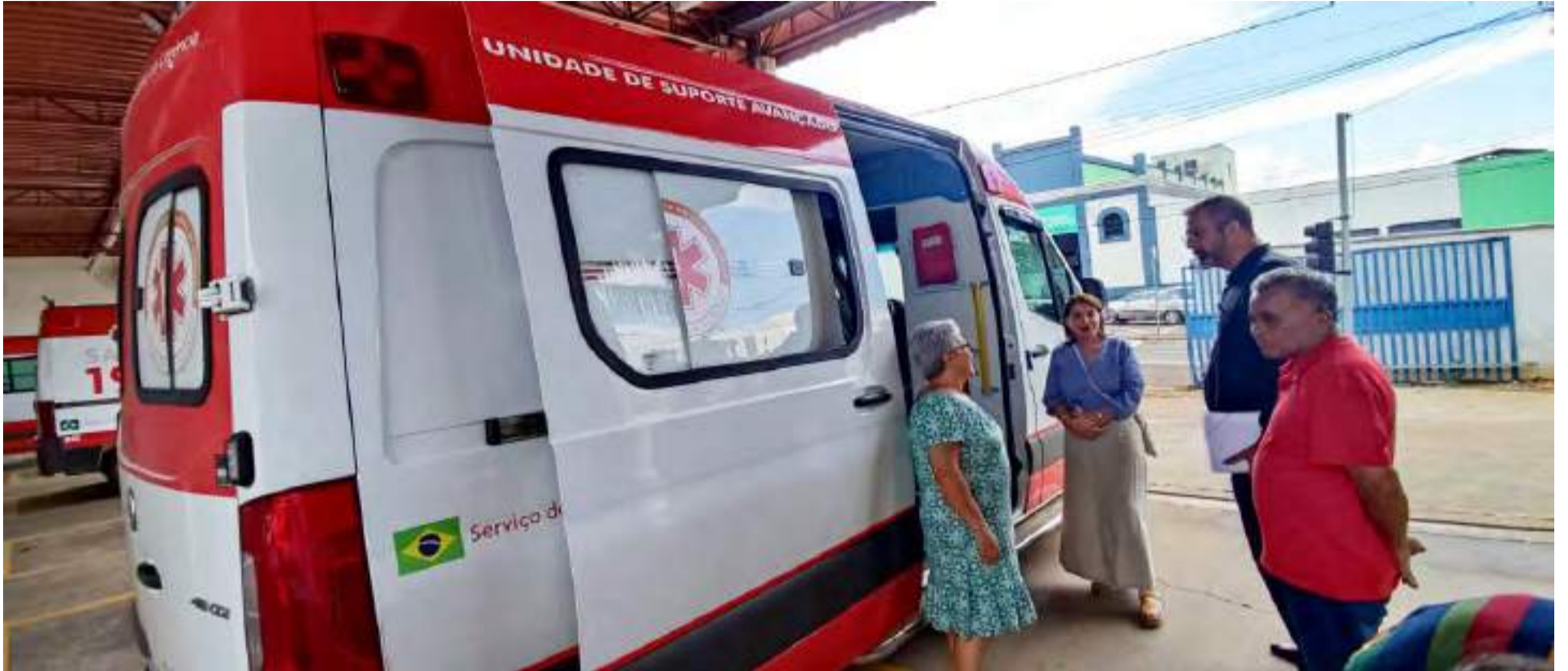
Das sete novas viaturas que serão destinadas à cidade, cinco são para renovação da frota e duas serão para ampliação da frota