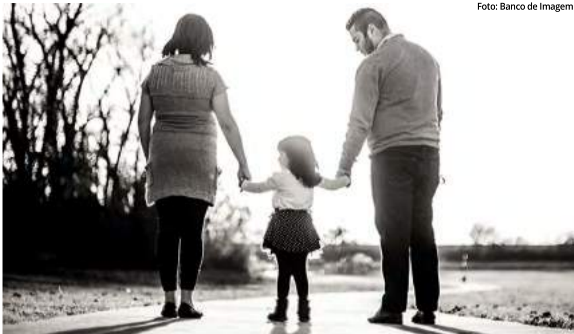
A Lei nº 11.698/2008 dividiu a guarda em duas formas: unilateral e compartilhada

A nova legislação estabelece que, mesmo na ausência de investigação criminal, indícios de violência doméstica já são suficientes para afastar os encargos compartilhados, visando proteger o bem-estar da criança e trazer à tona casos de violência familiar que não foram previamente identificados. “A Lei