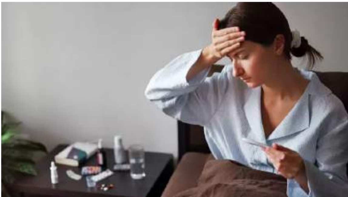
Alguns sinais, como o modo de evolução dos sintomas, podem dar pistas sobre cada uma das enfermidades

As chuvas de Verão trazem consigo uma explosão de casos de uma doença já conhecida entre os brasileiros: a dengue - doença que já atingiu mais de 500 mil pessoas em 2024, segundo dados do Ministério da Saúde. Febre, dores de cabeça e no corpo, cansaço e mal-estar são alguns de seus sintomas, mas essas também costumam ser manifestações relatadas por quem contrai Covid-19 e H1N1, sendo importante identificar essas diferenças para a obtenção de um diagnóstico assertivo e também para buscar a correta vacinação.