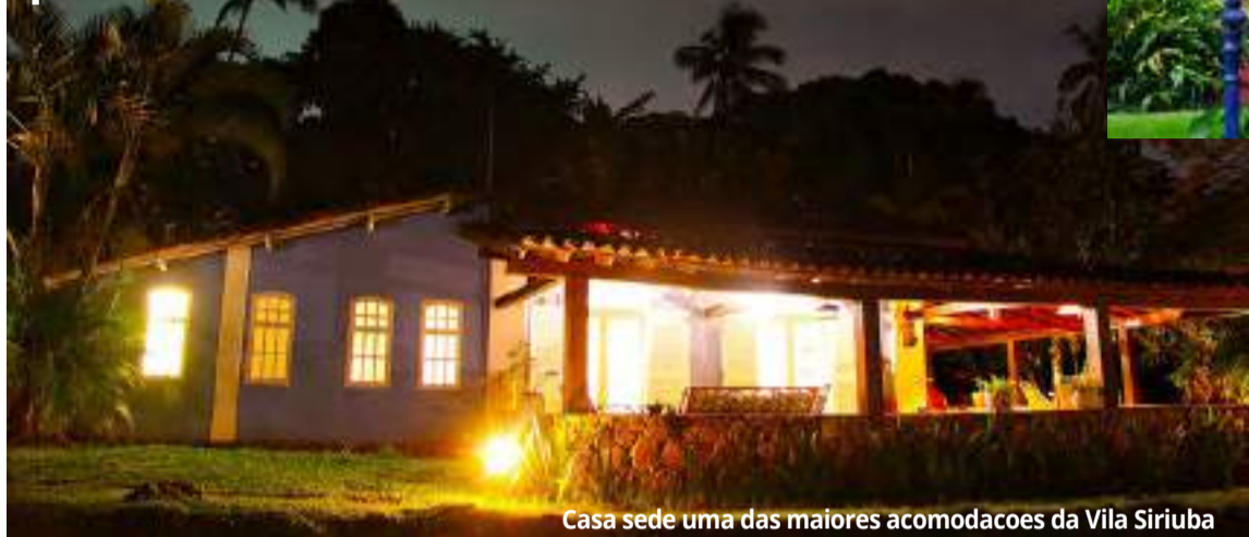
Casa sede uma das maiores acomodações da Vila Siriúba

Vila Siriúba possui casas e suítes em área de 55 mil m 2 integrada à Mata Atlântica