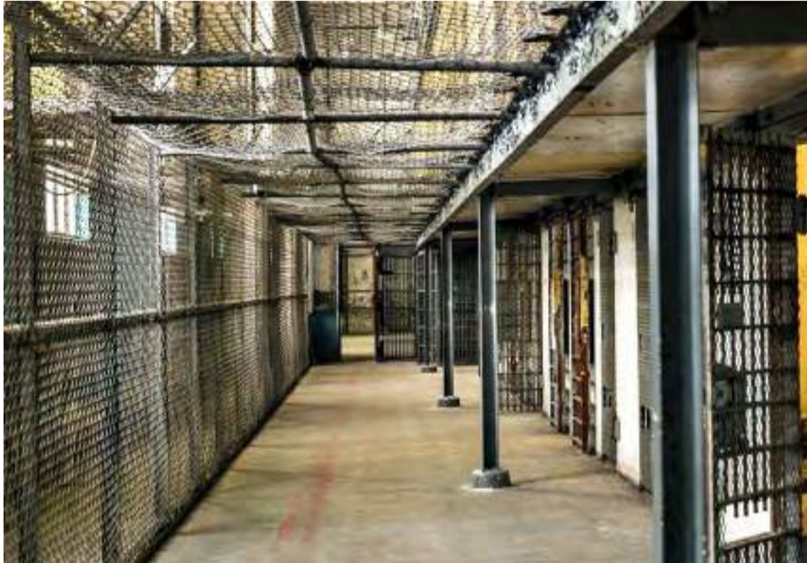
As divergências refletem concepções distintas sobre a função da pena e a eficácia do sistema penal brasileiro

Segundo o especialista, a saída temporária ocorre em quatro períodos de sete dias ao longo do ano, mas sua concessão em datas específicas, como feriados, gera eficácia administrativa. “No entanto, situações polêmicas surgem, como a libertação de presos, responsáveis pela morte dos seus genitores em datas como o dia dos pais ou das mães, alimentando o