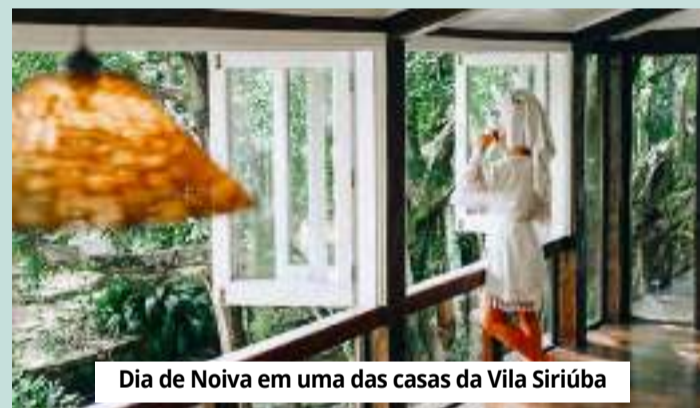
Dia de Noiva em uma das casas da Vila Siriúba

A vila está situada na principal avenida de Ilhabela, na praia de Siriúba, ao norte do arquipélago. Basta atravessá-la para fincar os pés na areia e se deliciar com um cenário cinematográfico de tirar o fôlego, com águas límpidas e cristalinas. Um convite irrecusável a um vigoroso banho de mar, com suas águas calmas e relaxantes.