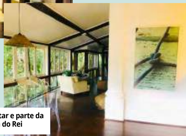
Vista da sala de estar e parte da sala da Casa do Rei