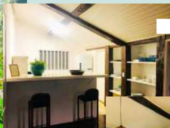
Cozinha integrada da Casa do Rei