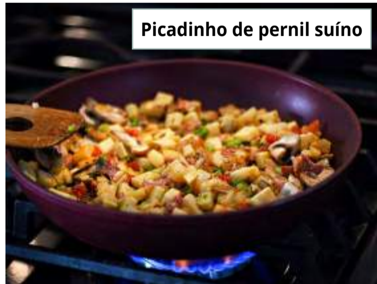
Picadinho de pernil suíno

Para integrar o cardápio, a nutricionista ensina cinco receitas fáceis de preparar com a carne suína.