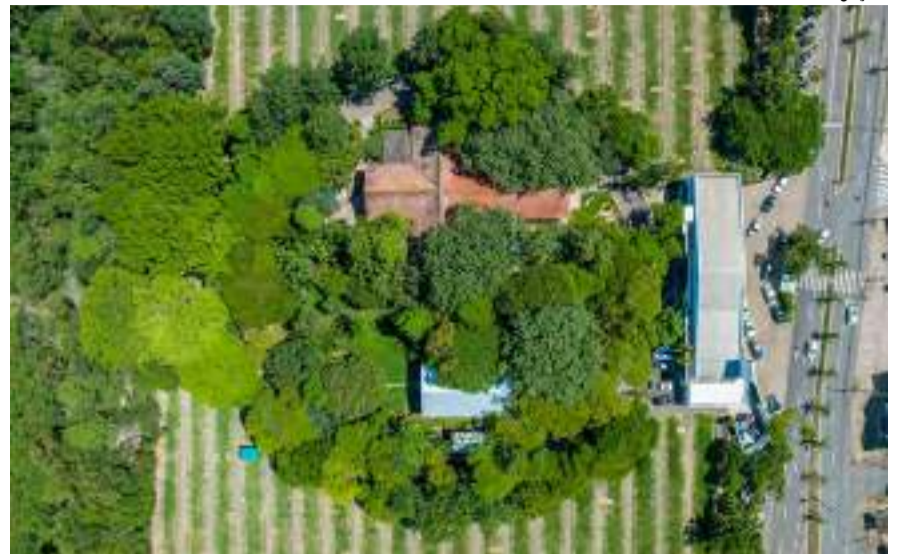
Mais do que um local de repouso eterno é um espaço onde a espiritualidade se encontra com a natureza