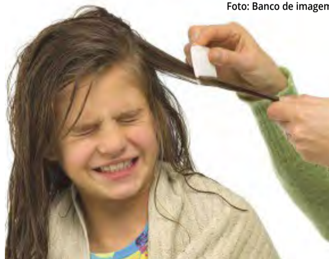
Embora sejam comuns durante a idade escolar, é possível adotar medidas simples para preveni-los

A temporada de regresso às aulas traz consigo a empolgação dos pequenos ao reencontrarem amigos, professores e se atualizarem sobre as novidades. Contudo, juntamente com essa animação, surge uma preocupação recorrente para os pais: os indesejados piolhos.