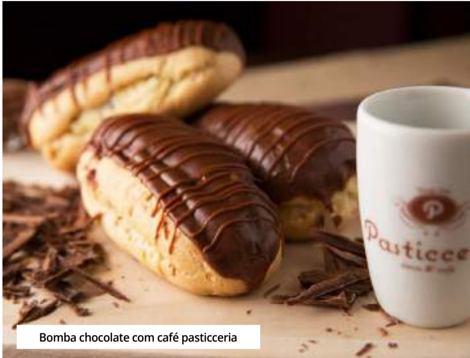
Bomba chocolate com café pasticcieria

Outra opção que vale a pena conhecer é o gròstoi (grostoli), um doce muito popular no Trentino (norte da Itália, Áustria e Suíça). A guloseima é indispensável no café da manhã e da tarde de uma família tirolesa acompanhado de um bom café e uma ótima conversa. A tradição que está disponível no cardápio do Café Tirol é uma herança local, pois a cafeteria/restaurante está localizada no bairro rural Santa Olímpia, uma comunidade de imigrantes tiroleses em Piracicaba.