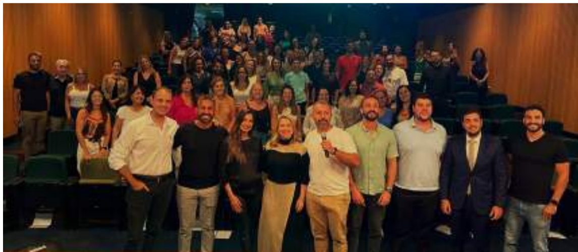
Público, integrantes do CJE e convidadas celebraram o sucesso do 1º CJE Talks