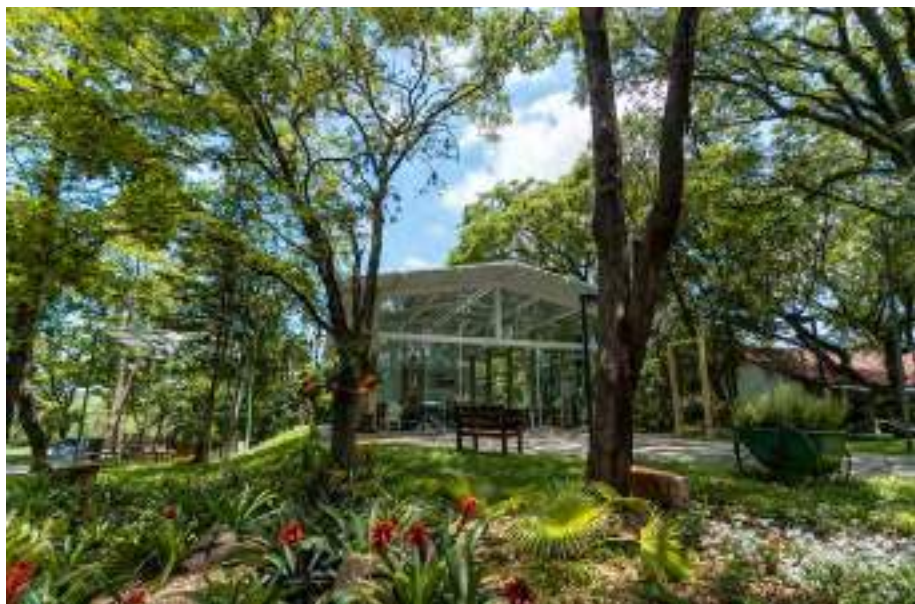
O Cemitério Parque da Ressurreição oferece missas diárias às 7h, proporcionando um momento de reflexão e conexão espiritual

Além disso, o Cemitério Parque da Ressurreição oferece missas diárias às 7h, proporcionando um momento de reflexão e conexão espiritual para aqueles que desejam encontrar conforto em meio à rotina agitada do dia a dia. Essas