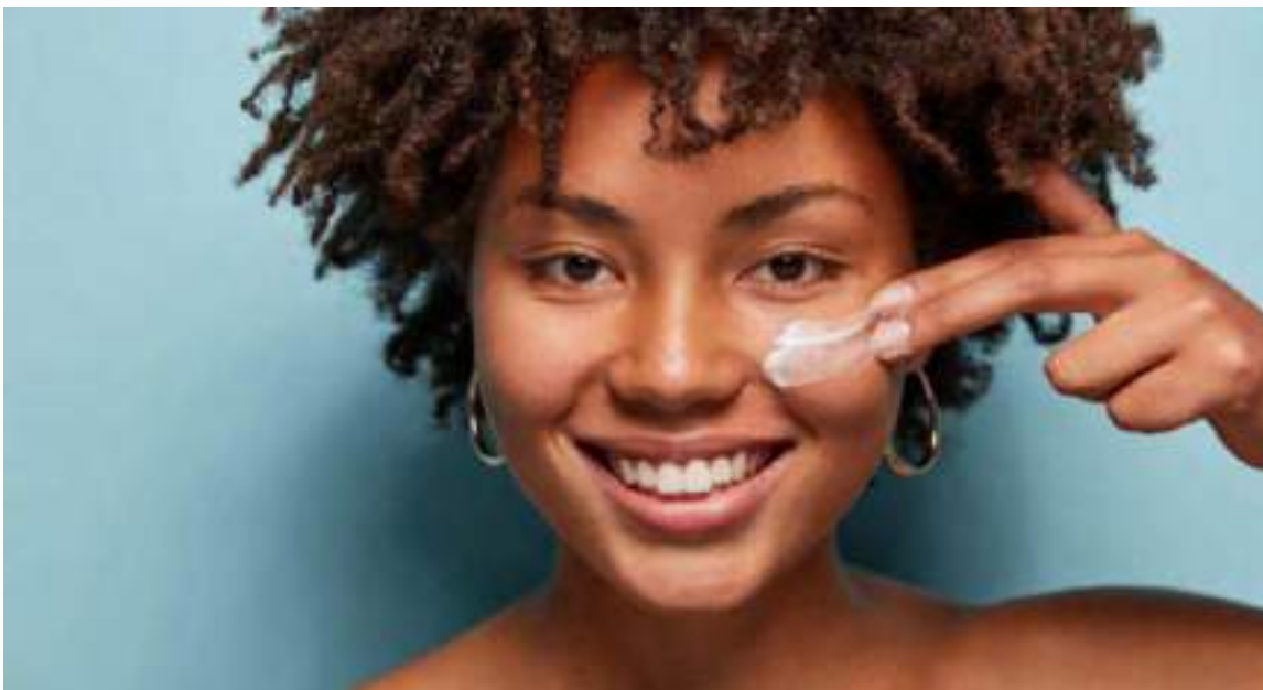
Muitos desconhecem é a diferença entre protetores químicos e físicos

H á quem pense que protetor solar “é tudo a mesma coisa”, “protege igual do sol”, “basta escolher um FPS alto”. Pode até ser. Mas o que muitos desconhecem é a diferença entre protetores químicos e físicos. A proteção solar é eficaz em ambos, mas a ação no corpo não se compara. Um deles, com uso a longo prazo, pode causar reações ao organismo e ao meio ambiente.