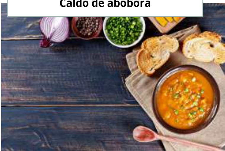
Caldo de abóbora