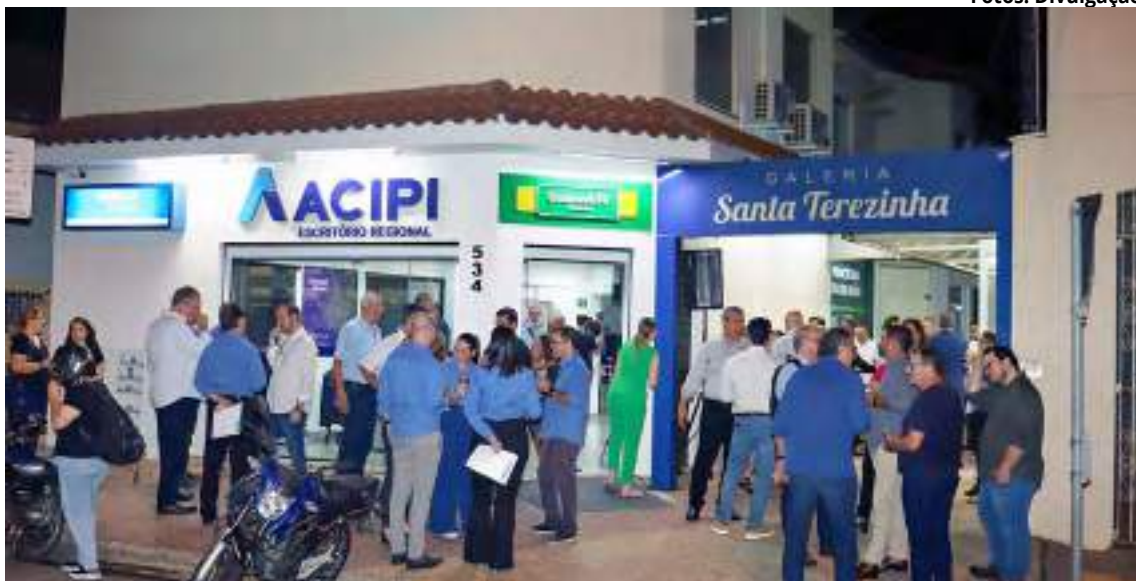
Novo espaço da Acipi em Santa Teresinha fortalece atendimento e parcerias estratégicas

Uma das principais novidades disponibilizadas na unidade é a parceria estabelecida com o Sebrae