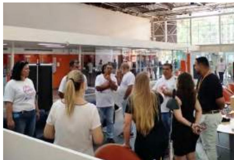
Os dirigentes também conversaram com os funcionários da agência