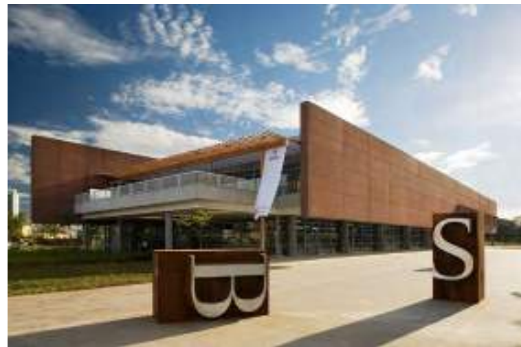
Biblioteca de São Paulo.

tece laços significativos que ilustram como o acesso à cultura e ao conhecimento podem transformar positivamente a trajetória de uma pessoa. Esse