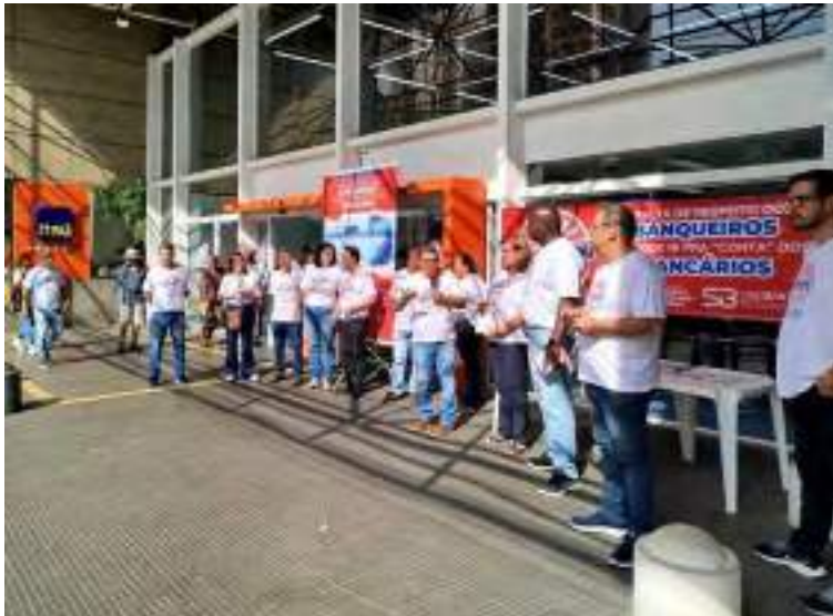
O ato reuniu diretores do Sindicato e contou com discursos voltados aos clientes que acompanharam