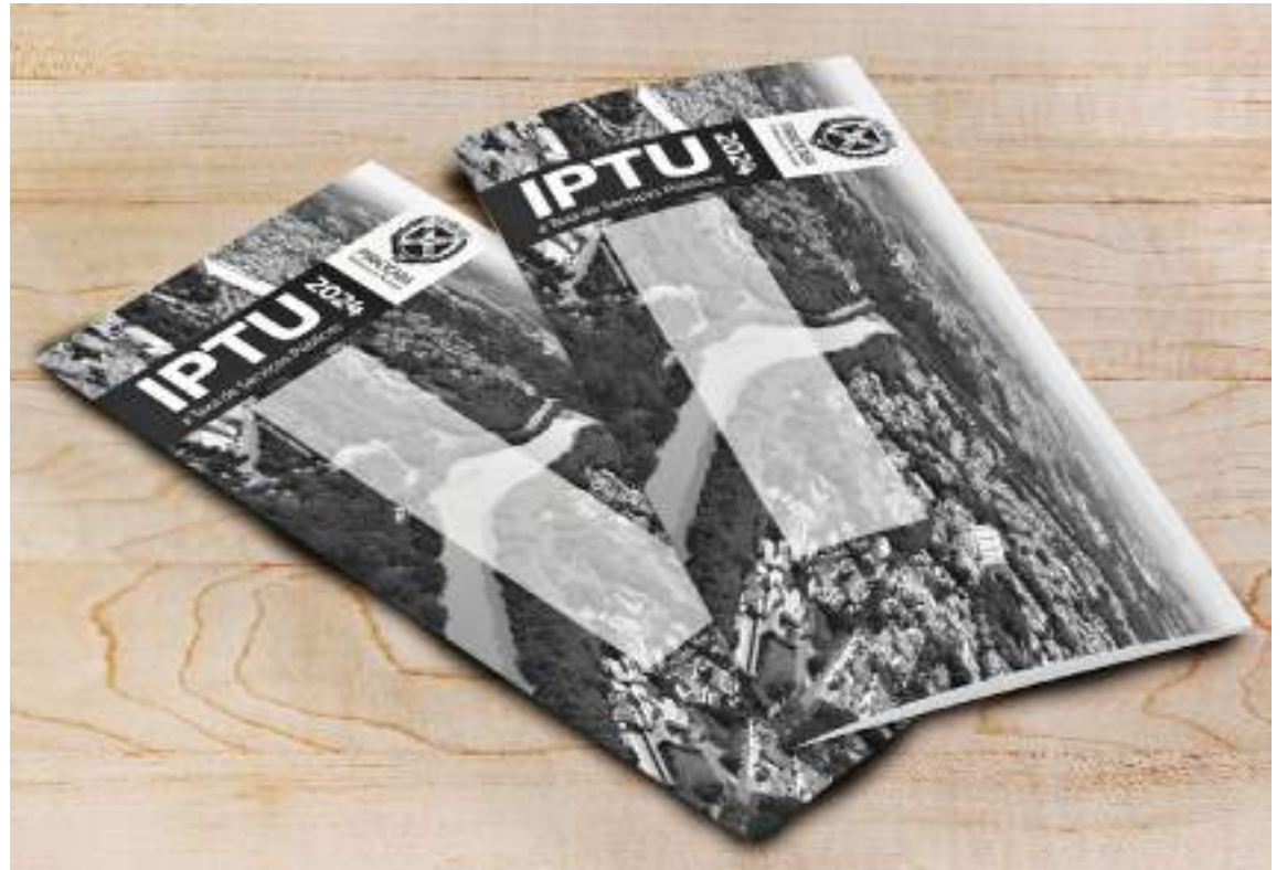
O não pagamento do IPTU/24 nos prazos previstos terá a incidência de juros e multa

O não pagamento do IPTU/24 nos prazos previstos terá a incidência de juros de 1% ao mês e multa de 2% até o 30º dia do vencimento, 5% do 31º ao 180º dia do vencimento e de 10% a partir do 181º dia após o vencimento, calculados sobre o valor do tributo corrigido. Em caso de falta de pagamento do tributo, poderá haver multas, juros, atualização monetária, inscrição da Dívida Ativa, instauração de processo de exe-