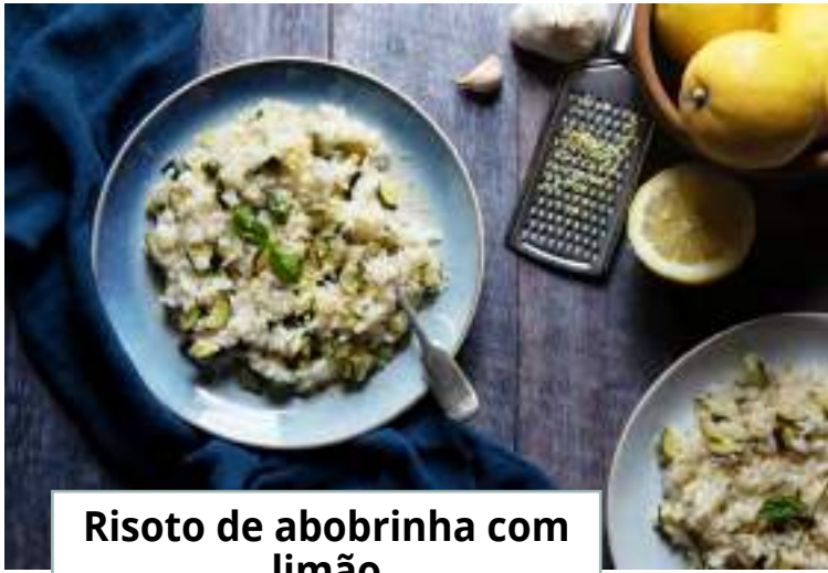
Risoto de abobrinha com limão