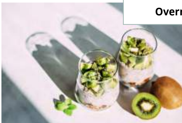
Overnight de kiwi

Refogue a cebola na manteiga, adicione o arroz integral e, logo em seguida, o vinho branco. Quando o vinho estiver evaporando, adicione, aos poucos, o caldo de legumes. Mexa o arroz para não grudar no fundo da panela. Cozinhe em fogo brando. Quando o arroz estiver ao dente, acrescente o suco de limão e a abobrinha, acerte os temperos. Desligue e acrescente o requeijão, o parmesão e sirva com as raspas de limão.