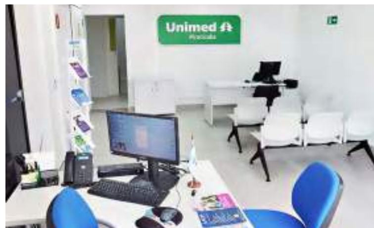
Espaço foi revitalizado para oferecer suporte às empresas associadas à Acipi

"...Essa parceria ganhou ainda mais relevância com a introdução das consultas remotas que visam atender às necessidades daqueles que não têm acesso à internet ou não podem realizar consultas em casa..."