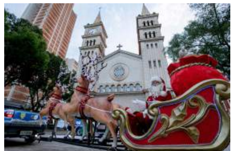
TRENÓ DO PAPAÍ NOEL - O Bom Velhinho percorrerá os principais corredores comerciais da cidade