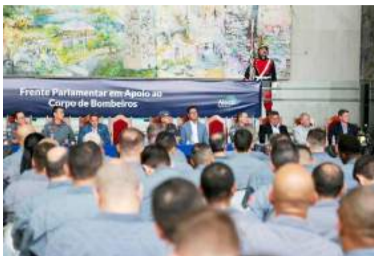
O grupo pretende ampliar investimentos e promover ações de fortalecimento para a corporação