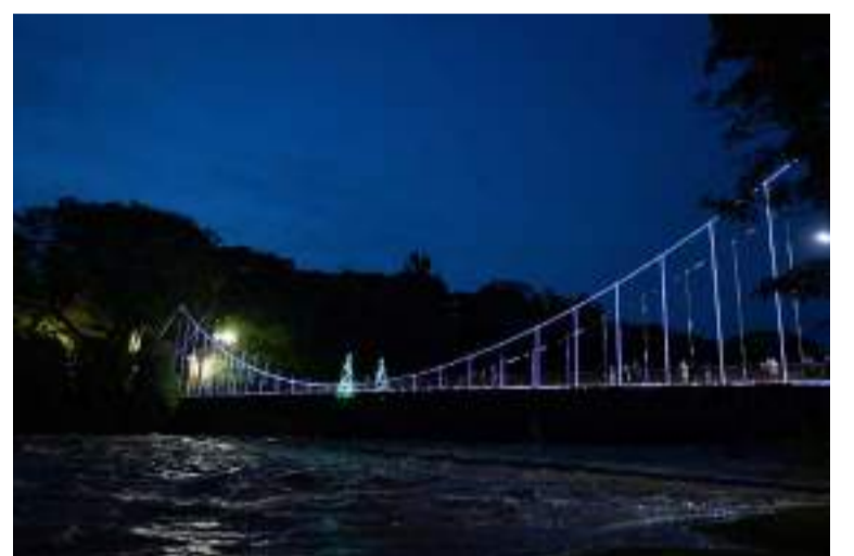
LUZ E ARTE - O acendimento da Ponte Pensil que aconteceu no dia 1º de dezembro, marcando o início da programação natalina da Acipi