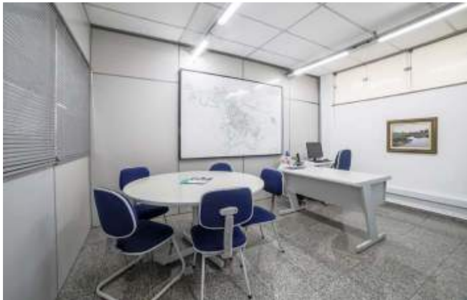
Os serviços foram agrupados em três pacotes: Comercial, Essencial e Standard