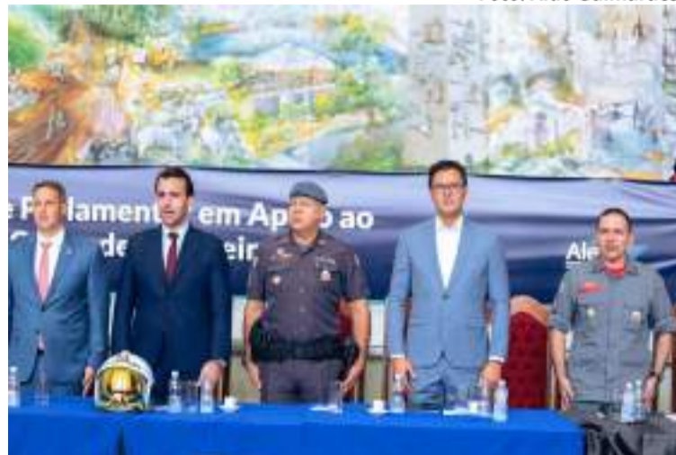
Lançamento da Frente Parlamentar em Apoio ao Corpo de Bombeiros