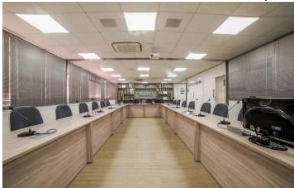
Além de ser um local adequado para receber os clientes ou fornecedores, ainda há a possibilidade de ser sede fiscal de empresas