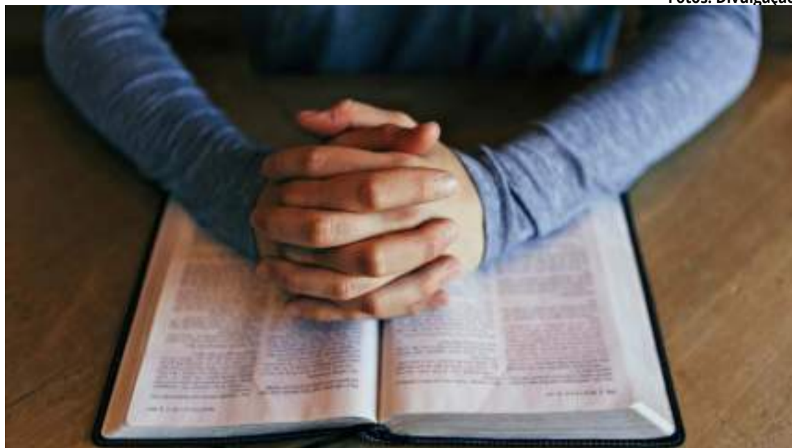
Como forma de apoio, a espiritualidade é um grande aliado nestes momentos

Desta forma, a fé nos faz olhar os recursos não apenas espirituais, mas também físicos,