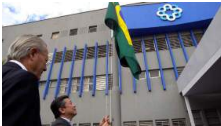
Hasteamento da Bandeira