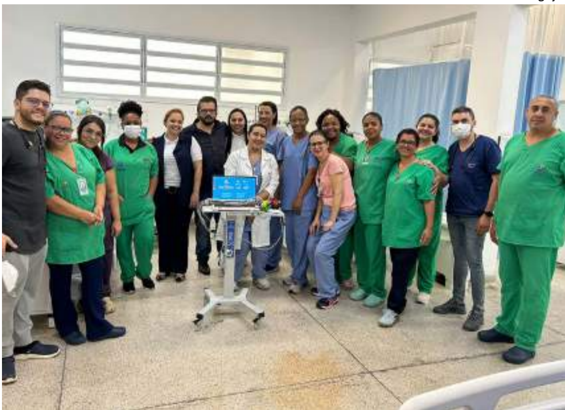
Equipe de enfermagem da UPA Vila Cristina, passou por um treinamento online com os responsáveis pelo programa ‘Boas Práticas’

O Projeto Boas Práticas é uma parceria do Hospital do Coração de São Paulo e Beneficência Portuguesa com o Ministério da Saúde, através dos editais PROADI-SUS que tem como objetivo qualificar o