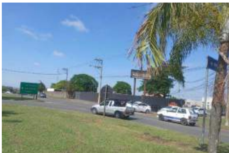
Bebel propôs R$ 6,5 milhões para construção de alça na Rodovia Cornélio Pires para garantir o acesso de quem trafega pela avenida Laranjal Paulista, no Campestre

Bebel espera que “tenha sensibilidade”, uma vez que também é piracicabano e conhece muito bem as necessidades da cidade.