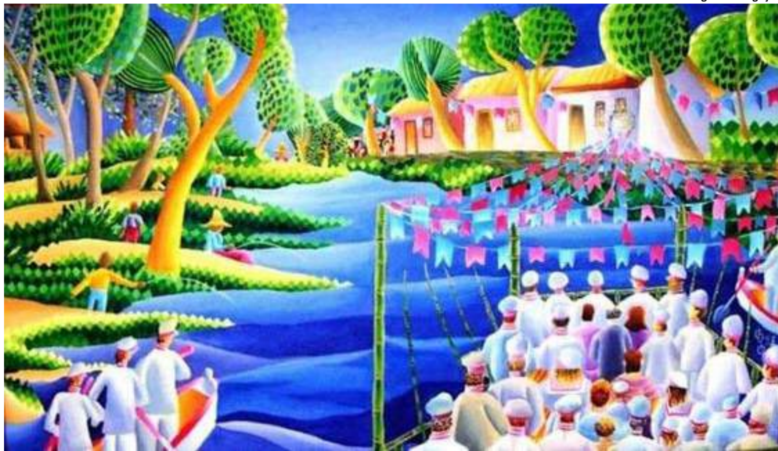
Quadro sobre a Festa do Divino, de autoria de Ciro de Oliveira .

Com isso fomos despertando amigos nas redes sociais, pedindo-nos que levássemos a Bandeira para ser aportada em suas casas, onde éramos sempre recebidos com demonstrações de fé, esperança e várias histórias contadas so-