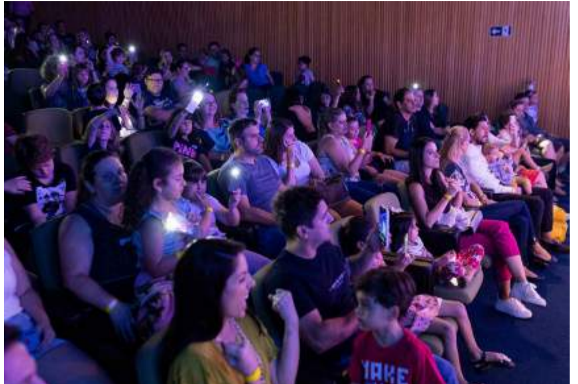
O auditório da Acipi recebe o Espetáculo Circo de Natal, nos dias 18 e 19, em duas sessões diárias, às 19h e 20h30

No dia 22, às 19h, a banda da Associação Atlética Educando para o Esporte e a Guarda Civil Muni-