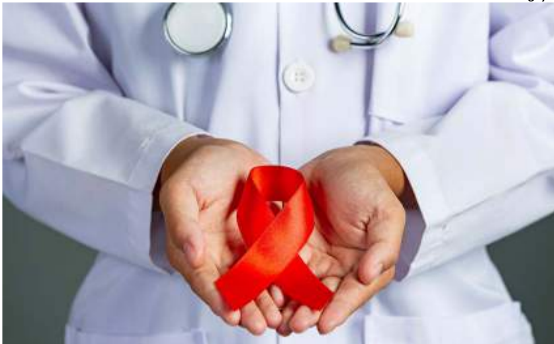
Segundo dados do Ministério da Saúde, de 1980 até junho de 2022, foram identificados 1.088.536 casos de Aids no Brasil

Durante todo este mês de dezembro, todos os treinamentos na UPA, serão direcionados para a cardiologia.