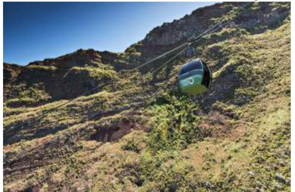
Teleférico das Achadas da Cruz