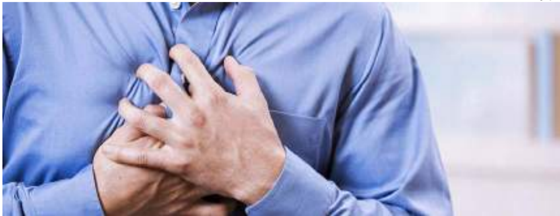
Estudo mostra que sinais aparecem horas antes de uma parada cardíaca; homens sentem mais dor no peito e falta de ar enquanto as mulheres têm mais falta de ar

Metade dos pacientes que sofrem uma parada cardíaca fora do hospital apresentam pelo menos um sintoma nas horas ou dias anteriores, mostra um novo estudo