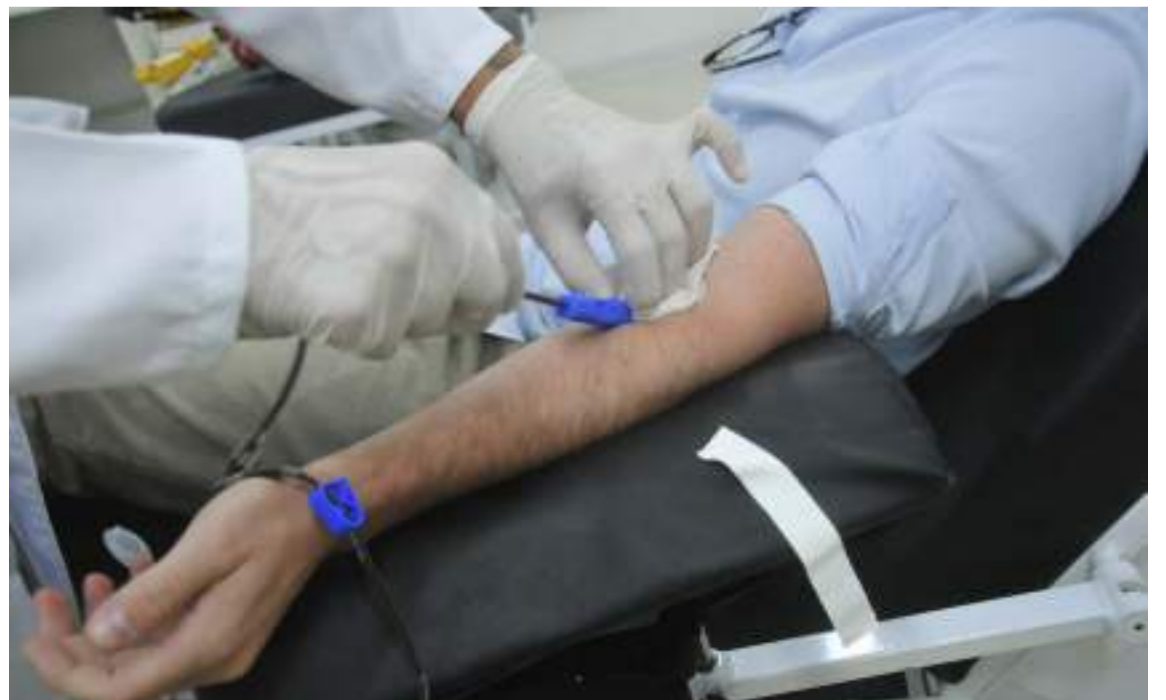
Doar é rápido e seguro; uma única doação pode salvar até quatro vidas

Salva Vidas: As doações de sangue são vitais para pacientes em procedimentos médicos complexos, como cirurgias, tratamento de câncer, transplantes e