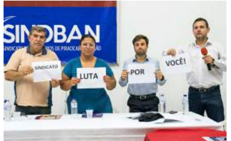
Diretores fazem apresentação sobre curso de formação focado na história e trabalho dos Sindicatos.

Outro problema levantado durante a plenária foi o aumento de