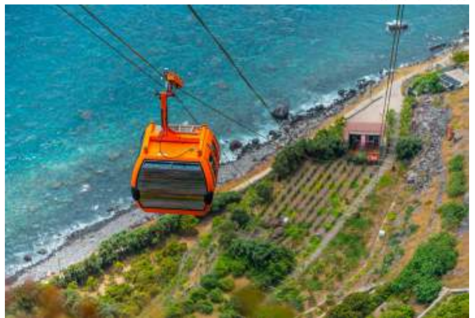
Teleférico do Rancho