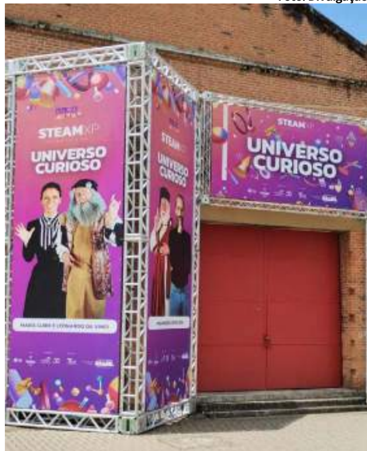
Entrada da a STEAM XP Universo Curioso

tal, por meio da Fundação ArcelorMittal e apoio da Prefeitura Municipal de Piracicaba, por meio da Secretaria Municipal de Ação Cultural (Semac). Esse evento compõe os investimentos da Fundação ArcelorMittal na difusão da abordagem STEAM, oportunizando o aprendizado dentro e fora da sala de aula.