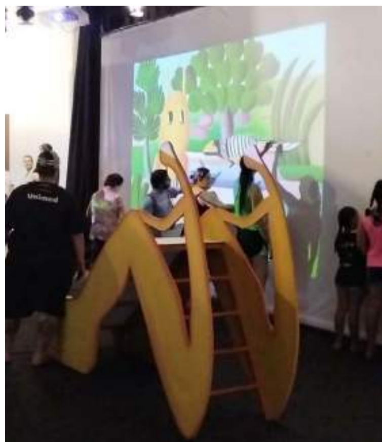
Tarsila do Amaral