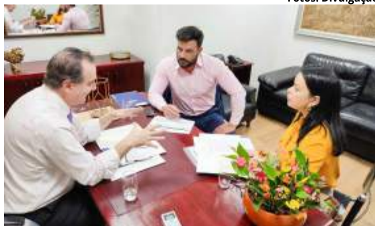
O encontro foi marcado pela discussão de temas importantes relacionados à educação e a infraestrutura escolar no Estado e na Região Metropolitana de Piracicaba

Entre os pleitos apresentados de diversas cidades paulistas, muitas delas da região de Piracicaba, estão construção e reformas de escolas, quadras esportivas e equipamentos, transporte escolar, mobiliários e materiais peda-