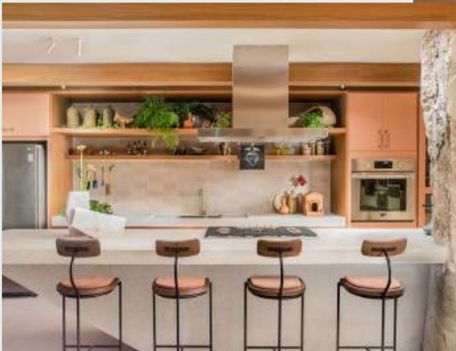
Cozinha Funcional Bruno-Moraes

Em uma tonalidade de rosa retrô, presente na marcenaria desenvolvida pela Celmar, e em outros elementos que abraçam o espaço, a cozinha se apresenta como um lugar convidativo e acolhedor para inspirar novos preparos e receber pessoas.