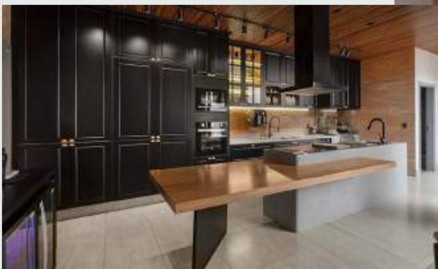
Cozinha projeto Arquitetura Silvia-Vania

Já a paleta de cinzas e preto transita entre os estilos clássico e industrial contemporâneo, trazendo sofisticação e equilíbrio com acabamentos, acessórios e eletrodomésticos.