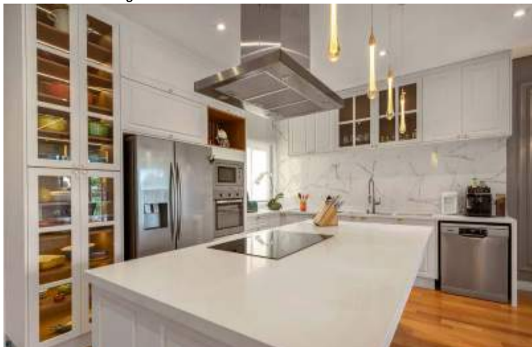
Celmar Campolim - Camila Amaral

E os tons mais clássicos, como branco, em composição com revestimentos em pedra e madeira dão a sensação de amplitude aos ambientes.