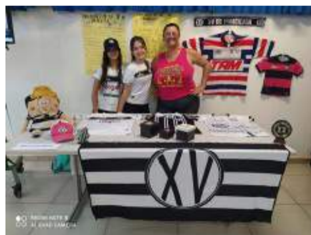
O XV, na homenagem aos 110 anos por alunos e professores da escola.