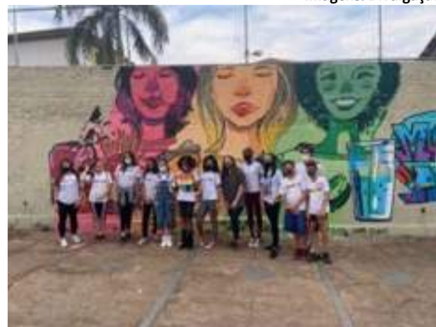
Um dos muros grafitado da escola, pelos próprios alunos.