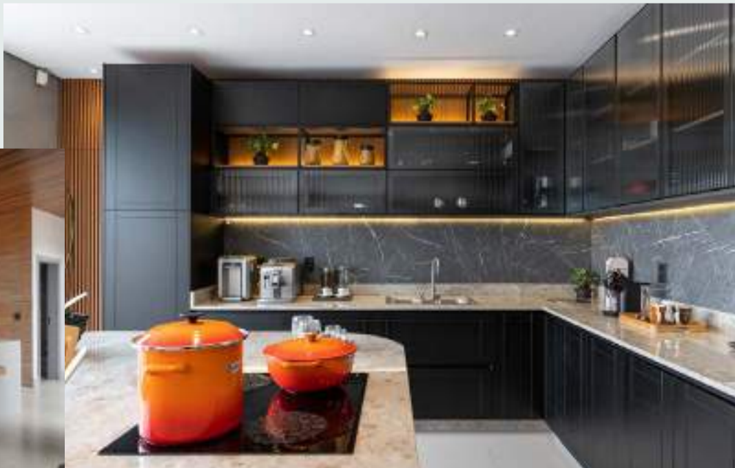
Celmar Tatui-SP - Studio Elo Arquitetura