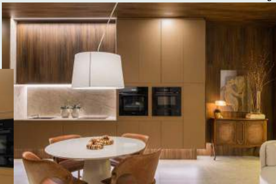
Loft Cosmopolita - Marcelo Lopes - CASACOR-PR