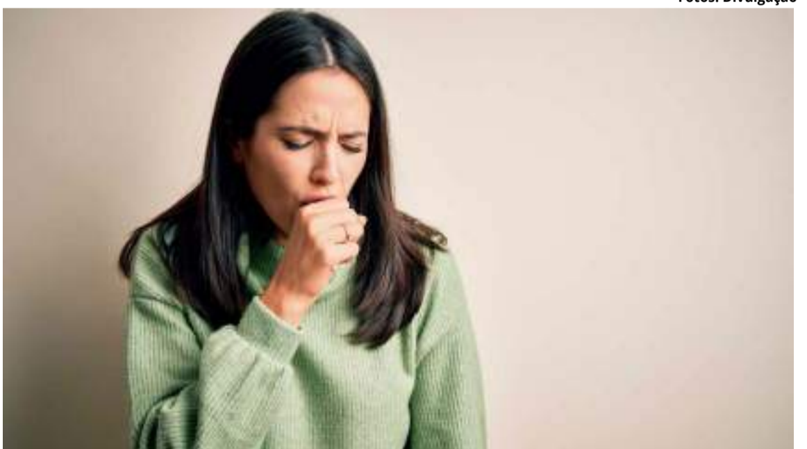
Alergista destaca riscos à saúde e razões pelas quais nunca se deve realizar alquimias caseiras

“Além disso, se a pessoa for alérgica a algum componente desses produtos, pode ter uma reação de pele ao contato ou até queimaduras”, sinaliza o alergista. Outro fator é que, dependendo da mistura realizada, os componentes podem até mesmo causar explosões, colocando pessoas e