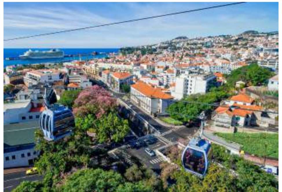
Teleférico do Funchal

cerca Fajã dos Padres é um espetáculo à parte e vale a visita. Para chegar até Fajã, os visitantes podem utilizar o teleférico, que passa pela enorme encosta de forma rápida e confortável, garantindo um visual incrível. O teleférico tem cerca de 300 metros de altura e vai do Miradouro até a praia da Fajã dos Padres em menos de três minutos.