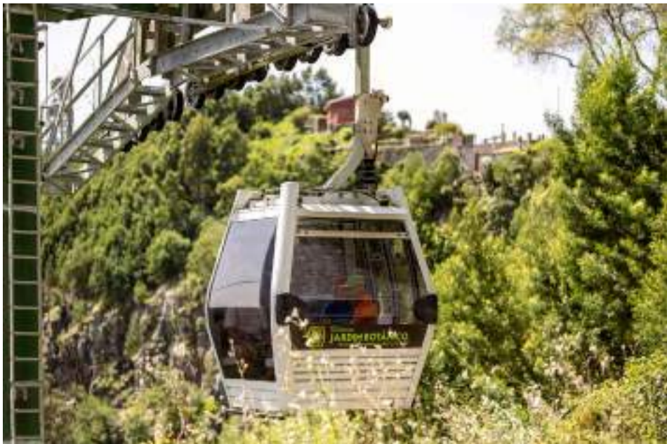
Teleférico do Jardim Botânico