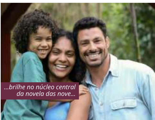
...brilhe no núcleo central da novela das nove...