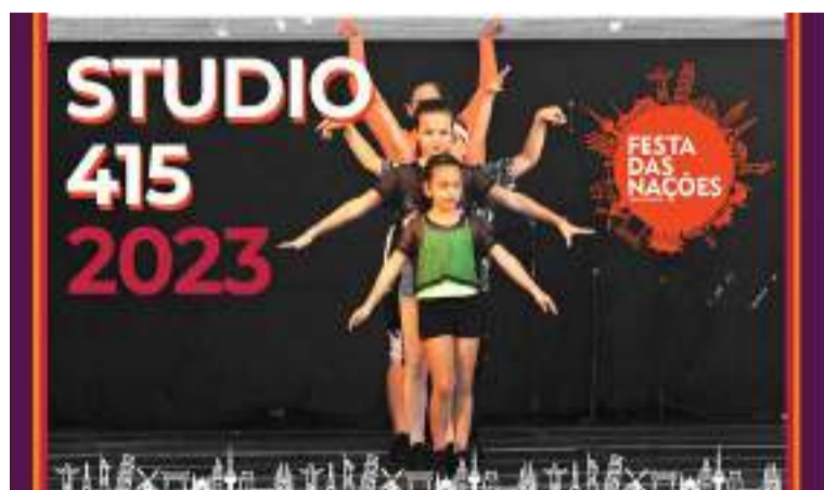
Anúncio do Studio nas redes sociais.