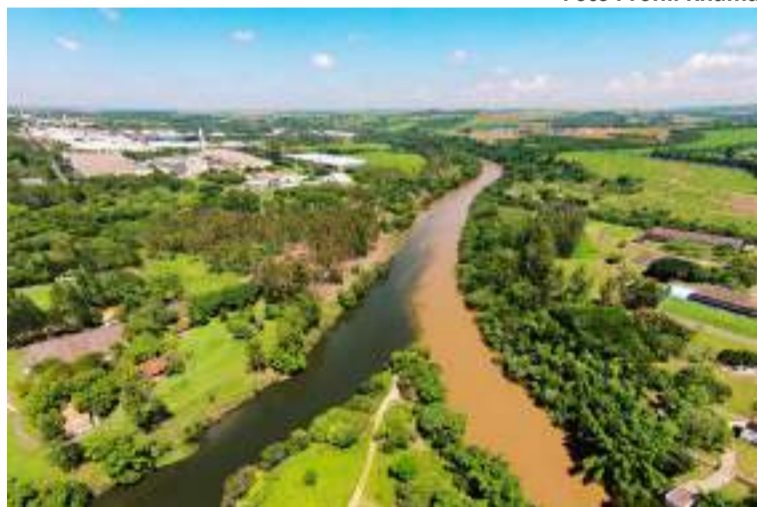
Formação do Rio Piracicaba, em Americana (SP). Junção do Rio Jaguari e Atibaia.