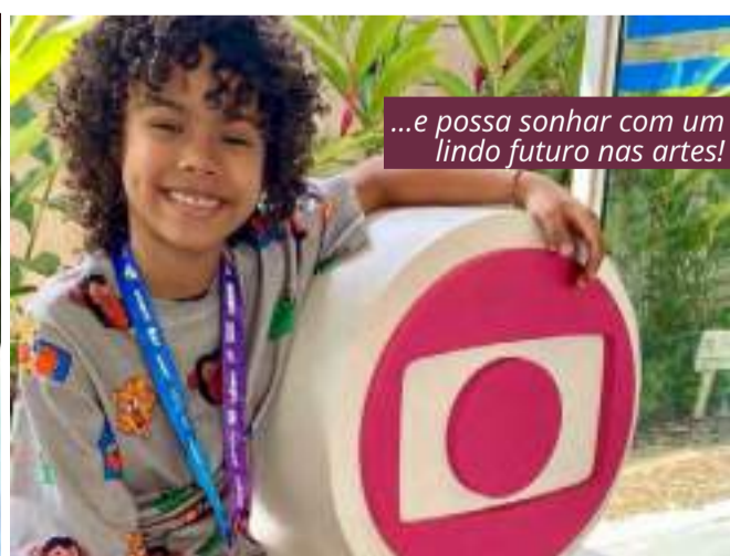
...e possa sonhar com um lindo futuro nas artes!