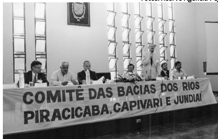
1993 - Instalação CBH-PCJ Paulista

2006 - Implantação da Cobrança Estadual Paulista