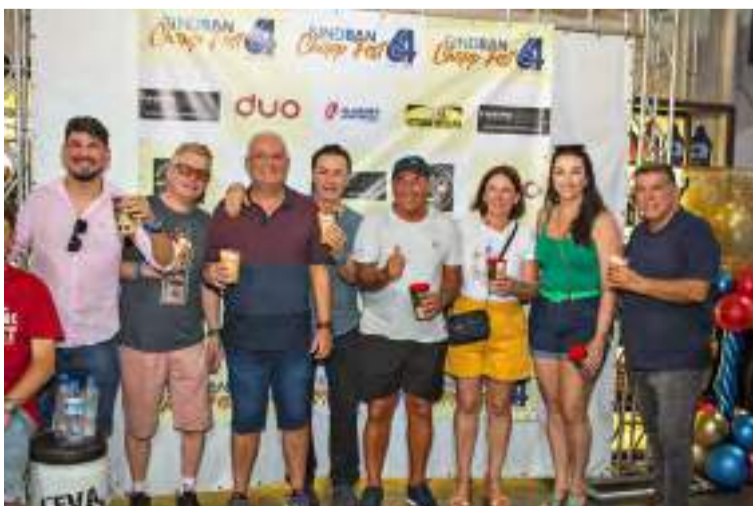
Diretores do Sindicato durante a SindBan Fest Chopp 6.4.

"O nosso Sindicato está presente, por meio dos nossos diretores, em dez con-