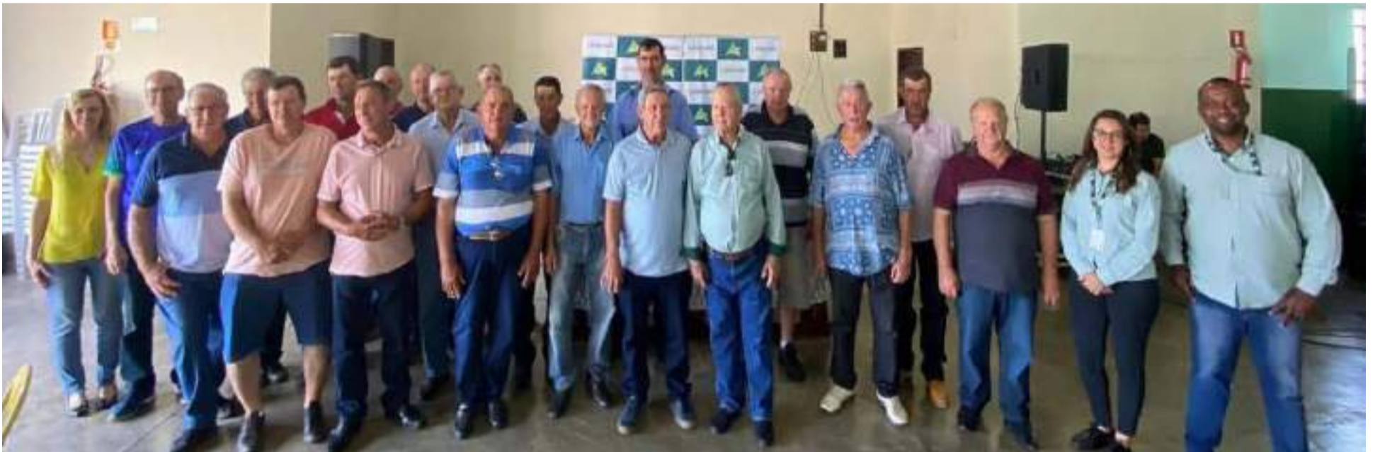
Um evento para a família. Um momento para refletir e expressar gratidão pela generosidade da terra