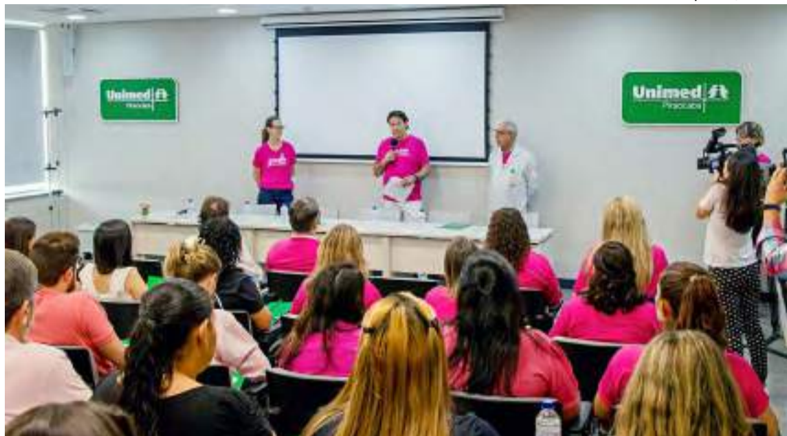
4º Simpósio Multidisciplinar Mais Vida, um evento alusivo ao movimento Outubro Rosa