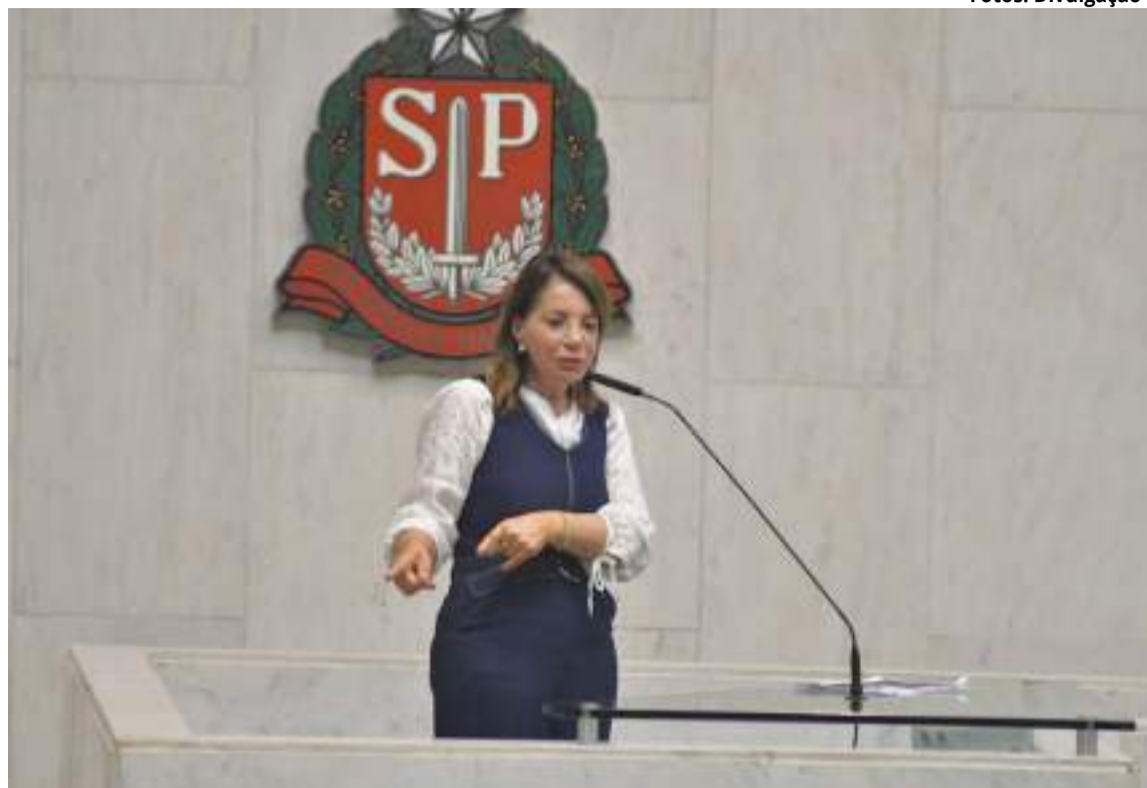
De acordo com a proposta da deputada Bebel, a mediação escolar deverá propiciar a integração de todos os componentes da unidade escolar e da comunidade na qual ela se encontra inserida

A mediação será desenvolvida com atuação de forma ativa, preventiva e mediadora, assim como calcada em princípios éticos e democráticos, de forma conjunta com a equipe gestora, visando ações preventivas e a construção de normas coletivas de convivência nas escolas. Também promoverá oitiva dos alunos, individual ou coletivamente; garantirá o fortalecimento dos grêmios estudantis como órgão de representação dos alunos; o fortalecimento dos sindicatos e associações de servidores como representações destes; promoverá reuniões constantes entre representantes de servidores, alunos e pais nas escolas; fará o cadastramento e convívio com entidades governamentais ou não, que atuem na área em que se localiza a unidade esco-