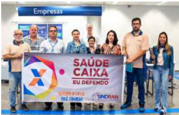
Mobilização e visita às agências em defesa do Saúde Caixa.

No caso da CEF, a mobilização está sendo realizada durante todo o mês e tem como objetivo a manutenção do Saúde Caixa, o plano de saúde dos trabalhadores, nos moldes atuais. No dia 17, os diretores visitaram as agências e distribuíram material de esclarecimento, no dia 26 aconteceu uma plenária virtual e está prevista nova mobilização para esta segunda-feira, dia 30.