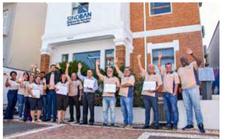
Diretores iniciam assembleia do Bradesco na sede do SindBan.