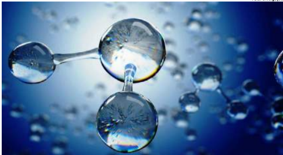
Ozônio traz inovação na higiene hospitalar com resultados comprovados em pesquisas

O mercado de metais sanitários está sendo transformado por uma inovação que garante mais segurança e bem-estar em ambientes hospitalares. Trata-se da tecnologia ozônio,