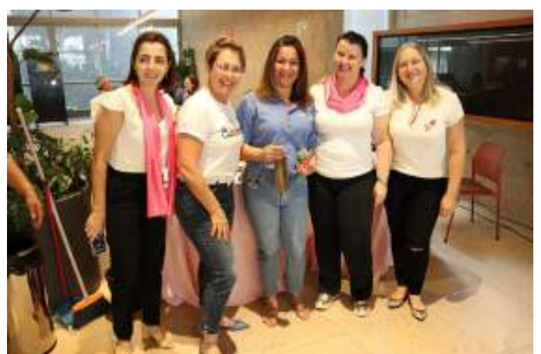
Levando em conta essa motivação, o CME da Acipi fechou a programação do Outubro Rosa com corte de cabelos gratuito para doação e confecção de perucas às pessoas em tratamento de câncer