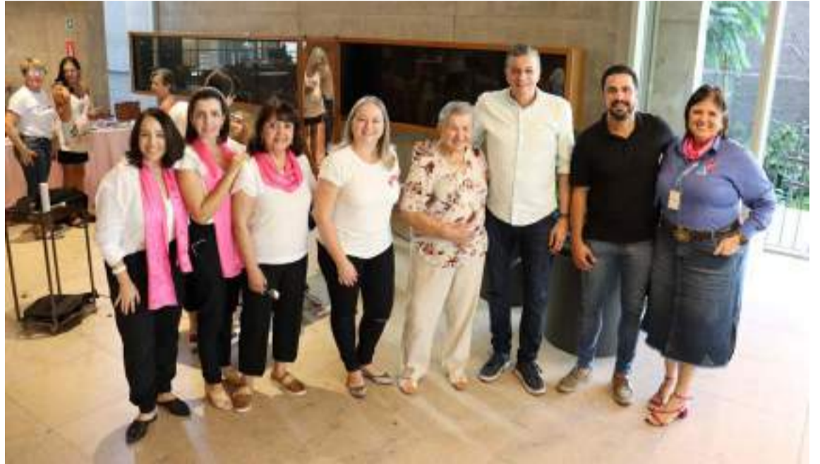
Parte da diretora da Acipi e CME em uma parceria com o projeto Cabelovers