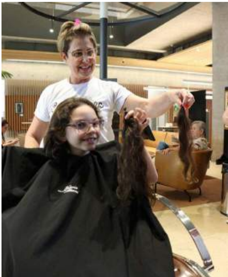
Crianças também participaram da iniciativa