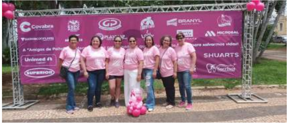
Organizadoras da caminhada Outubro Rosa

Se você ama tomar um cafezinho, torne este momento ainda mais especial, consumindo com mais consciência e saboreando as pausas que você tem para relaxar, conversar com amigos e familiares. Cultivar bons hábitos nem sempre é tarefa fácil, mas você pode dar o primeiro passo aproveitando os pequenos momentos e oportunidades.