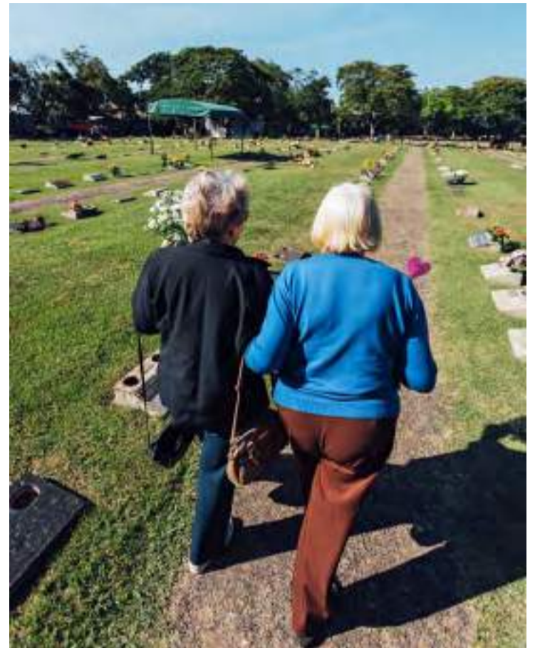
Neste Dia de Finados, o Cemitério Parque da Ressurreição convida a comunidade de Piracicaba a celebrar a vida, honrar as memórias e criar um ambiente de amor e reflexão

Neste Dia de Finados, o Cemitério Parque da Ressurreição convida a comunidade de Piracicaba a celebrar a vida, honrar as memórias e criar um