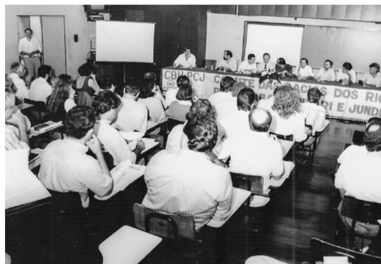
1995 - 1ª Reunião Extraordinária CBH-PCJ

2008 - Instalação do Comitê Piracicaba Jaguari - Comitê Mineiro