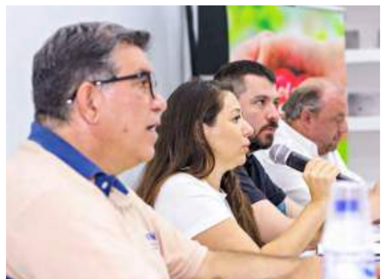
Mesa de abertura do Conselho Municipal de Mobilidade.