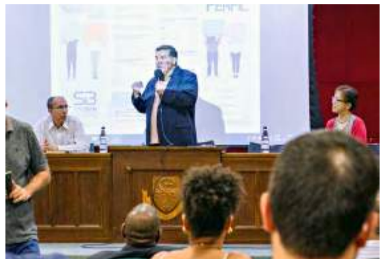
Paiva apresenta dados sobre adoecimento dos bancários durante evento do Cerest.