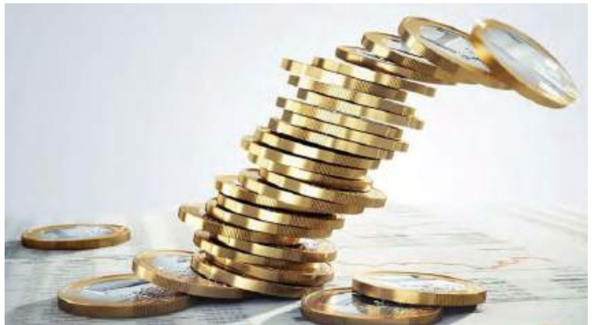
O ritmo de queda da taxa de juros estabelece uma relação direta com financiamentos, retorno de investimentos e empréstimos

distribuição, a construção civil se mostra presente em toda a cadeia, que vai desde a construção de espaços para atividades especializadas até a criação e manutenção de vias de transporte, como ferrovias e rodovias, ain-