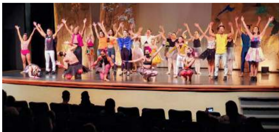
Comemorando uma apresentação no Teatro "Erotides de Campos."