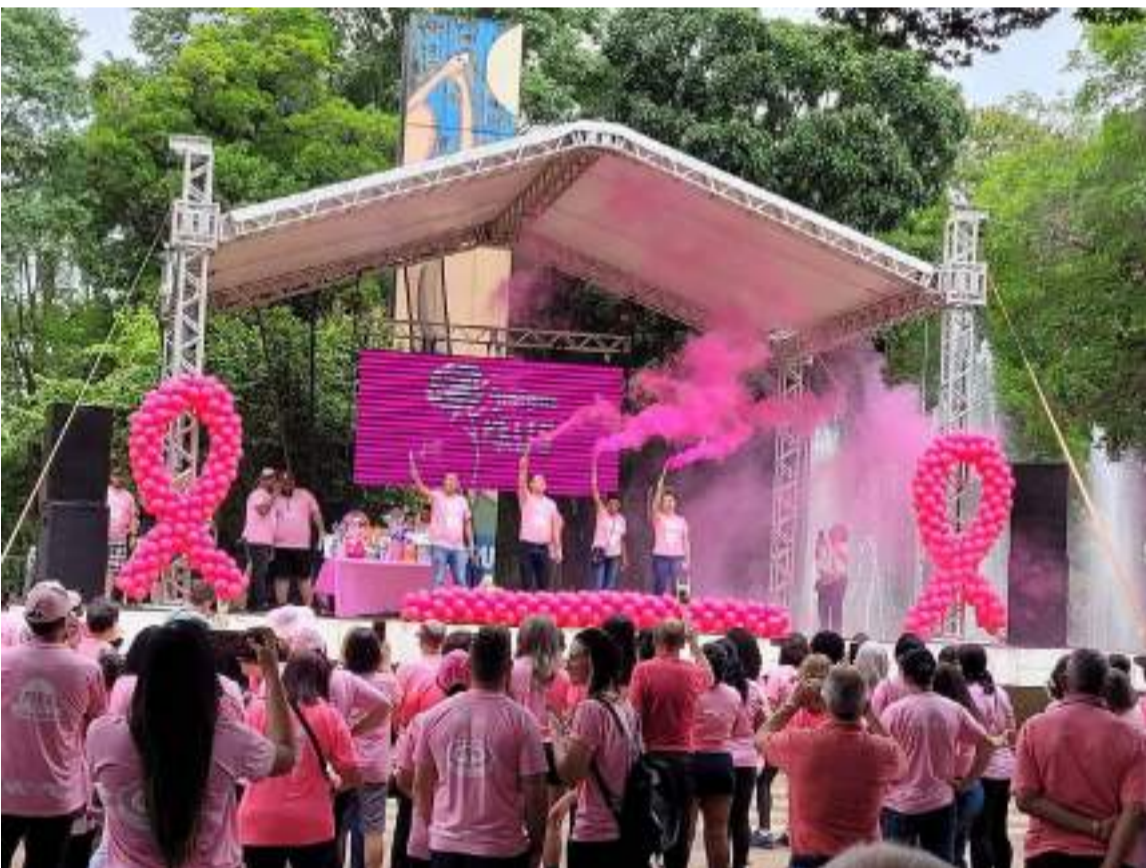
Outubro Rosa Capivari