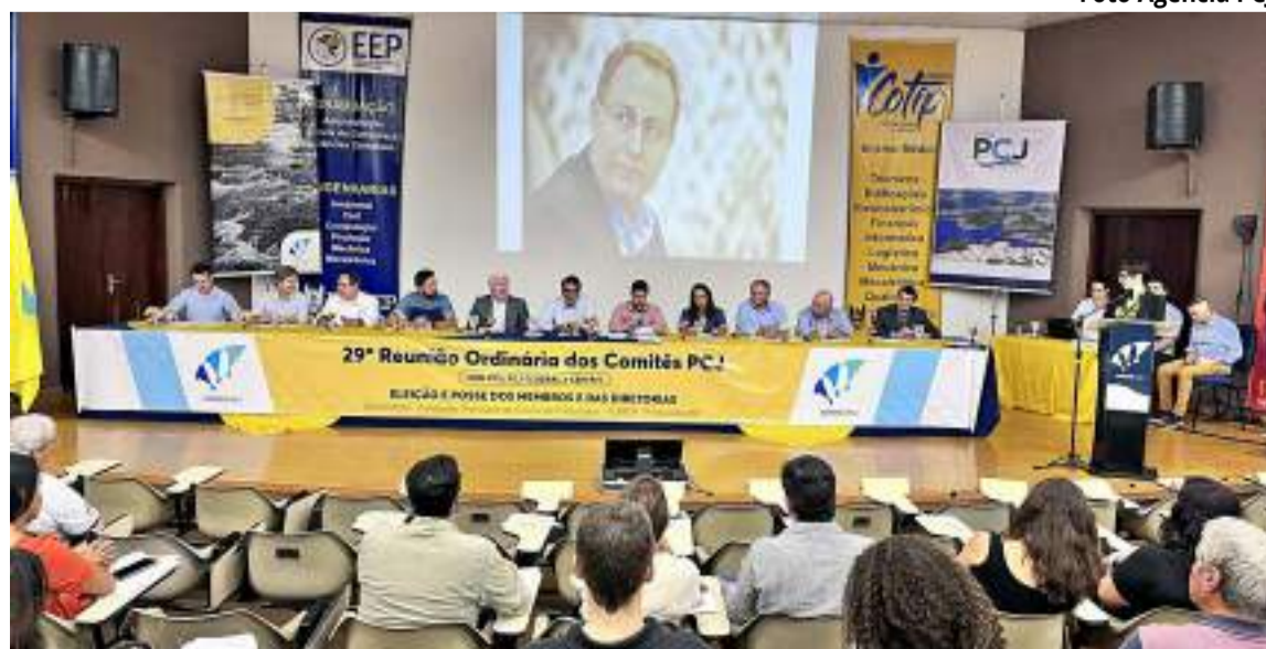
Plenária Comitês PCJ realizada em março de 2023

"Os avanços realizados nessas três décadas foram muito relevantes. Contudo, também se tornou mais complexo garantir a segurança hídrica da região. Avaliando essa história, entendo que esses resultados foram possíveis em razão do comitê de bacias ter se tornado um espaço genuíno de governança.