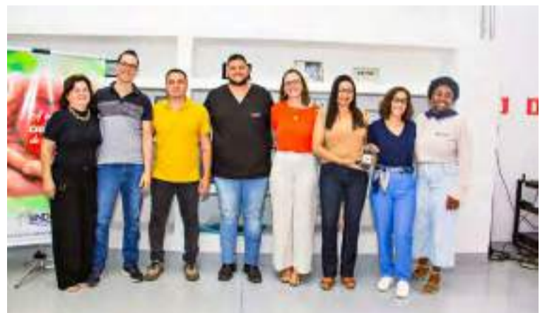
Profissionais do Núcleo de Saúde e Qualidade de Vida.