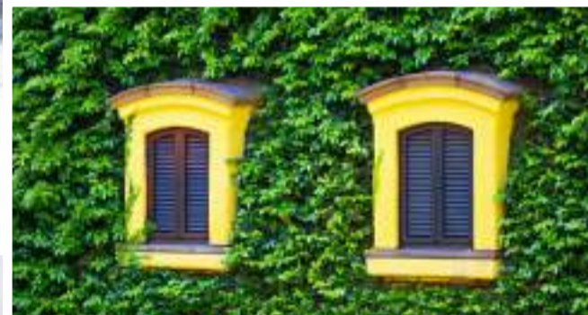
Detalhe Museu Ghibli

Restaurante Uobei: versão mais futurista dos restaurantes japoneses de esteira, o Uobei, em Toquio, conta com cardápios em tablets e pratos preparados por robôs, que chegam em um trilho considerado o mais rápido do mundo. Após selecionar um prato, espera-se cerca de 3 minutos e então aparece uma bandeja já com o pedido. Uma maneira divertida e high tech para as crianças apreciarem a culinária japonesa.