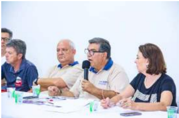
Plenária deste mês deu destaque para os problemas enfrentados nas agências e postos de atendimento.