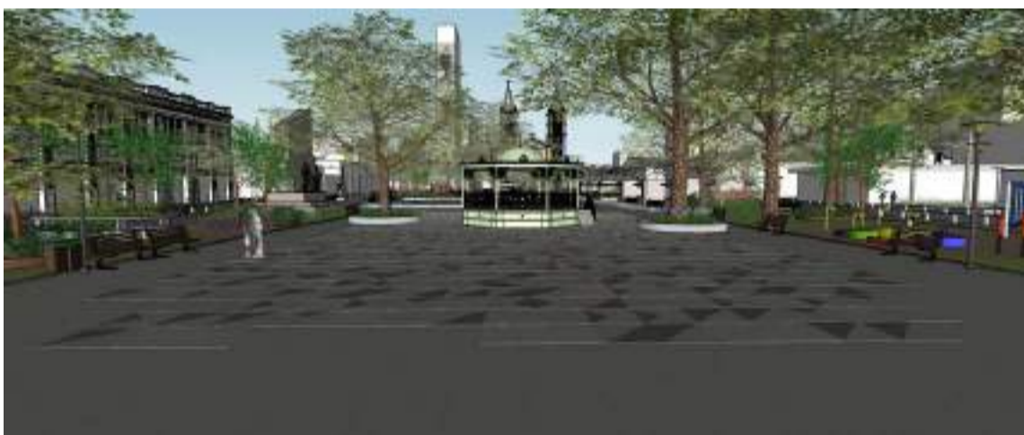
Praça terá ambiente direcionado a eventos, remodelação dos canteiros e berços das árvores e modernização dos equipamentos estruturais

“Um aspecto fundamental que notamos no projeto foi a consideração do fator histórico da Catedral, que inclui a mobilidade e o fluxo de pessoas, que são três elementos muito importantes. Além disso, foi destacado o paisagismo e a iluminação, que revitalizam e embelezam a área, que é um atrativo. Vamos, agora, analisar o que foi apresentado, pensar em possíveis sugestões, mas, basicamente, o projeto todo nos agradou”, declarou Dom Devair.