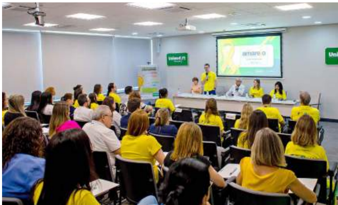
Mais um ano, Unimed Piracicaba abraça o movimento de prevenção ao suicídio

O encontro continuou com aula inaugural do Protocolo de Emergência em Saúde Mental do Hospital Unimed, conduzida pelo médico e diretor da