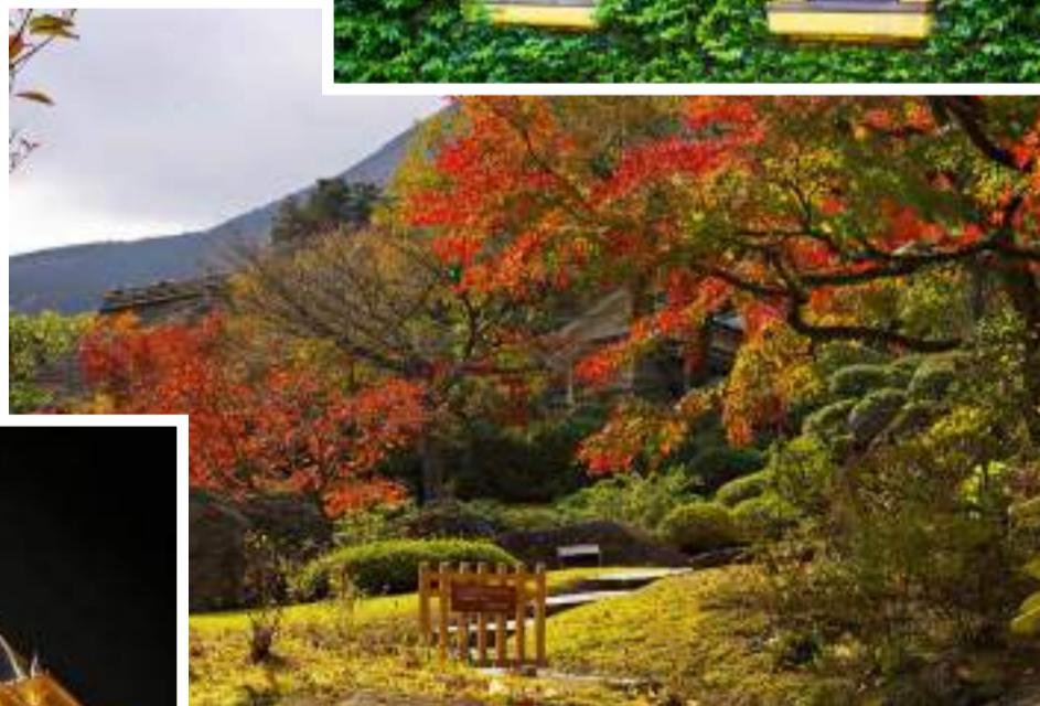
Jardins do Museu Hakone