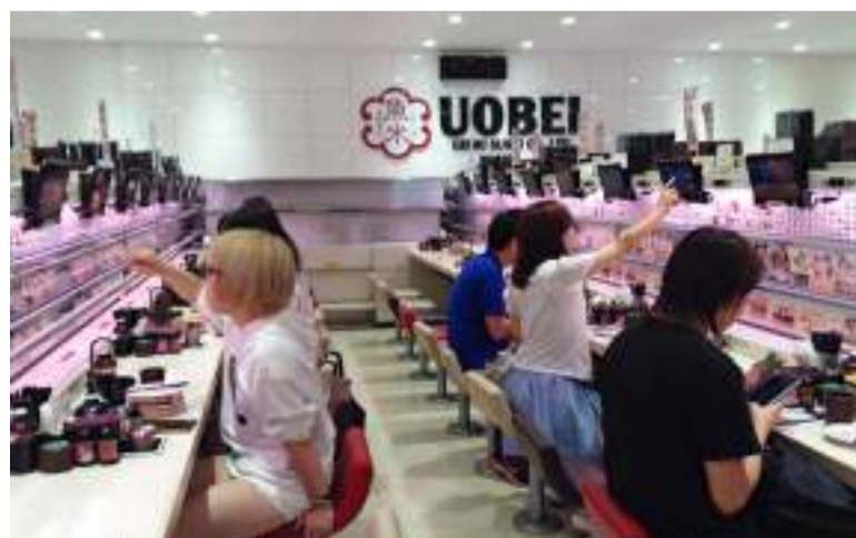
Restaurante com comida em trilho, Uobei, atração para kids