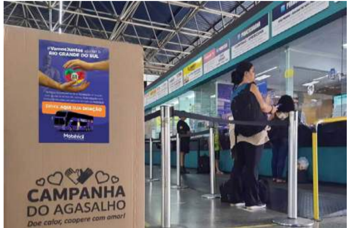
Quem desejar doar peças de roupas deve levá-las na rodoviária e depositá-las nas caixas coletoras disponíveis no guichê da Viação Piracicabana

Quem desejar doar peças de roupas deve levá-las na rodoviária e depositá-las nas caixas coletoras disponíveis no guichê da Viação Piracicabana. O endereço da rodoviária é avenida Armando de Salles Oliveira, 2277, Centro. A logística do transporte das roupas coletadas na campanha até o Rio Grande do Sul é realizada pelas empresas parceiras da Mobifácil, por meio dos ônibus da Piracicabana, Penha, Expresso Maringá, Itamarati, Expresso de Prata, Princesa, União