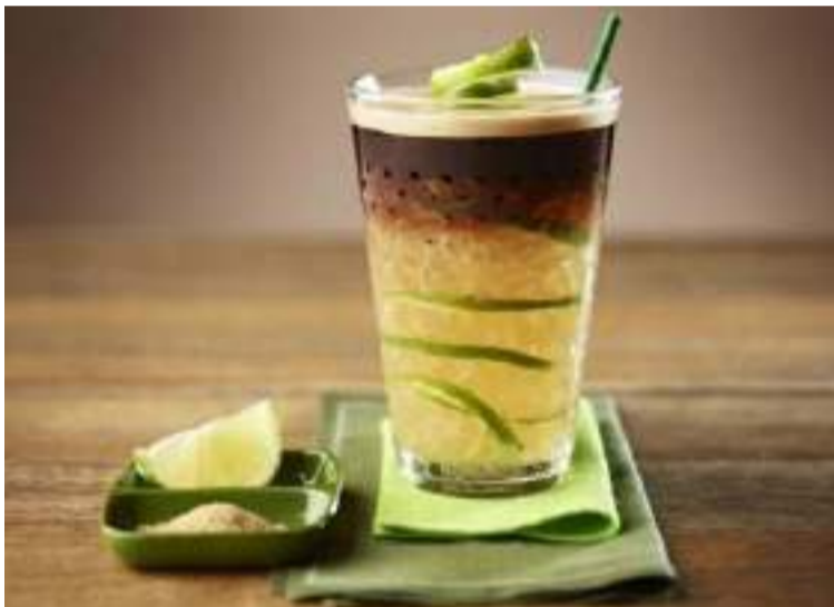
Caipirinha de Café