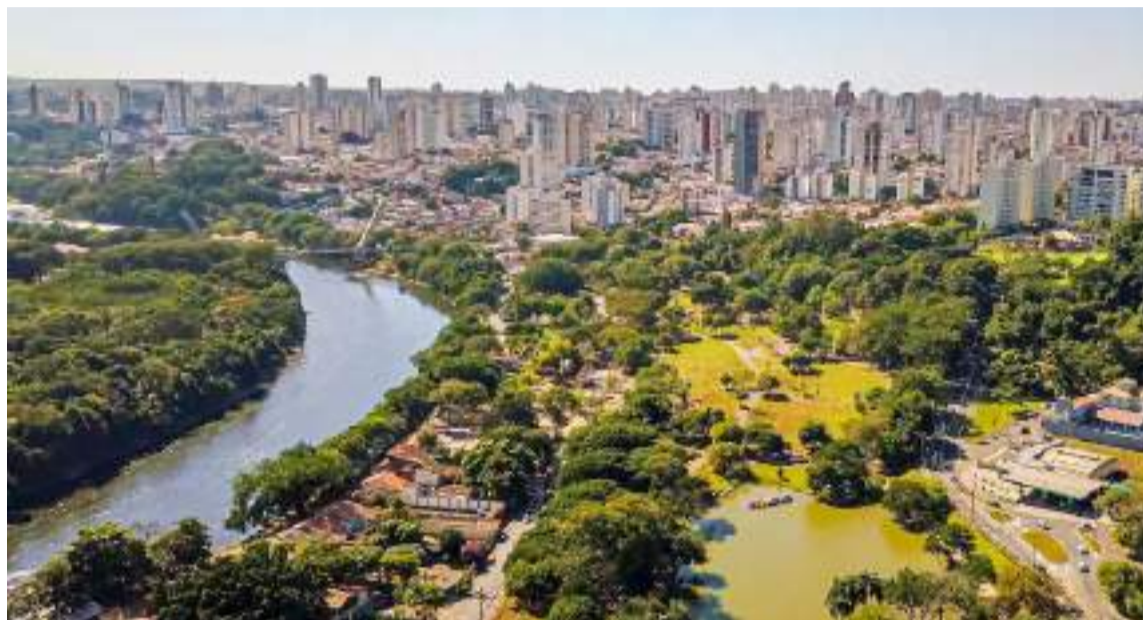
Piracicaba se tornou líder no ranking de cidades do interior do estado de São Paulo com maior alta no preço médio do metro quadrado de imóveis

O G1 também conversou com Rodrigo Joaquim Patah, coordena-