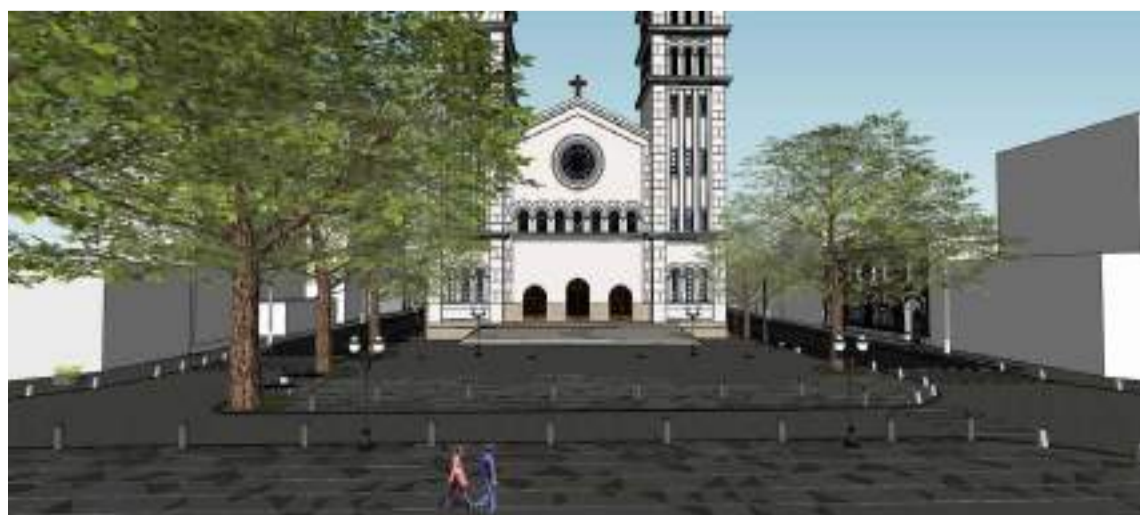
Projeto inclui também a abertura da rua Moraes Barros em frente à Catedral