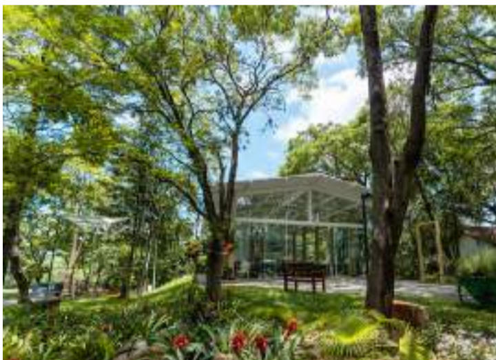
Iniciar o dia participando da Missa Diária às 7h é um verdadeiro convite a a comunhão e reflexão

parquedaressurreicaopiracicaba para ficar atualizado sobre nossos eventos, serviços e histórias inspiradoras que compartilhamos com a comunidade. Visite o site em parquedaressurreicao.com.br ou entre em contato através do WhatsApp nos números (19) 3426-4877 para o Cemitério Parque da Ressurreição e (19) 3376-0853 para a Funerária Ressurreição. Juntos, honramos o passado e encontramos inspiração para o futuro.