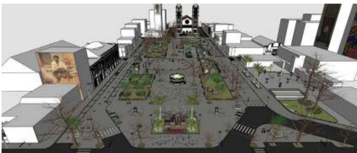
Projeto apresentado é de modernização da praça José Bonifácio e seu entorno, com integração turística entre o centro da cidade, Rua do Porto, Engenho Central e adjacências