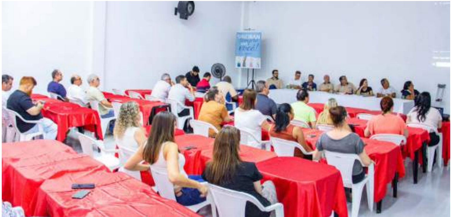
O Sistema Diretivo do SindBan reúne mensalmente todos os diretores da entidade.

"O quadro reforça nossa percepção de existe muita pres-