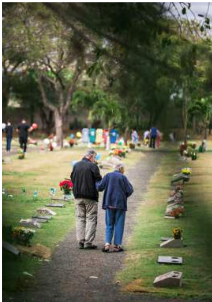
Entre lágrimas e sorrisos, as famílias se abraçaram, compartilharam memórias e honraram a importância dos pais em suas vidas.

confiança com mais de 50 anos de história