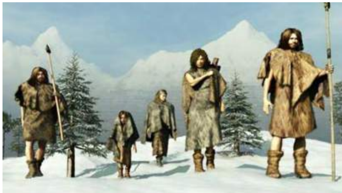
Representação da Era Glacial.

Tais preocupações têm despertado cada vez mais a curiosidade do consumidor, pelo fato de não haver uma clareza em relação a essas informações por parte de muitas empresas. Afinal, se você parar e refletir acerca de qual indústria que não envolve questões que precisam ser revistas com certa urgência, certamente vai chegar a conclusão que são poucas as que se preocupam genuinamente com o que está além da margem de lucro. É impossível se inserir dentro do mercado sem deixar passar algo. Mesmo que muito bem camuflado, mais cedo ou mais tarde algo acende um alerta vermelho, como,