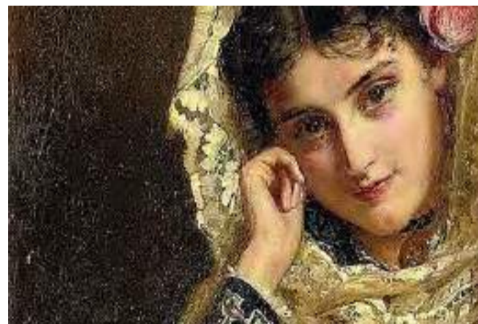
Pintura de John Bagnold Burgess.

Derivado do termo "modus", que em latim denota diferentes modos e costumes de um grupo em dado momento, possui ligação direta com as diferentes características que marcam os estilos abrangentes nesses grupos. Mas não se engane, a moda é um campo amplo que vai além da peça como fator estético.