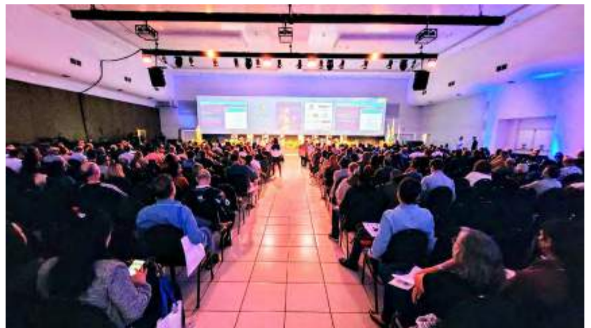
Comitês e Agência PCJ garantem participação no XXV Encob, que acontecerá em Natal/RN de 21 a 25 de agosto

fins lucrativos, com estrutura administrativa e financeira próprias.