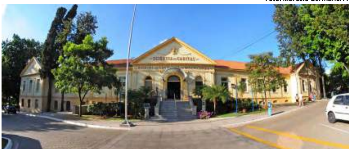
Fachada principal da Santa Casa de Piracicaba, referênciada em assistência médico-hospitalar para 26 municípios da região

Segundo ele, apesar de terem vencido mais uma etapa, as Santas Casas têm grandes batalhas pela frente até que a tabela SUS cubra 100% do que os hospitais efetivamen-