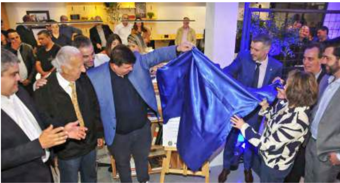
Momento de inauguração da placa