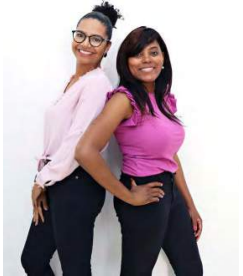
Isabela e Sofia são exemplos de mulheres conscientes de seu valor na sociedade