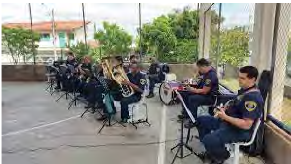
Formação mais recente da Banda em evento na Estação da Paulista.

A GCM também mantém um programa antigo, denominado GCEP, para fazer palestras e distribuir uma cartilha aos estudantes da Rede Pública Municipal, onde são abordados temas difíceis como drogas, gravidez precoce, violência doméstica e sexual, vivência no trânsito, Estatuto da Criança e do Adolescente, Bullying, entre outras, desenvolvidos por Guardas Civis Educadores, especialmente capacitados para estas ações. Essa cartilha é impressa em preto e branco e os alunos que recebem as visitas e palestras, ganham exemplares para colorir.