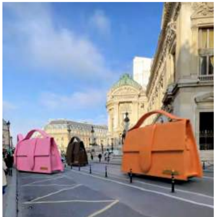
Ação de Marketing da marca Jacquemus.

peças eram costuradas com as vísceras e os ossos das presas. Assim surgiu o início do que hoje é conhecido como vestimenta.