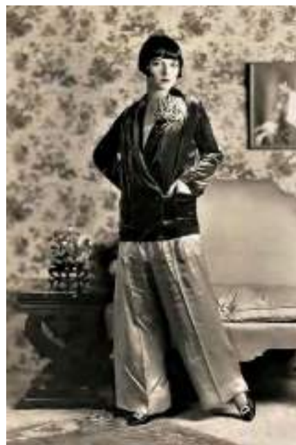
Mulher da década de 1920 vestindo calça.

E não parou por aí. A moda vem sofrendo mudanças constantes e altas renovações, desde estratégias de marketing mirabolantes à engajamento em projetos sociais. Aquele veículo de comunicação para expressar diferentes sentimentos que necessitam ser externados nunca deixou de ser atual. Já pensou que aquela padronagem, textura variada, frase ou mesmo o tecido presente na sua roupa, gera um impacto que vai além do simples ato de vestir? A moda é cíclica, é cultural e histórica. Repensar o consumo desenfreado e a procedência de cada aquisição tornou-se questão de consciência e responsabilidade!