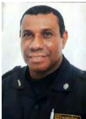
Comandante Sydnei Nunes

https://www.youtube.com/live/3fWNC-35M5el?feature=share