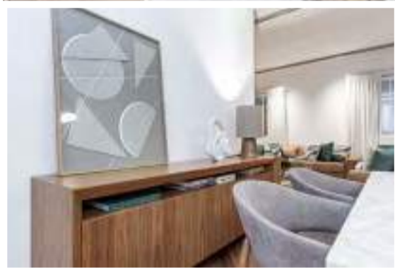
Folha de Piracicaba

O lugar? Um apartamento de 287m 2 , no bairro do Campo Belo, em São Paulo. O objetivo? Trazer acolhimento, aconchego e sofisticação para uma família composta por um casal e um filho de 3 anos. Para isso, o arquiteto Adriano Pita desenvolveu um projeto que trouxesse todas essas necessidades, sem grandes intervenções na estrutura do apartamento, e que conciliasse os estilos diferentes do casal, um mais clássico e outro mais contemporâneo.