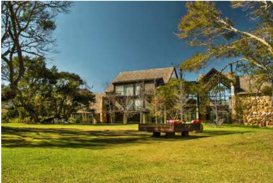
Jardins do Botanique