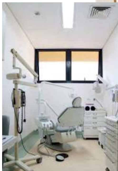
O novo espaço odontológico traz mais segurança e comodidade ao atendimento de urgência em qualquer hora do dia e da noite

donto no Hospital Unimed Piracicaba é mais uma conquista das instituições que acreditam na importância da saúde integral e do cuidado contínuo do paciente”, finalizou Joussef.