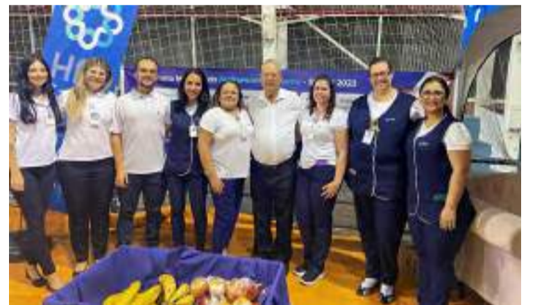
Equipe HFC Saúde