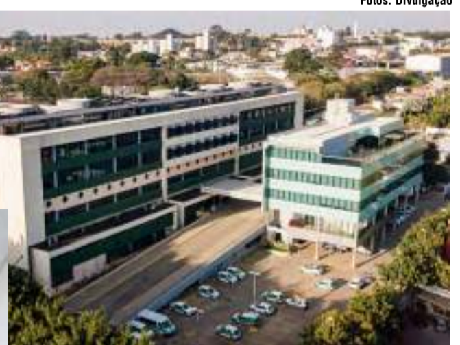
Hospital Unimed Piracicaba e novo Centro Administrativo da Cooperativa