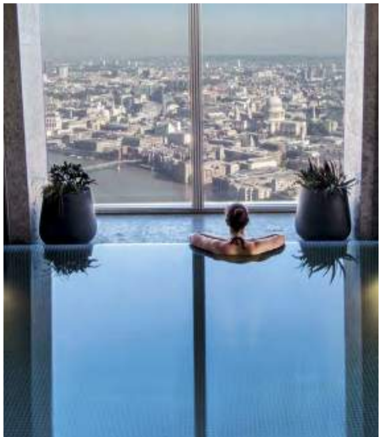
Shangri-La, The Shard, Londres