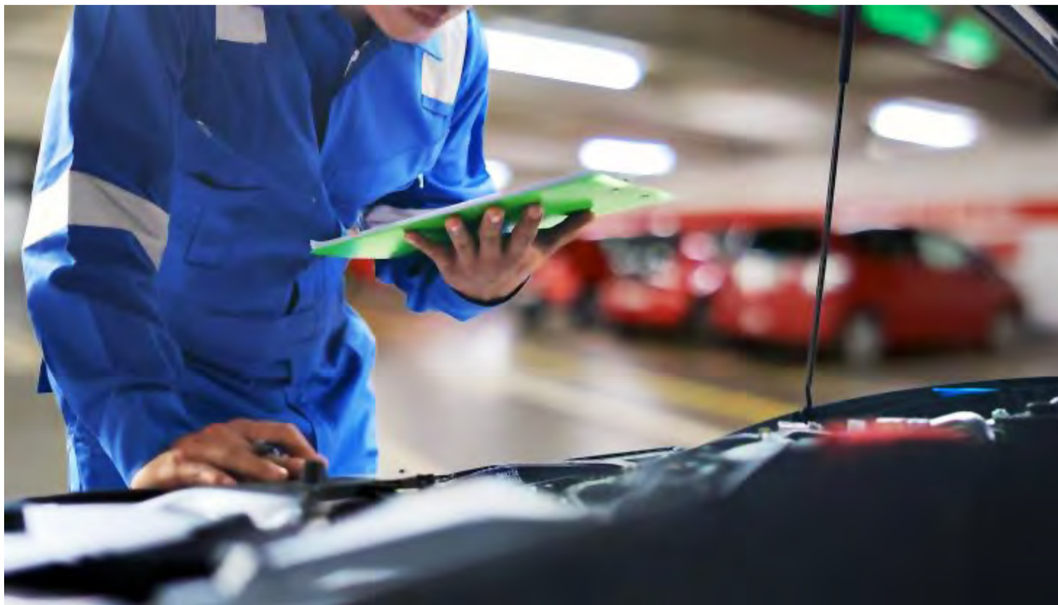
Além de muita pesquisa e uma boa dose de precaução, a compra do próximo - ou do primeiro carro - pode ser fácil com alguns cuidados

Segundo o especialista, há diferença entre com-