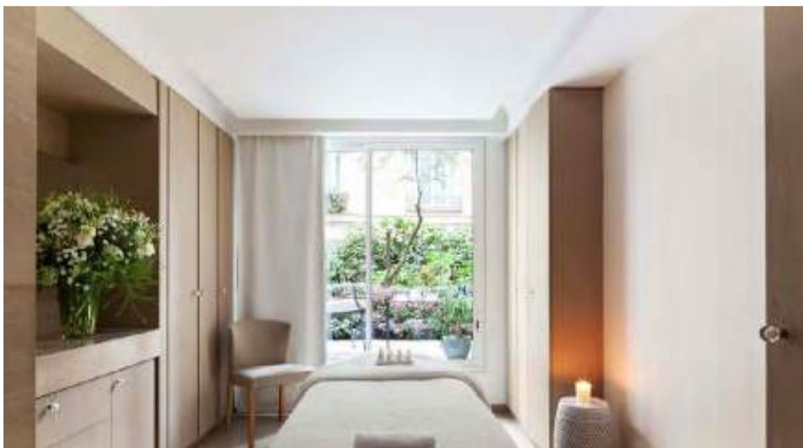
Salas de Spa com varandas e terraço para os jardins do Le Bristol

Nesse quinteto fantástico, não poderia faltar o magnífico Mandarin Oriental, em Nova York, que, tal como muitos outros hotéis de luxo, oferece uma variedade de comodidades e experiências únicas que tornam o serviço de "day use" particularmente atraente. Na experiência, pode-se desfrutar dos quartos e suítes do hotel, com um toque de elegância contemporânea e vista deslumbrante do skyline de Manhattan, além de Spa de classe mundial, com infinidade de tratamentos para relaxamento de corpo e mente. Sem contar o restaurante e bar prestigiosos deste ícone da hotelaria em New York, onde se prova culinária requintada e coquetéis autorais. Fitness Center e piscina complementam os momentos de relax, para revigorar, antes de percorrer na redondeza ícones locais como Columbus Circle, Central Park e Times Square.