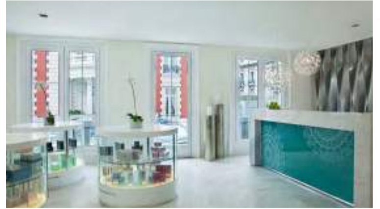
Spa Four Seasons Buenos Aires