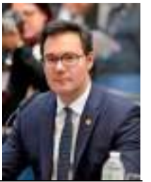
Alex Madureira, piracicabano, é Deputado Estadual (PL) e Corregedor da Assembleia Legislativa do Estado de São Paulo.

Por isso, saudar o nosso rio, é reverenciar nossa história. Foi a partir dele, e com ele, que crescemos em gratidão e amor por nossa terra. E que ela siga próspera para as futuras gerações. E que elas, ao compreenderem a força deste nosso rio, possam continuar a preservá-lo e fazer dele o fio condutor da nossa história. Parabéns Piracicaba que eu adoro tanto.