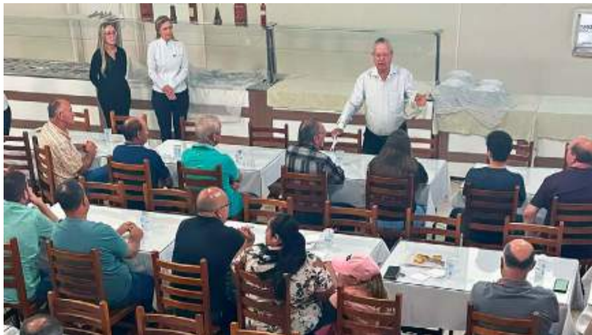
Encontro de Associados

3º Encontro da AFOCAPI com os associados