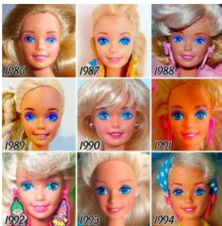
Variações dos rosto da boneca Barbie Nas décadas de 80 e 90

presente em uma indústria majoritariamente dominada por homens. Fica clara a percepção de como o patriarcado conseguiu imbuir a sociedade a ponto de fazer meninas e mulheres acreditarem que para serem boas o suficiente elas precisariam ser iguais a um brinquedo, ou melhor, um objeto. O real significado de igualdade e poder de escolha da mulher que a boneca representava, por ameaçar a integridade masculina, acabou sendo deturpada ao longo dos anos como forma de desestimular um senso de igualdade entre os gêneros. Sejamos honestos, se você não se encaixa no padrão heteronormativo, certamente já deve ter se sentido colocado nesse lugar de inferioridade. Portanto, acho importante termos um cuidado maior ao filtrar o que chega até nós e o que decidimos ou não compartilhar com os demais. Muitas coisas ainda estão enraizadas e é mais que necessário o avanço em busca de equiparação.