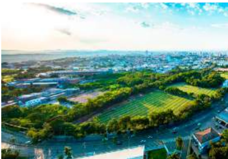
O belo jardim do cemitério, com suas flores e árvores, representa a vida e a serenidade

ca diariamente a cuidar de cada detalhe para oferecer um ambiente acolhedor e tranquilo, um verdadeiro cemitério-jardim e memorial. O belo jardim do cemitério, com suas flores e árvores, representa a vida e a serenidade que buscamos proporcionar às famílias que nos