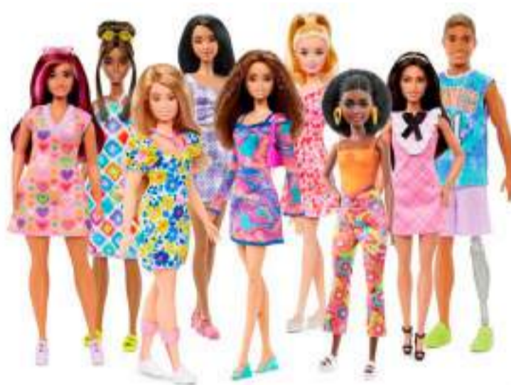
Linha Fashionistas 2023 foca em diversidade e representatividade

A partir dos anos 2000 a boneca sofreu um dos reboots mais perceptíveis, ganhando novas curvas, um rosto menos infantilizado e diferentes versões ligadas a moda, filmes e afins, atrelados à personagem. Atualmente, a identidade da marca vem buscando cada vez mais retratar a diversidade e a inclusão. Diferentes tons de pele, alturas, com vitiligo, prótese mecânica e até síndrome de down, a Barbie está finalmente conseguindo reconquistar a imagem de empoderamento feminino tão prezado por sua criadora no começo de tudo.