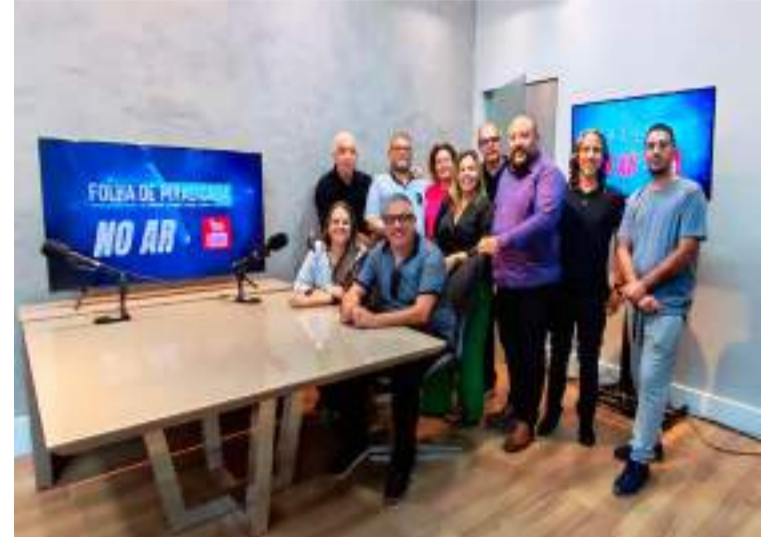
Equipe Folha de Piracicaba

E não para por aí. Estudando a realidade do mercado com o passar dos anos, a equipe identificou que criar materiais audiovisuais são importantes e oferecem mais opções, por meio de uma parceria com XMT digital, responsável pela realização do conteúdo au-