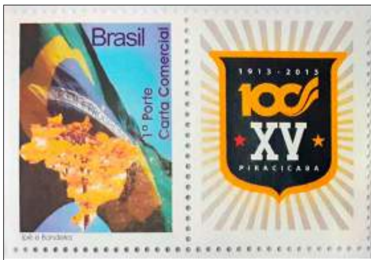
Selo comemorativo ao Centenário do XV de Novembro.