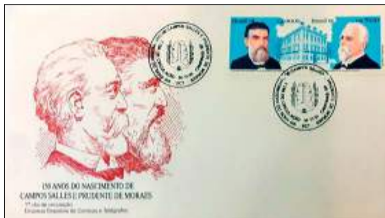
Envelope com o selo comemorativo dos 150 anos de Prudente de Moraes