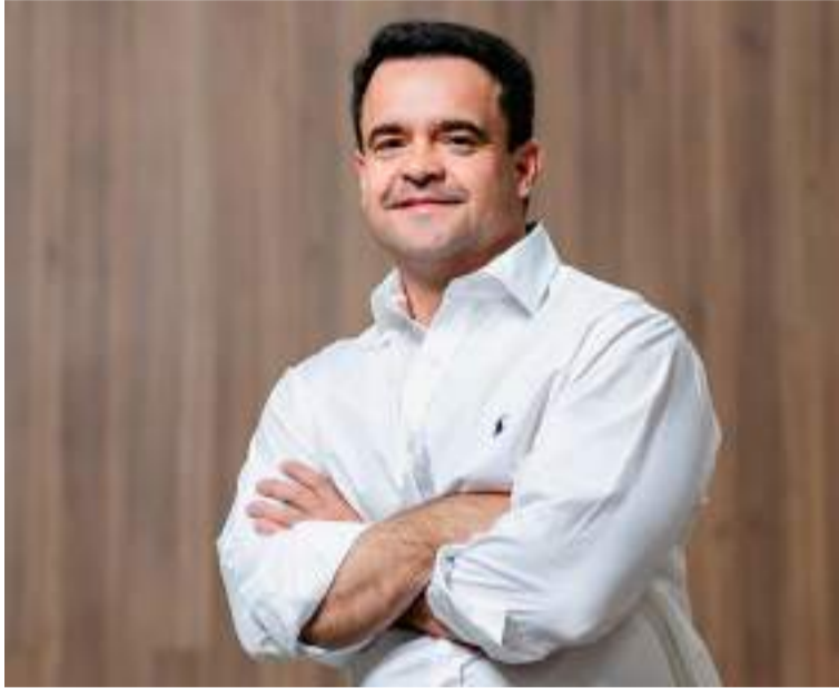
O Simespi tem atuado de forma efetiva como parceiro do poder público, apoiando iniciativas, propondo e implementando projetos

faltam para explicar a representatividade e importância da nossa cidade”.