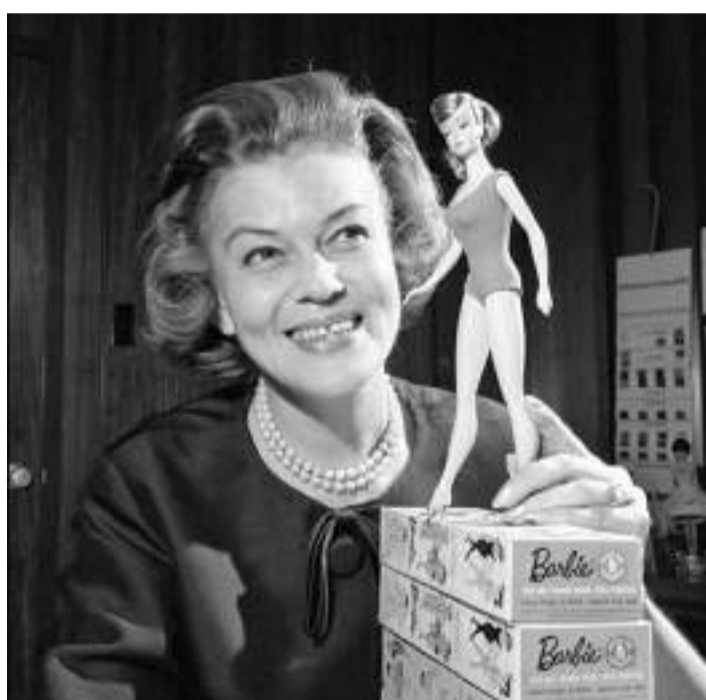
Barbie Swirl Ponytail (1964)

Tudo no universo cor de rosa da Barbie sempre foi pensado para refletir o estilo da época. Desde o penteado ao fashion pack vendido separadamente para que a boneca fosse vestida. Cada detalhe era projetado para representar o que estava em alta na temporada. As bonecas do fim da década de 50 e início de 60 apresentavam penteados populares, como o rabo de cavalo e a franja lateral, cortes chanel na altura do queixo e outros, em sua grande parte geralmente trajando um maiô de banho ou peças com a estética presente nas vitrines.