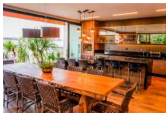
Folha de Piracicaba

Uma cozinha gourmet com 50 m 2 , integrando as áreas externa e interna para quem ama cozinhar e vivenciar a natureza. Este foi o projeto solicitado pelos moradores e realizado pelo Estúdio Melissa Angelis Arquitetura, que ainda intercala momentos de sossego e intimidade com uma vida de eventos com a casa cheia!