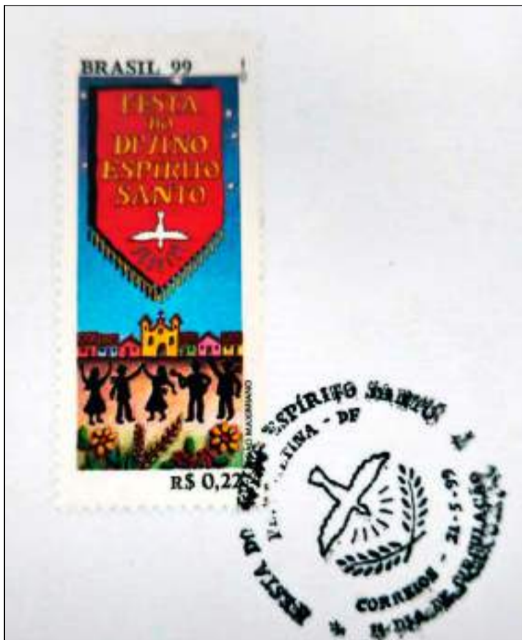
Selo da Festa do Divino de 1999.