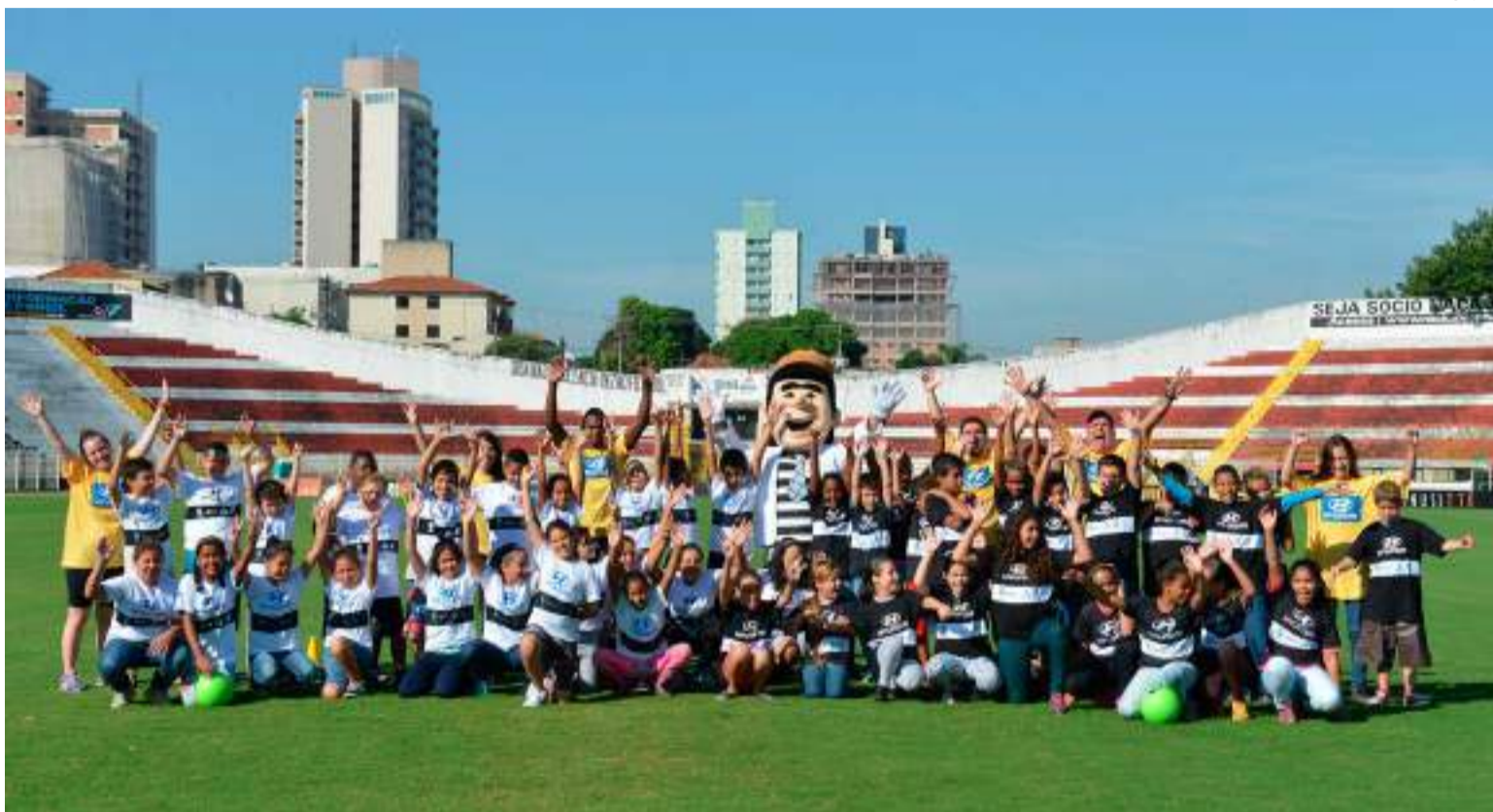
Em 2011, a Hyundai iniciou uma ação bem regionalizada com o clube de futebol da cidade, o XV de Piracicaba