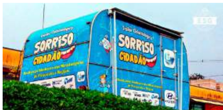
"Sorriso Cidadão", projeto itinerante de saúde bucal, que é uma iniciativa do Sindicato dos Metalúrgicos de Piracicaba

Nestes últimos 11 anos, a Hyundai tem contribuído para melhorar a vida das pessoas e revolucionar a mobilidade, trazendo ainda mais tecnologia e segurança para nossas ruas. Tanto HB20 como Creta, fabricados com muito orgulho em Piracicaba, estão entre os veículos com mais equipamentos de segurança em suas respectivas categorias e seguem conquistando clientes por todo o Brasil.