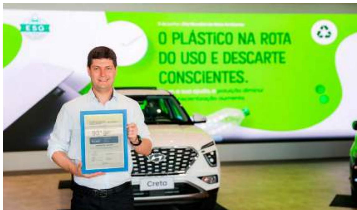
Certificação Lixo Zero