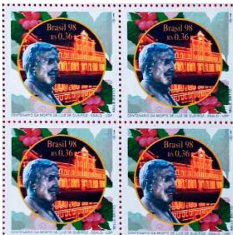
Selo comemorativo da ESALQ, 1998, no Centenário de morte de seu patrono, Luiz de Queiroz