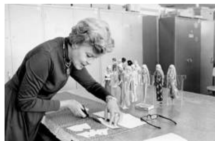
Diferentes modelos de Barbie da década de 70

Na década de 70 a boneca começou a sofrer modificações, como um novo molde de rosto que agora levava cílios realistas, além de uma moda totalmente extravagante recheada de estampas, cores e peças marcantes, como a famosa calça boca de sino.