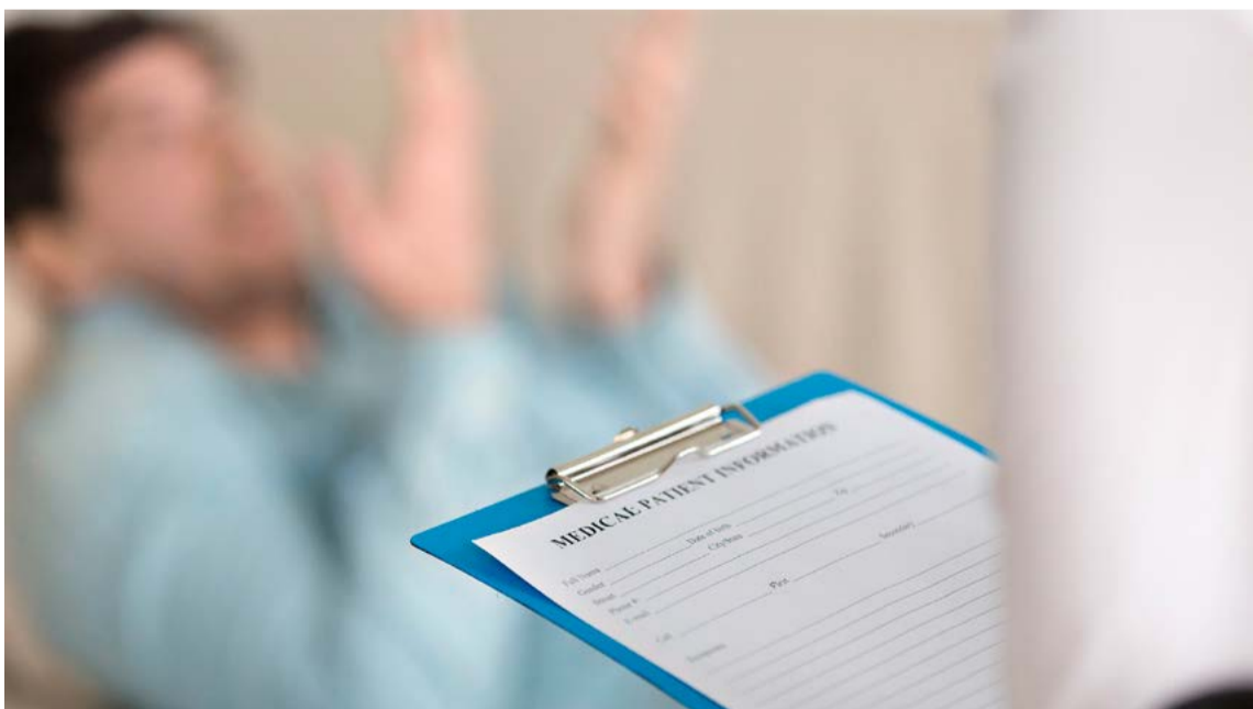
Anhanguera de Piracicaba oferece atendimentos de saúde a preços populares