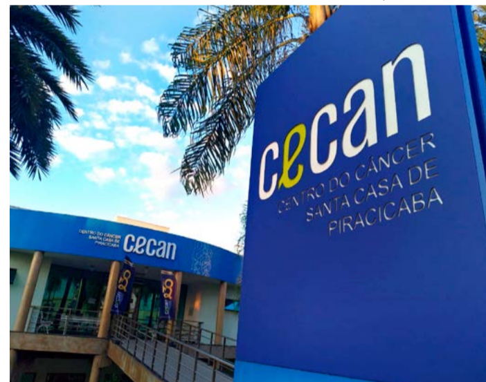
O CECAN - Centro do Câncer da Santa Casa de Piracicaba completa 30 anos

O CECAN- Centro do Câncer da Santa Casa de Piracicaba completa 30 anos de existência e, em comemoração a data, recebeu na noite da última quinta-feira, 20, membros de entidades representativas e órgãos go-