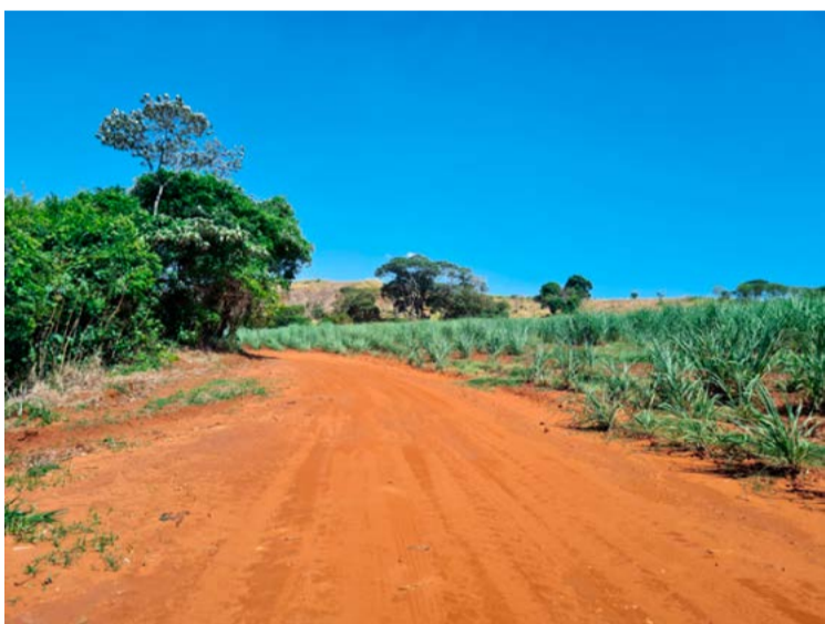
Figura 2. Aceiro de fragmento florestal com medida e manutenção adequadas

2 - Aceiros de estradas, rodovia municipal, estadual ou federal e via de acesso movimentada.