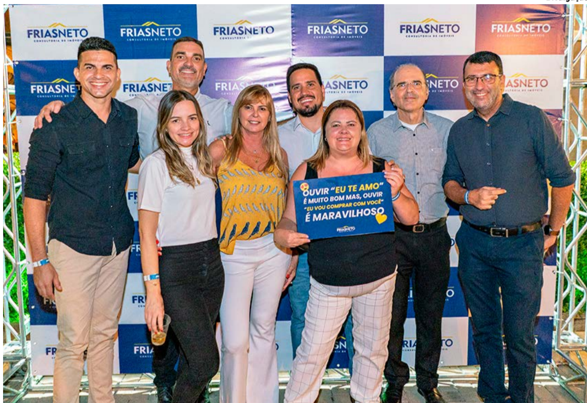
Meta batida pela equipe de lançamentos

Provando que o tema da convenção “Faça Acontecer”