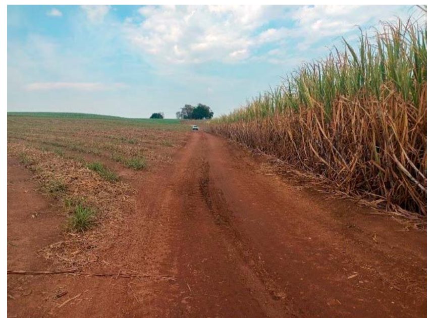
Figura 4. Carreador interno com medida e manutenção adequadas