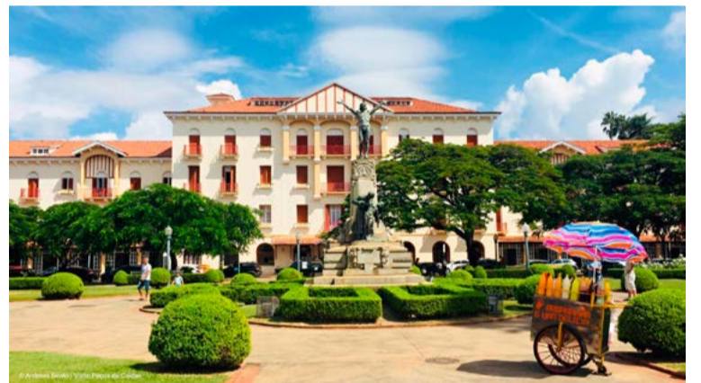
Poços de Caldas