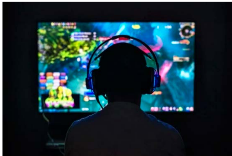
O Discord é uma plataforma de comunicação em tempo real, projetada para comunidades online, principalmente para jogadores de videogames

Os personagens desta história da vida real não querem se identificar. Eles têm medo. E a ameaça, apesar de rondar o mundo virtual, vem ganhando força no mundo real. Por isso, seus