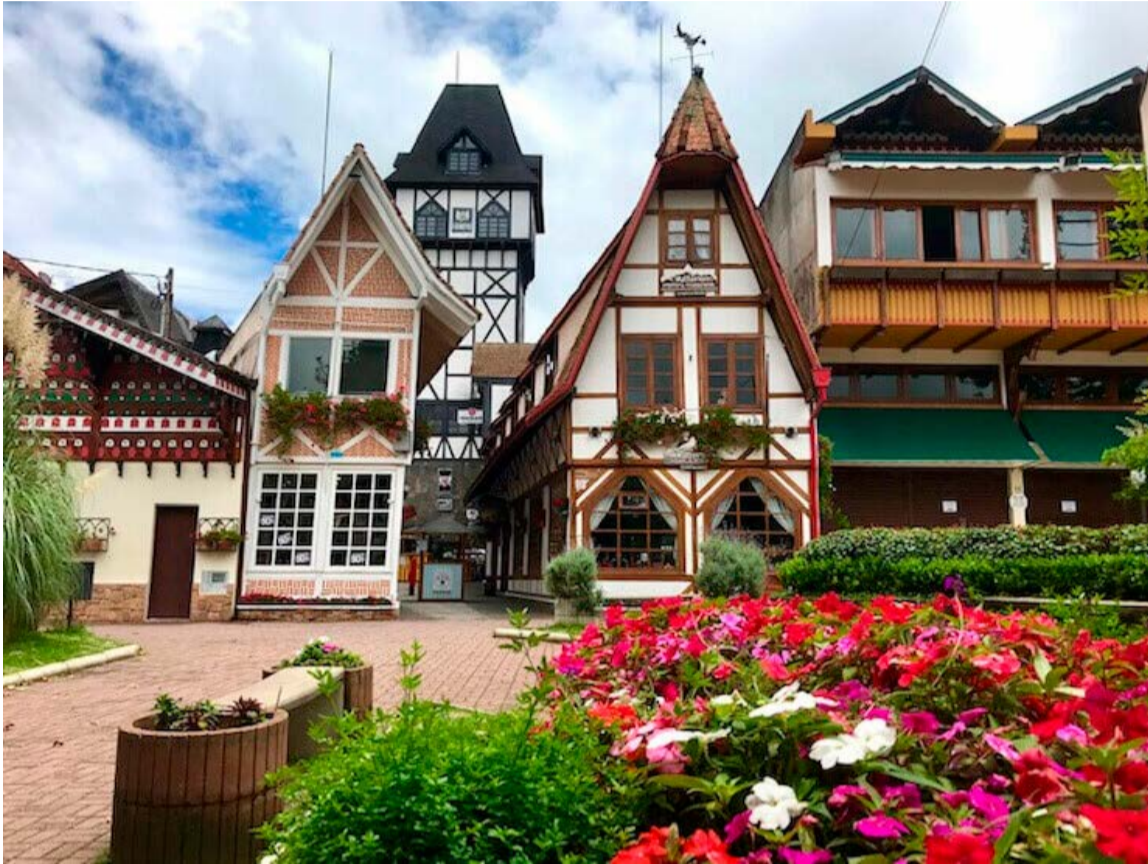
Campos do Jordão